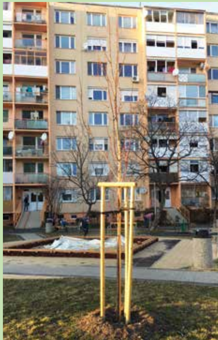
Na jeseň mesto vysadilo nové stromy, ktoré sa čokoro zazelenajú.