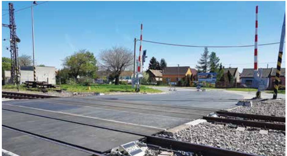
Ojedinelý pohľad na prázdne železničné priecestie.

Mesto požiadalo o stanovisko aj BSK, ktoré ocenilo zavedenie nových vlakov od polovice roka 2018, pretože nastalo výrazné zlepšenie dopravnej obslužnosti v Bratislavskom kraji. Problém však vznikol na križovaní cestných komunikácií so železničnou traťou v Bernolákove a v Senci, kde vznikajú zdržania nielen individuálnej ale aj autobusovej dopravy. Podľa informácií z BSK, na rokovaní zástupcovia ŽSR tvrdili, že priecestné zabezpečovacie zariadenie pracuje správne a jeho ďalšia úprava nie je možná. V preklade to znamená, že čas, kedy sú rampy spustené, nie je možné skrátiť.