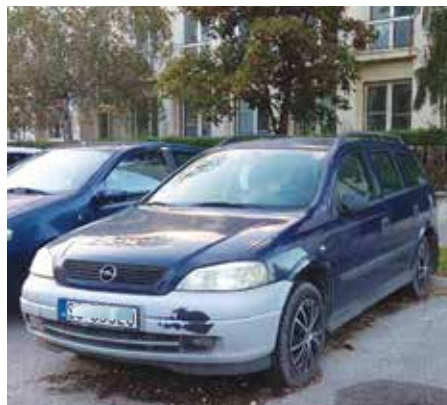
Staré auto bez STK a EK, ktoré už bolo odstránené.

V zmysle zákona o odpadoch má v prvom rade povinnosť odstrániť staré vozidlo držiteľ vozidla a ak túto povinnosť nespĺní, tak správca cesty, prípadne obec. V meste Senec bola v súčasnosti výkonom činností v oblasti odstraňovania starých vozidiel poverená Mestská polícia Senec. Ak nebude vedieť určiť držiteľa vozidla ani za pomoci štátnej polície,