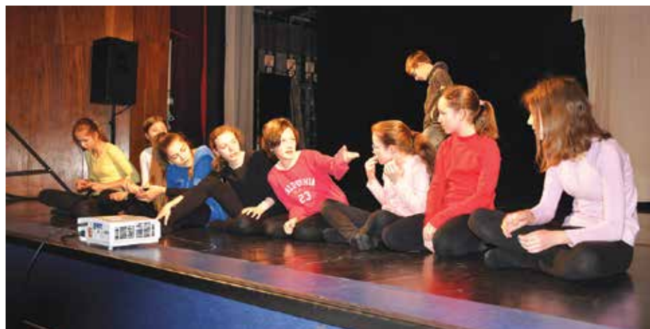
Členovia DDS Mačky v kufri na doskách, ktoré znamenajú svet.

Samotná súťaž začala vystúpením DDS Mačky v kufri zo ZUŠ Senec, ktorí zahrali divadelnú adaptáciu príbehu Roalda Dahla Čarodejnice. Víťazi postupujú do celoštátneho kola súťaže