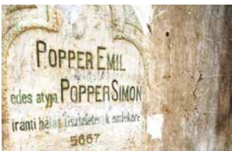
Odcudzená pamätná tabuľa rodiny Popperovcov.

Prehliadka stavby sa začala vo vnútri. Zástupca zhotoviteľa stavby prezentoval doteraz vykonané práce, ktoré pokračujú podľa harmonogramu. Drevená strešná konštrukcia bola obnovená a strešná krytina kompletne vymenená. Je hotová rekonštrukcia čelnej fasády a v prípade priaznivého počasia čoskoro prídu na rad aj bočné fasády. Ozdobné prvky interiéru, farby stien, podlaha a osvetľovacie telesá budú reštaurované a obnovené podľa zachovaných písomných a obrazových záznamov. Prvky, o ktorých sa nezachovali informácie, budú vyhotovené v dobovom štýle židovských sakrálnych stavieb. Pod odstránenou dlažbou v Synagóge bol objavený zvyšok pôvodných základov bimy, vyvýšeného miesta uprostred modlitebne, kde bol pôvodne umiestnený pult, z ktorého sa predčítavalo z posvätnéj Tóry. Nález bol zadokumentovaný Krajským pamiatkovým úradom.