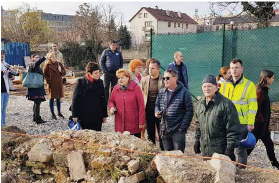
Predstavitelia mesta vo dvore synagógy.

Vyšla najavo aj nemilá skutočnosť, že pamätná tabuľa rodiny Popperovcov bola