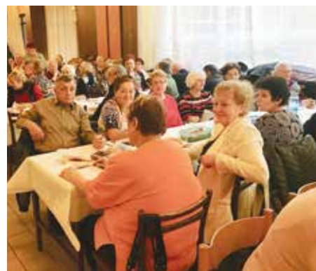
Výročná schôdza ZO SZTP.