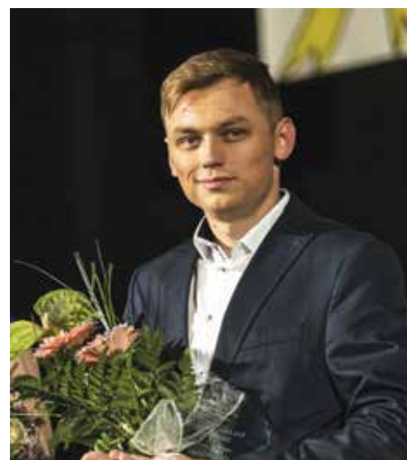
Náš skvelý automobilový pretekár Mašo Homola.