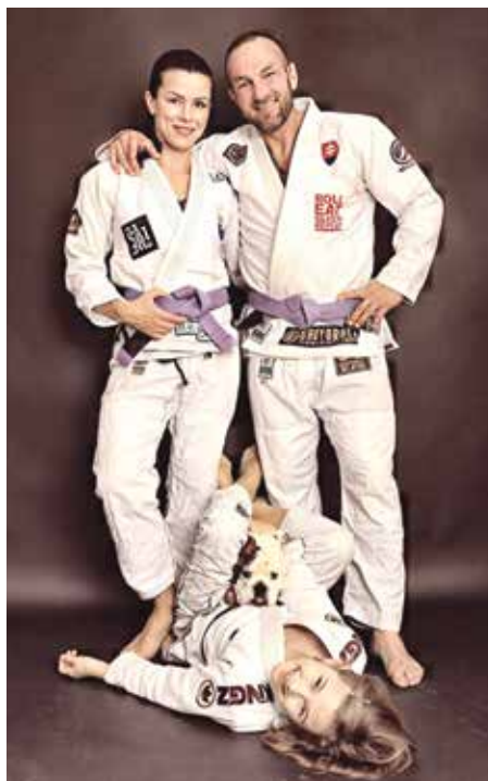
Rodina Sitárovcov.

V brazílskom jiu-jitsu sa snažíme súpera stiahnuť na zem a tam ho dostať do pozície, ktorá bude pre neho nekomfortná.