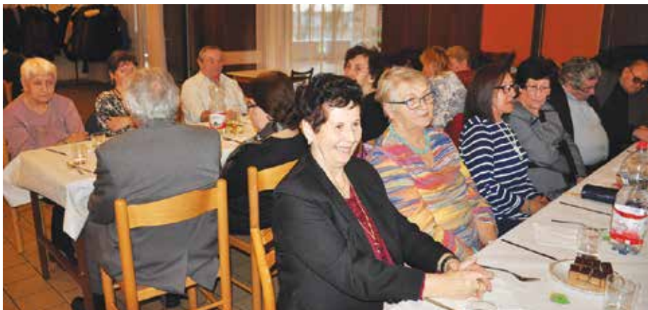
Aktuálny počet členov Klubu dôchodcov pri MsÚ v Senci je 338.