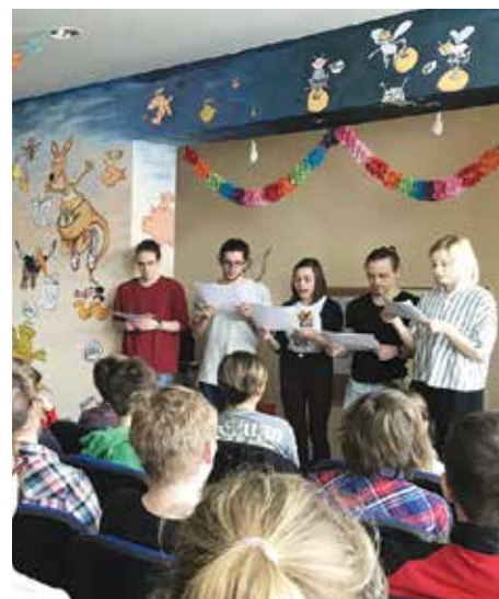
Študenti bábkohereckv v akcii.