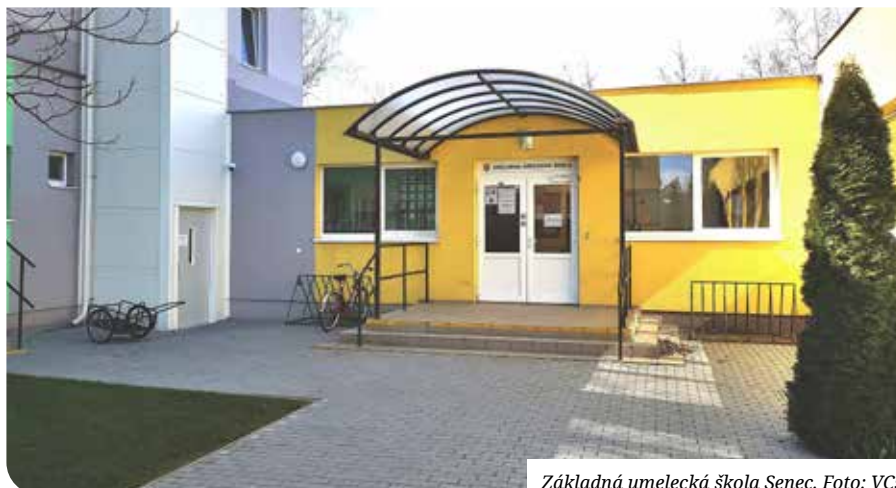
Základná umelecká škola Senec.

Na kuriózne situácie si už pomaly zvykáme. Zvyčajne sa týkajú technických problémov, keď nám na jednej hodine všetko funguje, ale na druhej, kedy robíme s technikou to isté, nám nefunguje nič.