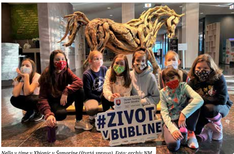
Nella v tíme v Xbionic v Šamoríne (štvrtá sprava).