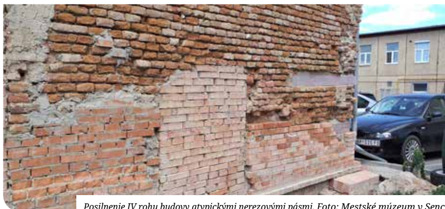
Posilnenie JV rohu budovy atypickými nerezovými pásmi.

zachoval pôvodný barokový interiér tvorený dvojloďovou dispozíciou, ktorej placky nesú klenuté nosné pásy dosadajúce na obvodové múry a okosené kamenné piliere s profilovanou pätkou a hlavicou. Budova je postavená z pálenej tehly a vápennej omietky so zaujímavým technickým riešením základov stavby: V hĺbke 2m sa nachádzajú priečne murované oporné múry s oblúkmi, ktoré posilňujú statiku základov. Použitie tejto technológie nám napovedá, že budova bola postavená pravdepodobne na mäkkom - vodnatom podlaží. Celkové pôvodné vyhotovenie interiéru a najmä použitie opracovaných kamených pilierov poukazuje na mieru reprezentácie samotného investora, ktorý si mohol dovoliť istú úroveň aj pri tomto type stavby. O hlavnej budove zaniknutého hostinca stojacej na uličnej čiare dnešného Mierového námestia vieme, že vznikla zlúčením troch starších meštianskych domov niekedy v polovici 18. storočia. Predmetná hospodárska budova však vznikla zrejme ako novostavba ukončujúca dvorový areál hostinca. Tehly nesúce kolky C. F. E. poukazujú na to, že investorom mohol byť kráľovský taverník, gróf František II. Esterházy (1683–1754) alebo jeho rovnomenný syn, uhorský dvorský kancelár, gróf František III. Esterházy (1715–1785). Na dôležitosť hostinca z hľadiska panstva naznačuje aj skutočnosť, že po požiari, ktorý v roku 1776 zničil aj senecké Collegium Oeconomicum, bol za krátky čas obnovený.