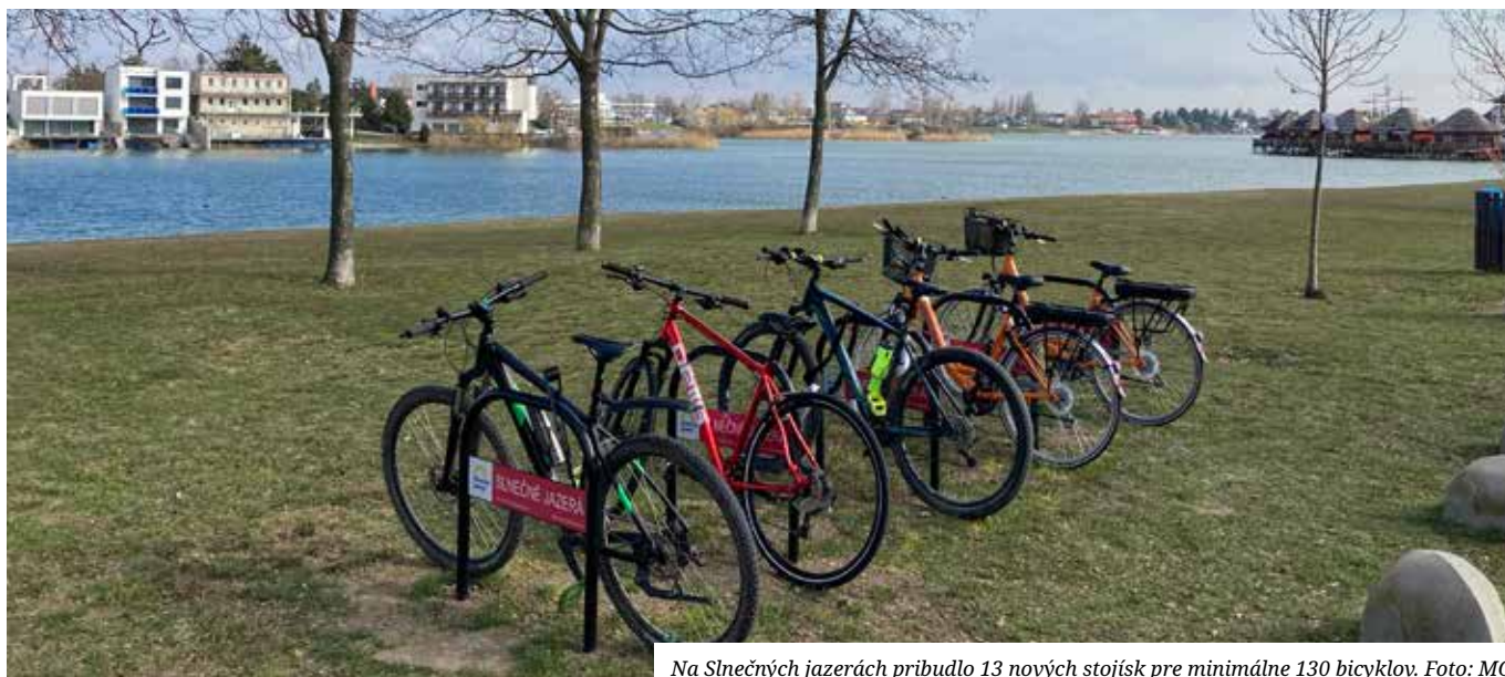
Na Slnecných jazerách pribudlo 13 nových stojísk pre minimálne 130 bicyklov.