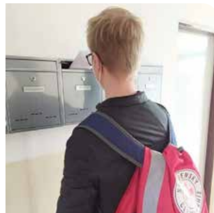
Roznášanie obálok s rúškami.

Mesto Senec kúpilo viac ako 3.500 respirátorov. Útvár sociálnych služieb mesta zabezpečil prípravu obálok s dvomi respirátormi pre Senčanov od 62 rokov pri dodržaní prísnych hygienických opatrení. S roznášaním pomáhala mládež Slovenského Červeného kríža. Ďakujeme. MO