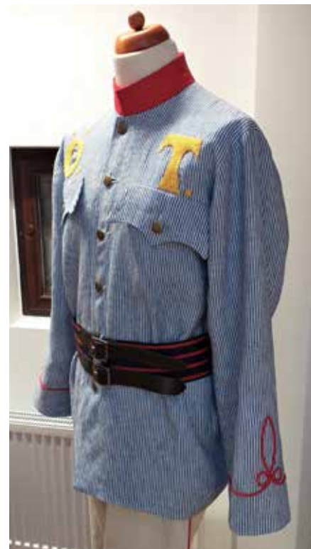
Rekonštrukcia uniformy dobrovoľných hasičov zo Slovenského Grobu z roku 1891 pripravená na svoje umiestnenie v expozícii.