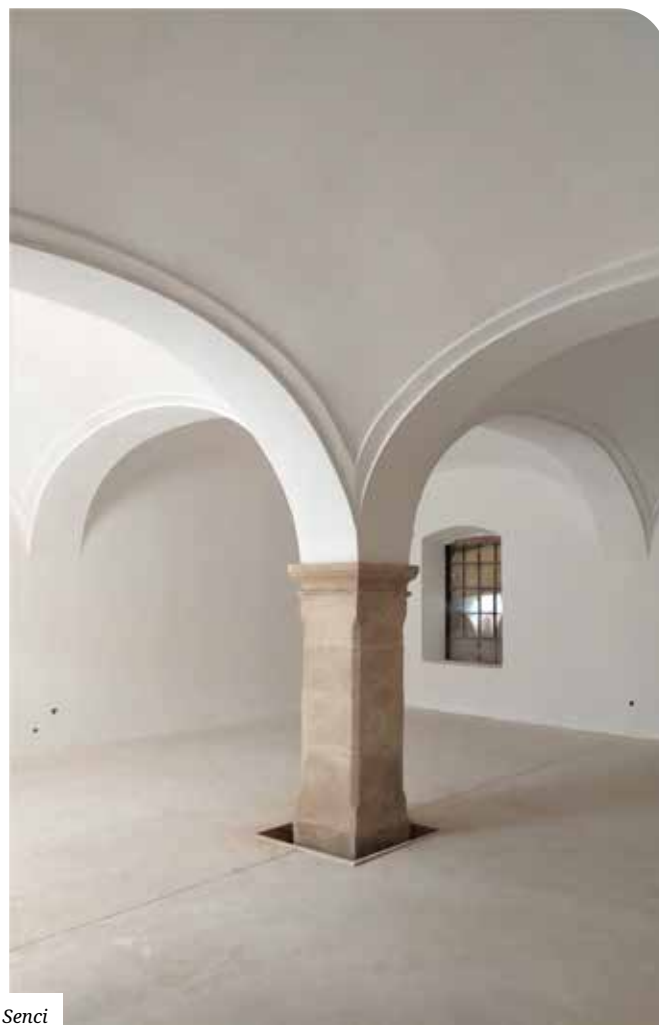
Pohľad do interiéru pred rekonštrukciou a v auguste 2019.