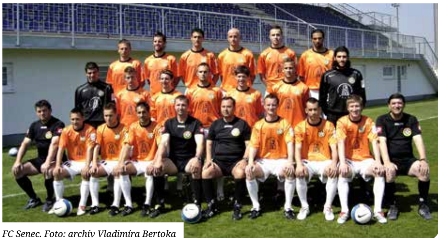
FC Senec.