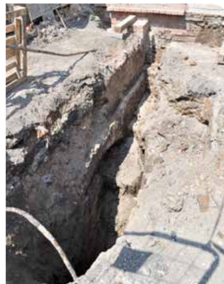
V hĺbke sa ťahajúce oporné múry s oblúkovitým zakončením posilňujú statiku základov na viacerých miestach.

Nenápadná prízemná stavba so sedlovou strechou v susedstve autobusovej stanice je niekdajšia hospodárska budova patriaca do areálu tohto hostinca. V budove sa