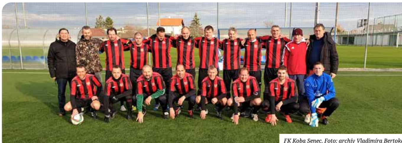
FK Koba Senec.