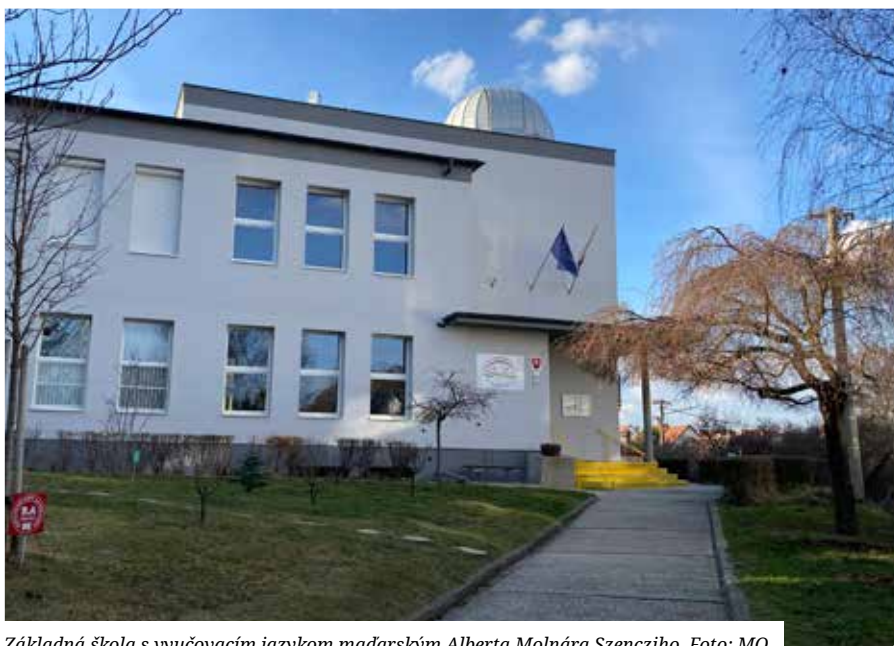
Základná škola s vyučovacím jazykom maďarským Alberta Molnára Szencziho.

Rada by som vyslovila poďakovanie kolegom, ktorí sú úžasní, učia za každých podmienok, zaujímajú sa o svojich žiakov, snažia sa, aby mali motiváciu učiť sa.