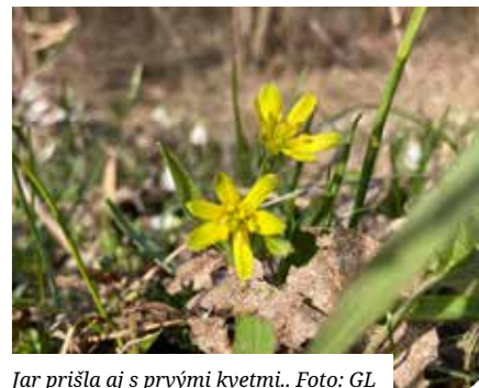
Jar prišla aj s prvými kvetmi..