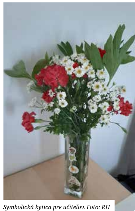
Symbolická kytica pre učiteľov.

Každý rok, 28. marca, mesto Senec oceňuje vybraných učiteľov z každej školy a školského zariadenia na svojom území. Tento rok je to však iné. Mesto sa rozhodlo poďakovať každému učiteľovi za jeho prácu, odhodlanosť a vytrvalosť, a to aj napriek nesmierne náročným podmienkam, ktoré priniesla pandémia. Uvedomujeme si, že za každým učiteľom v našom meste stojí jedinečný príbeh písaný realitou