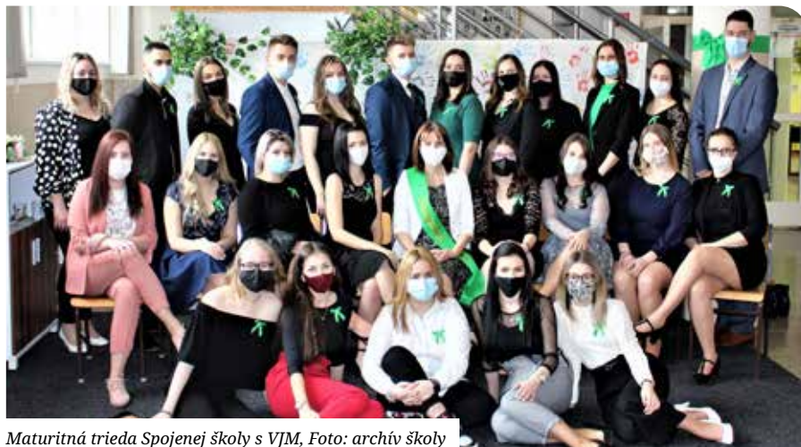
Maturitná trieda Spojenej školy s VJM, Foto: archív školy

Iskolánk fennállásának több mint hatvanéves történetében még nem fordult elő, hogy békeidőben ne került volna sor szalagavatóra. Amint a helyzet lehetővé tette, ebben az iskolaévben is kiosztottuk végzős diákjainknak a remény zöld szalagját.