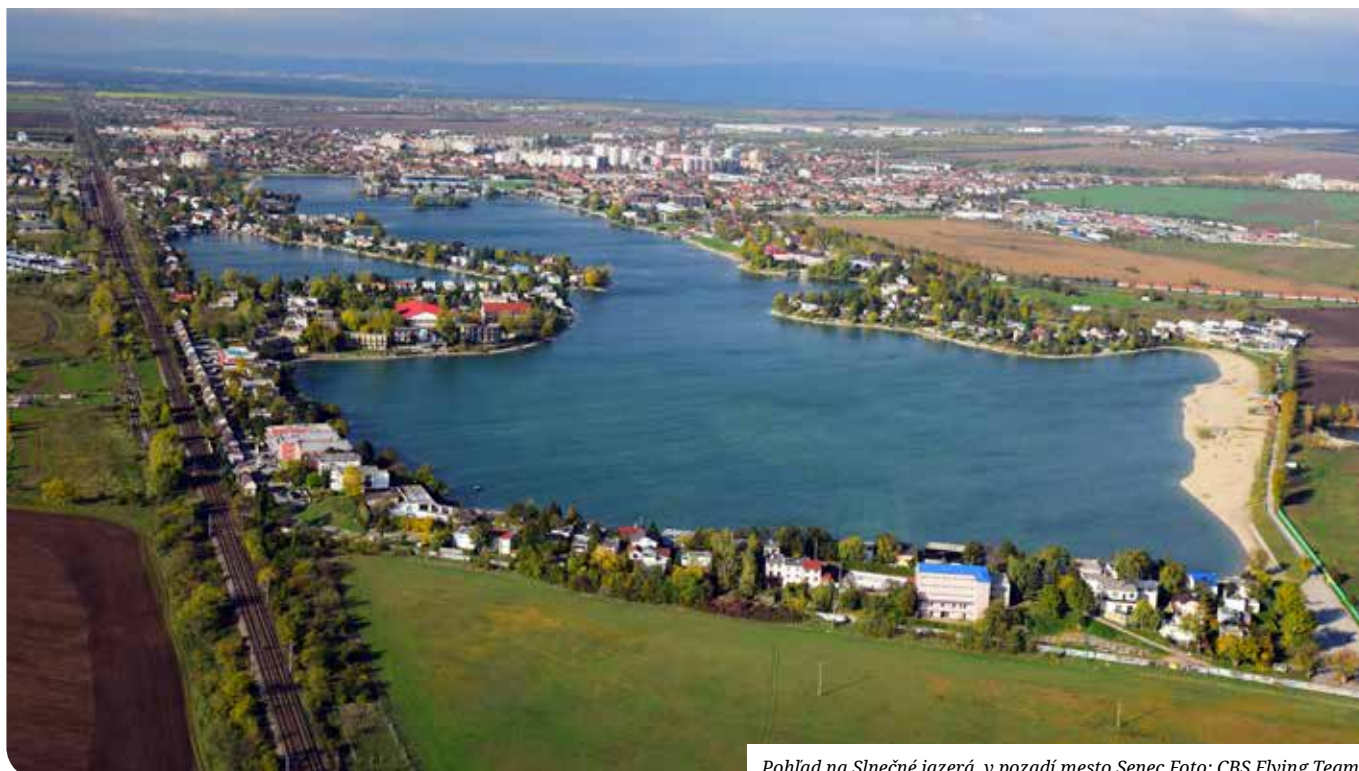
Pohľad na Slnčné jazerá, v pozadí mesto Senec