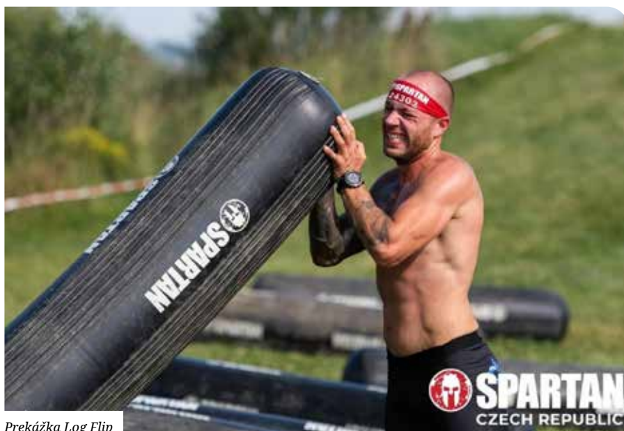
Prekážka Log Flip

V preteku CEU Regionálna séria som skončil na pódiovom 3. mieste a v rámci CEU Horská séria som dosiahol na striebornú priečku v kategórii 25 až 29 rokov. Tieto dve ocenenia považujem