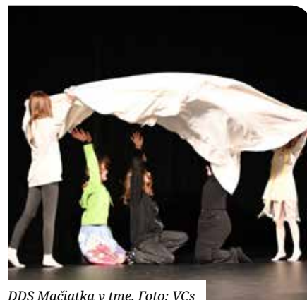
DDS Mačiatka v tme.

Vítazom prehliadky sa stal Detský divadelný súbor Cez dierkovú kľučku zo ZUŠ E. Suchoňa, Pezinok – zároveň postúpil na celoštátnu prehliadku Zlatá priadka Šaľa. VCs