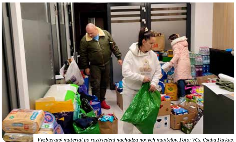
Vyzbieraný materiál po roztriedení nachádza nových majiteľov.