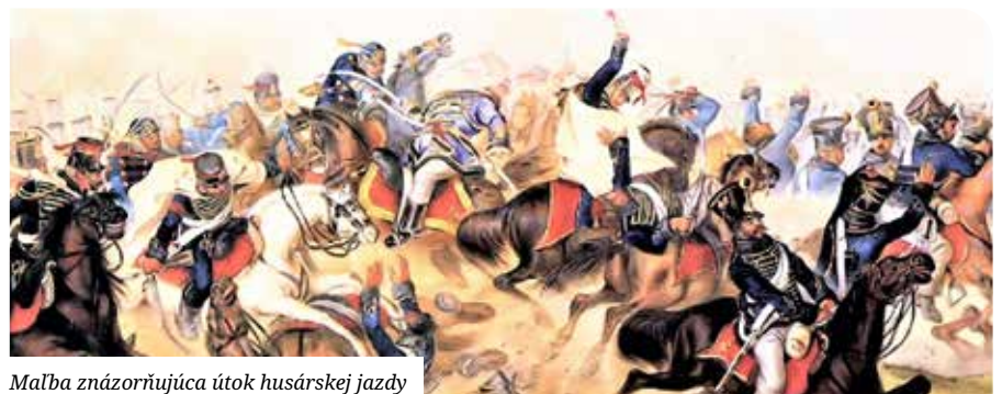
Malba znázorňujúca útok husárskej jazdy

Náhrobné kamene štyroch členov rodiny Kisfaludyovcov z 19. storočia sa však už nenachádzajú na ich pôvodnom mieste v severozápadnej časti katolíckeho