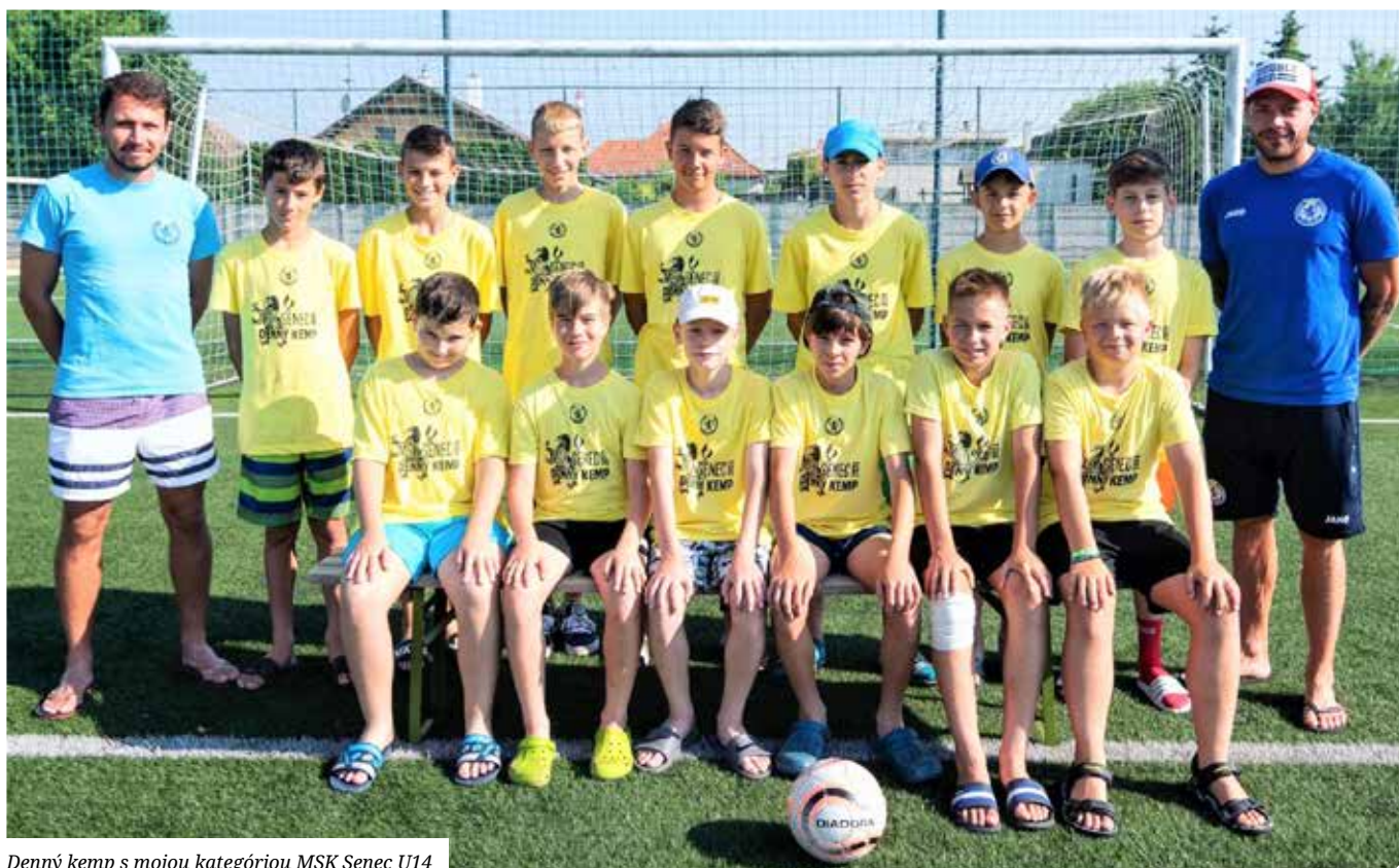
Denný kemp s mojou kategóriou MSK Senec U14