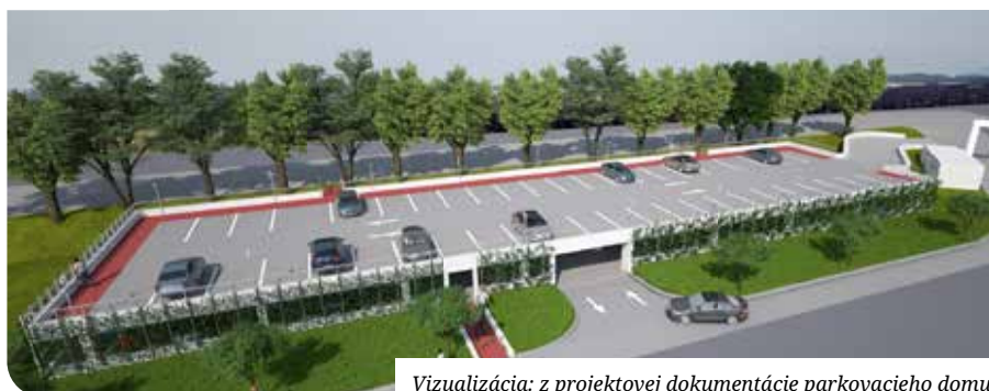
Vizualizácia: z projektovej dokumentácie parkovacieho domu