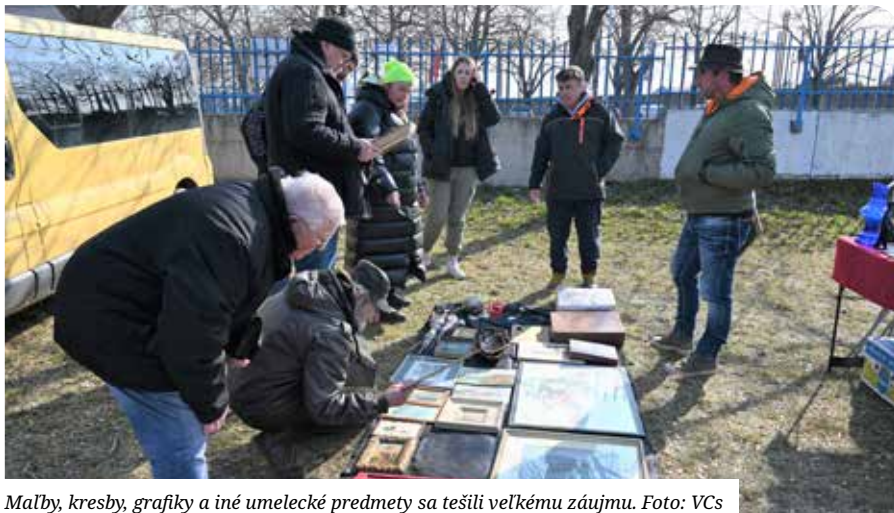
Malby, kresby, grafiky a iné umelecké predmety sa tešili veľkému záujmu.