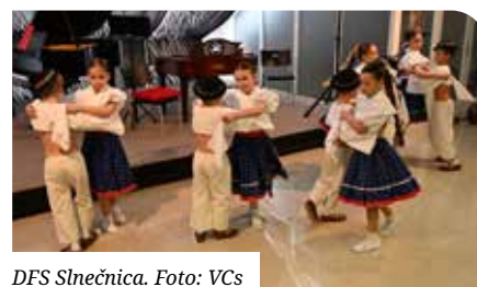
DFS Slniečnica.