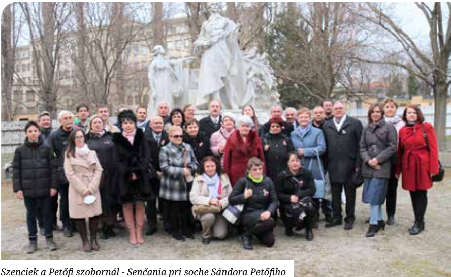
Szenciek a Petőfi szobornál - Senčania pri soche Sándora Petőfiho

174 évvel ezelőtt március 15-én kezdődött el a magyar forradalom és szabadságharc. Az évforduló a korábbi években nem mulhatott el Kisfaludy István néptanító sírjánál megtartott megemlékezés nélkül, aki a szabadságharc idején a szenci nemzetőrök parancsnoka volt.