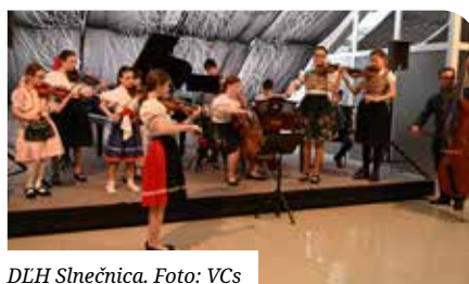
DLH Slniečnica.