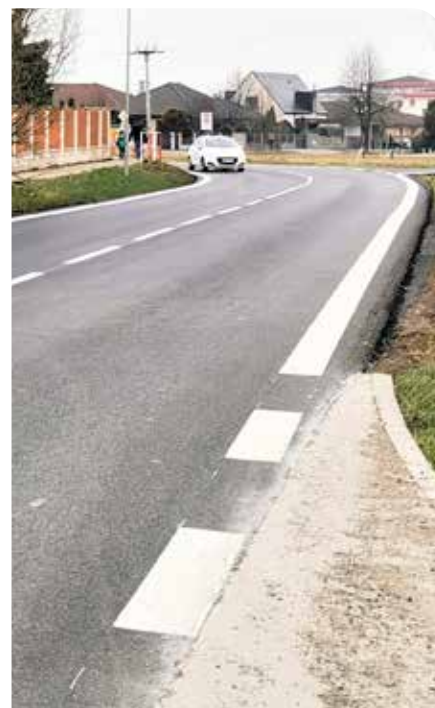
Časť vynoveného úseku Boldockej cesty.

Matej Varga, referent dohľadu nad miestnymi komunikáciami