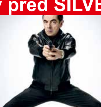
JOHNNY ENGLISH ZNOVA ZASAHUJE