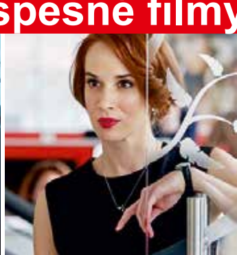
PO ČOM MUŽI TÚŽIA