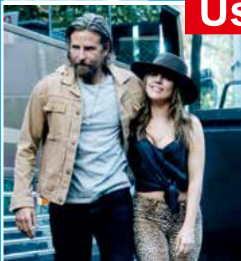
ZRODILA SA HVEZDA