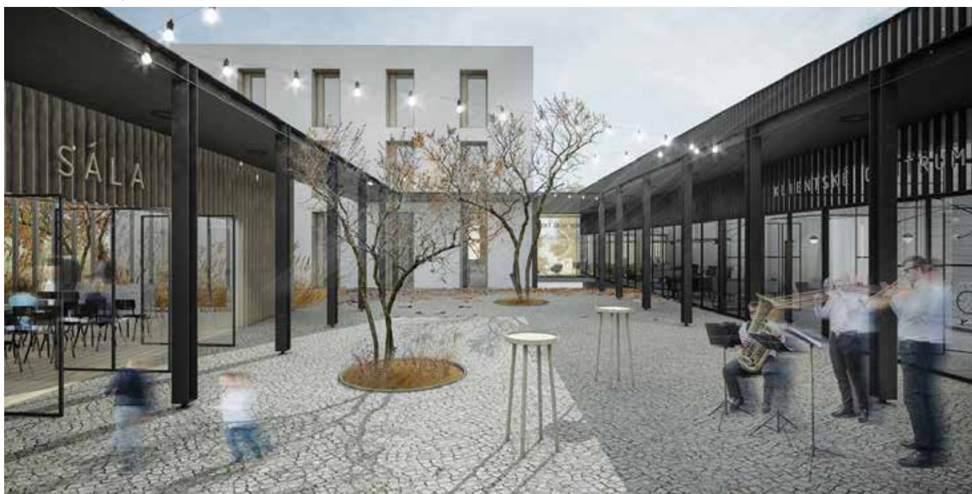
Pohľad zo súčasnej hlavnej budovy do navrhovanej dvorovej časti MsÚ