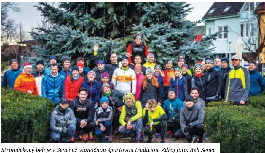
Stromčekový beh je v Senci už vianočnou športovou tradíciou.