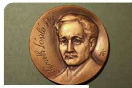
Plaketa - Cena Lászlóa Németha

Za posledných desať rokov zdvojnásobila počet študentov školy aj vďaka tomu, že pracuje s kolegami, ktorým záleží na tom, aby sa škola rozvíjala. Otvorila dva nové študijné odbory: odbor učiteľstvo pre MŠ a vychovávateľstvo a odbor logistiky. Úroveň vyučovania zvyšovala aj vybudovaním viacerých odborných učební. Vždy je pripravená začať