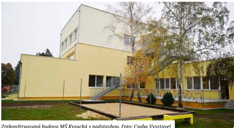
Zrekonštruovaná budova MŠ Kysucká s nadstavbou.