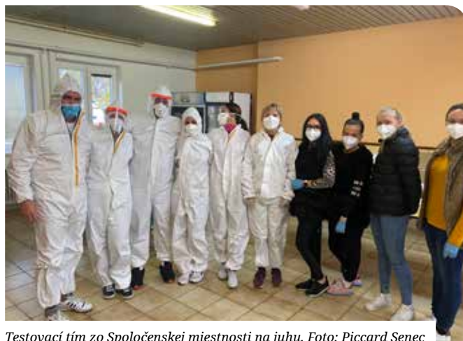
Testovací tím zo Spoločenskej miestnosti na juhu.