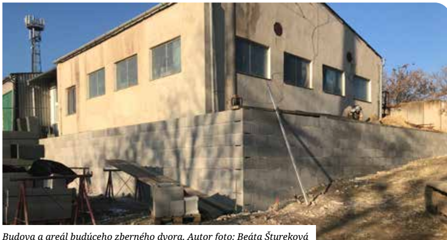
Budova a areál budúceho zberného dvora.

Nový zberný dvor je na opačnej strane mesta, čím sa zabezpečí lepšia dostupnosť pre obyvateľov celého územia mesta. Areál sa nachádza na parcele vo vlastníctve mesta č. KNC 5370/28 v k. ú. Senec, na Pezinskej ulici. Bude ohradený plotom z betónových panelov so vstupnou ocelovou posuvnou