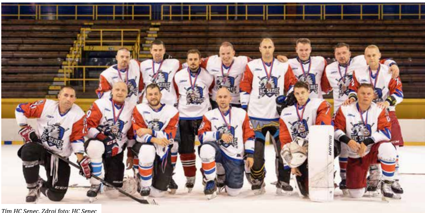
Tím HC Senec.