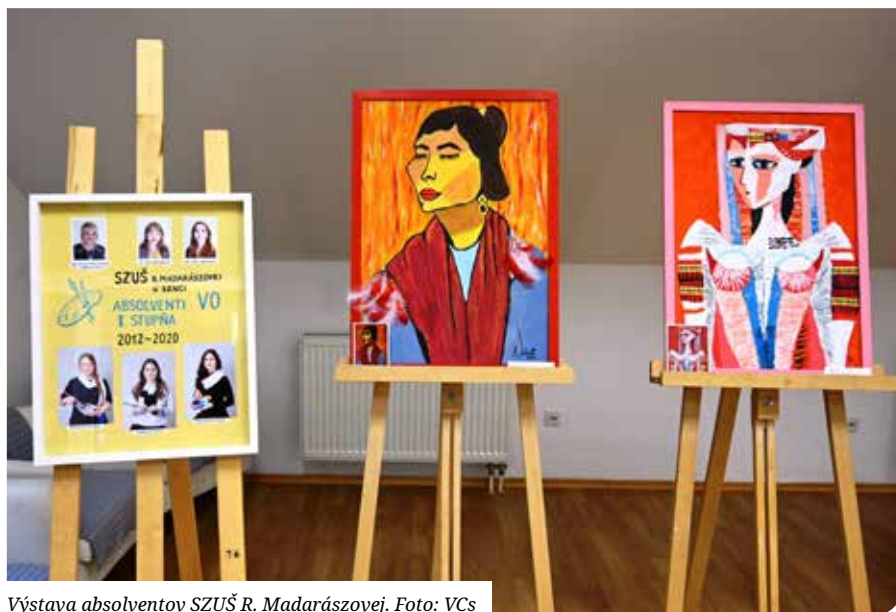
Výstava absolventov SZUŠ R. Madarászovej.