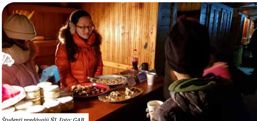
Študenti predávajú NI.