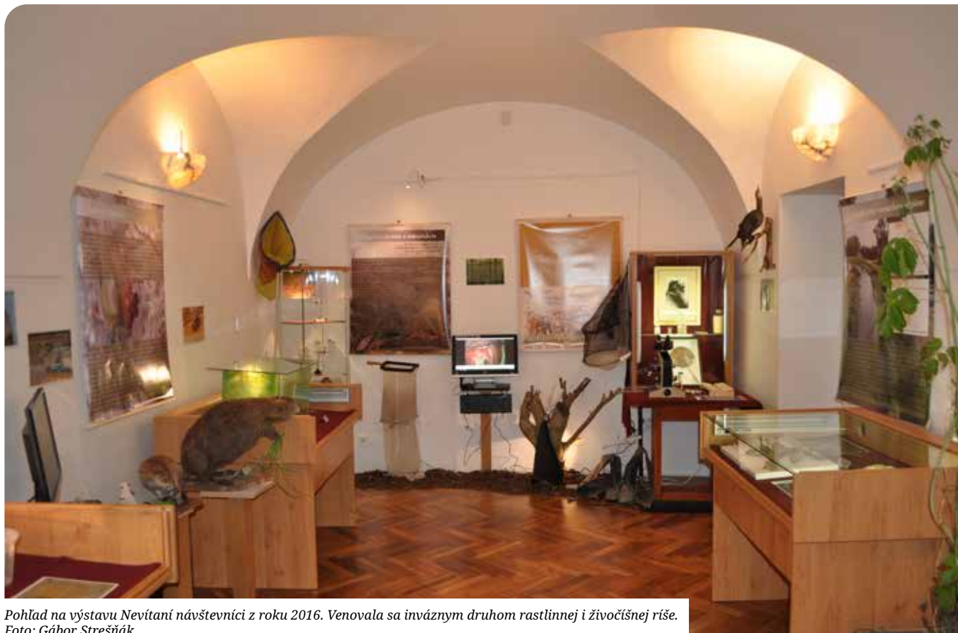
Pohľad na výstavu Nevítaní návštevníci z roku 2016. Venovala sa inváziym druhom rastlinnej i živočíšnej ríše.

Každé mesto má svoje klenoty, na ktoré môže byť priamo pyšné. Sú to rôzne pamiatky, sochy, budovy, prírodné zaujímavosti a podobne. Medzi takéto klenoty nepochybne patria aj mestské múzeá, ktoré sú samo o sebe veľmi jedinečné. Zväčša sa nachádzajú v historických budovách, prezentujú vzácne a zaujímavé predmety, pomáhajú posilniť lokálne povedomie, pomocou výstav a vedeckých publikácií pomáhajú obyvateľom danej obce objaviť históriu ich bydliska a jeho okolia. Mesto Senec preto môže byť právom hrdé, že sa v jeho centre nachádza múzeum. Nie každé mesto alebo obec si môže dovoliť vybudovať takúto inštitúciu. Výzvu neprináša len zabezpečenie dostatku finančných prostriedkov na zaistenie fungovania múzea, ale aj zostavenie správneho tímu ľudí, ktorí sú schopní viesť takúto pamäťovú inštitúciu a sú schopní ju aj rozvíjať.