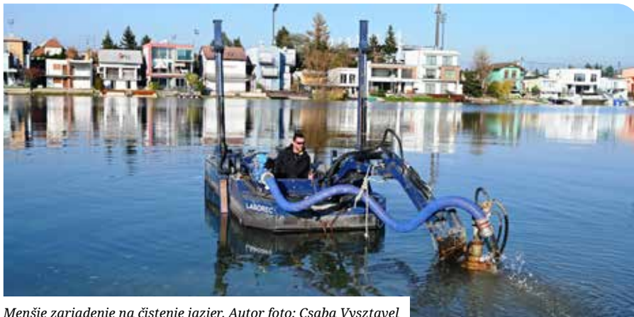
Menšie zariadenie na čistenie jazier.

Pokus trval 7 hodín a 15 minút so zariadením, ktoré pozostáva z plávajúceho sacieho bagra určeného na odsávanie jemných sedimentov, spojovacieho potrubia a geovaku umiestneného na brehu. Na palube plávajúceho sacieho bagra je čerpadlo s výkonom 80 m 3 /hod, ktoré dokáže odsávať sedimenty do hĺbky 2,1m. Čerpadlo vytlačí odsatú zmes do geovaku, kde