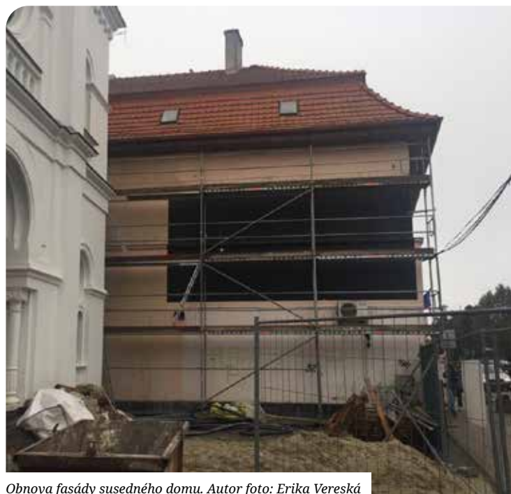
Obnova fasády susedného domu.