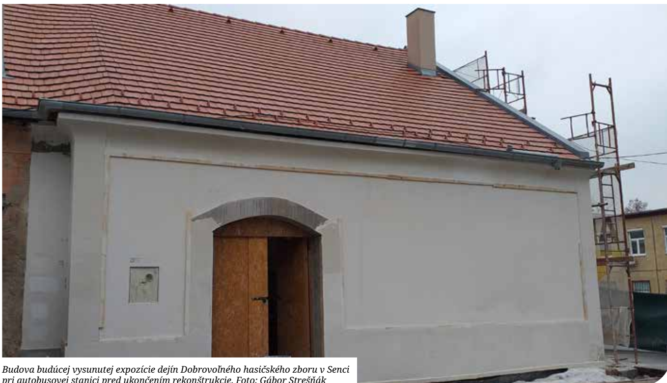
Budova budúcej vysunutej expozície dejín Dobrovoľného hasičského zboru v Senci pri autobusovej stanici pred ukončením rekonštrukcie.