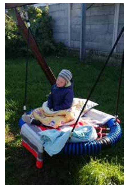
Hojdacie hniezdo.