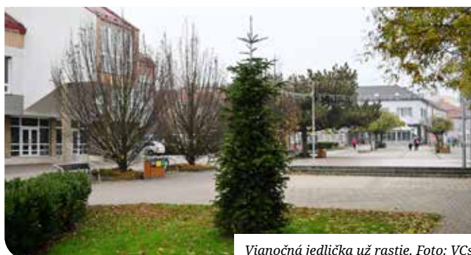
Vianočná jedlička už rastie.