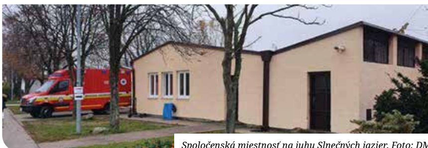
Spoločenská miestnosť na juhu Slnčných jazier.

dňoch od pondelka do piatka. Realizuje ho zdravotnícky personál z Ružovej záhrady n.o. pod vedením poslankyne MsZ Zuzany Gabrišovej Košecovej.