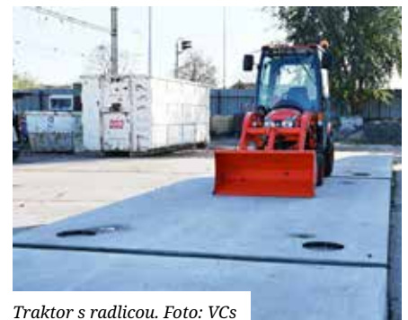
Traktor s radlicou.