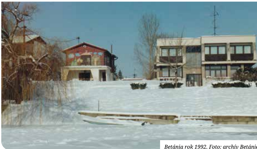
Betánia rok 1992.

V penzióne v 6 útulných izbách vyzdobených výrobkami z našich dielní vieme ubytovať 14 osôb. K dispozícii je aj malá kuchynka s chladničkami a so