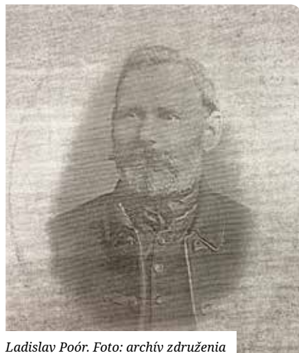
Ladislav Poór.