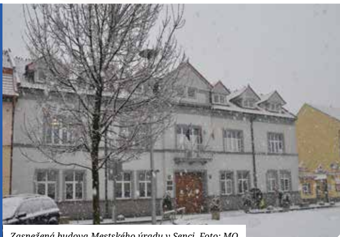
Zasnežená budova Mestského úradu v Senci.

Materiály na zasadnutie sa zverejňujú na www.senec.sk a zasadnutie sa bude online vysielat na www.zastupitelstvo.sk