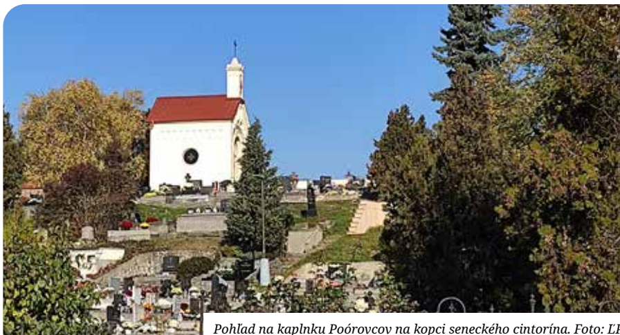
Pohľad na kaplnku Poórovcov na kopci seneckého cintorína.