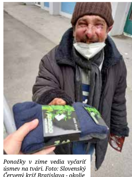
Ponožky v zime vedú vyčariť úsmev na tvári.