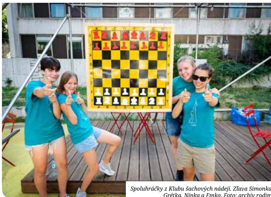
Spoluhráčky z Klubu šachových nádejí. Zľava Simonka, Grétko, Ninka a Emka.