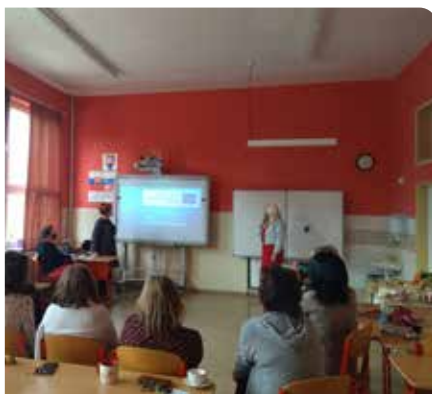
Pedagógovia GAB Senec aplikujú nové poznatky do vyučovacieho procesu.

Mgr. Lucia Nemečková a Mgr. Alžbeta Durayová absolvovali v Düsseldorfe štruktúrovaný kurz zameraný na využívanie tabletov a aplikácií. Predviedli kolegom inovatívne spôsoby vyučovania pomocou aplikácií ako sú platformy Kahoot, Plickers, či Learningapps.