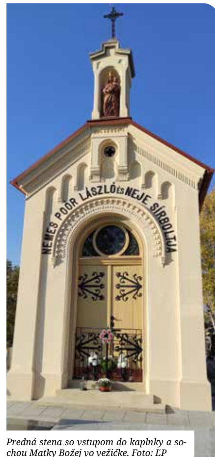
Predná stena so vstupom do kaplnky a sochou Matky Božej vo vežičke.