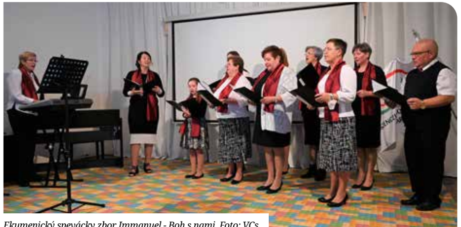
Ekumenický spevácky zbor Immanuel - Boh s nami.