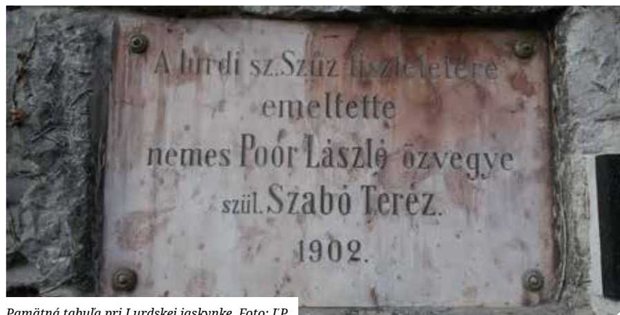
Pamätaná tabula pri Lurdskej jaskynke.