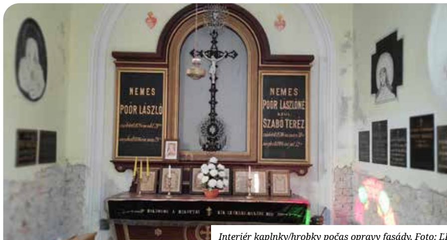
Interiér kaplnky/hrobky počas opravy fasády.