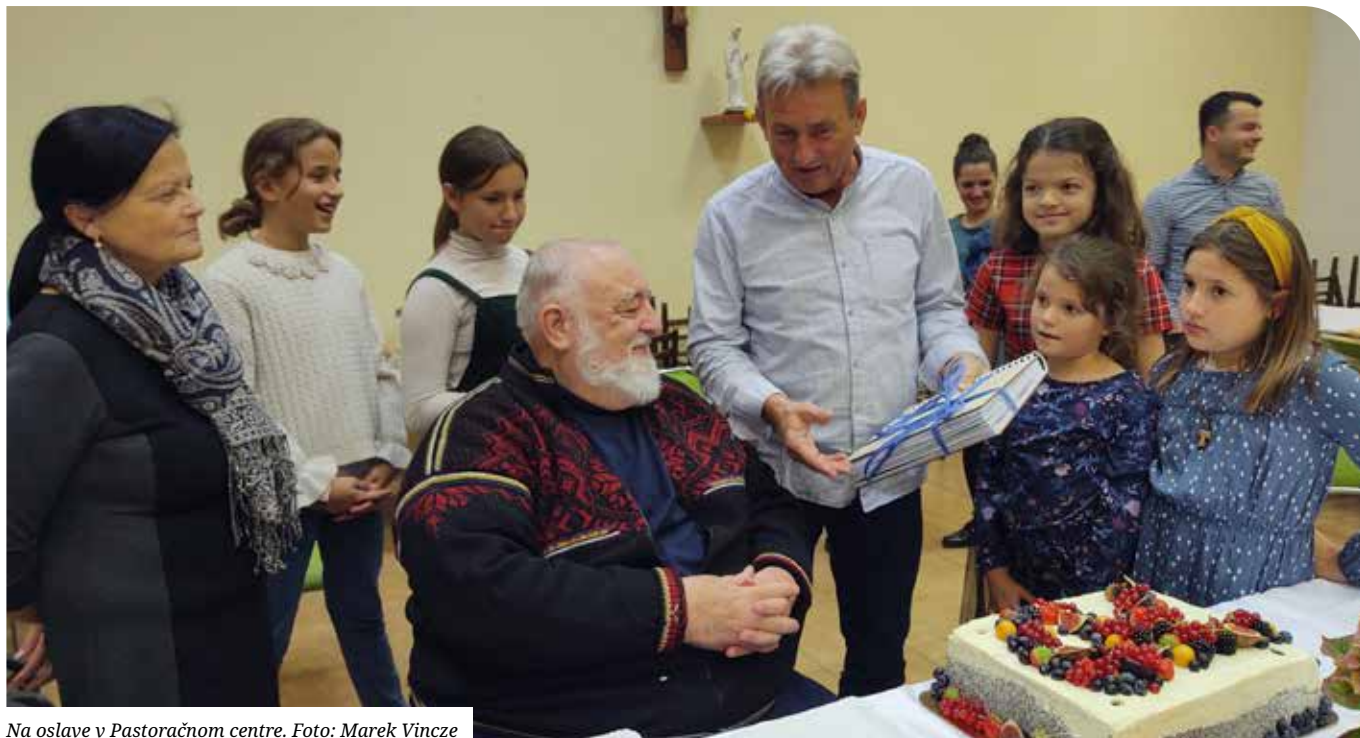
Na oslave v Pastoračnom centre.