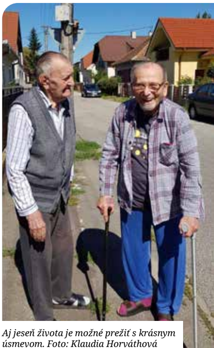
Aj jeseň života je možné prežiť s krásnym úsmevom.