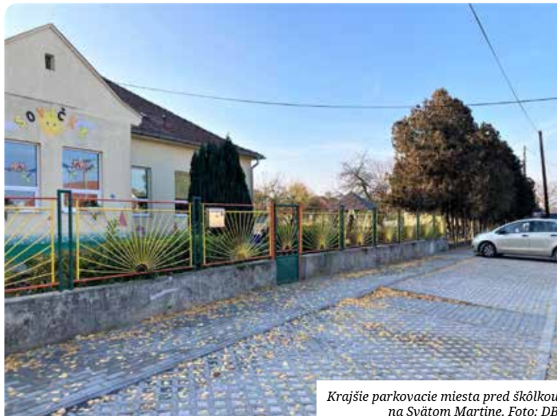
Krajšie parkovacie miesta pred škôlkou na Svätom Martine.

Prosíme záujemcov o vyhradené parkovacie miesta, aby si nové žiadosti podávali na MsÚ až od marca 2022.