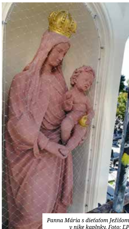
Panna Mária s dieťaťom Ježišom v nike kaplnky.