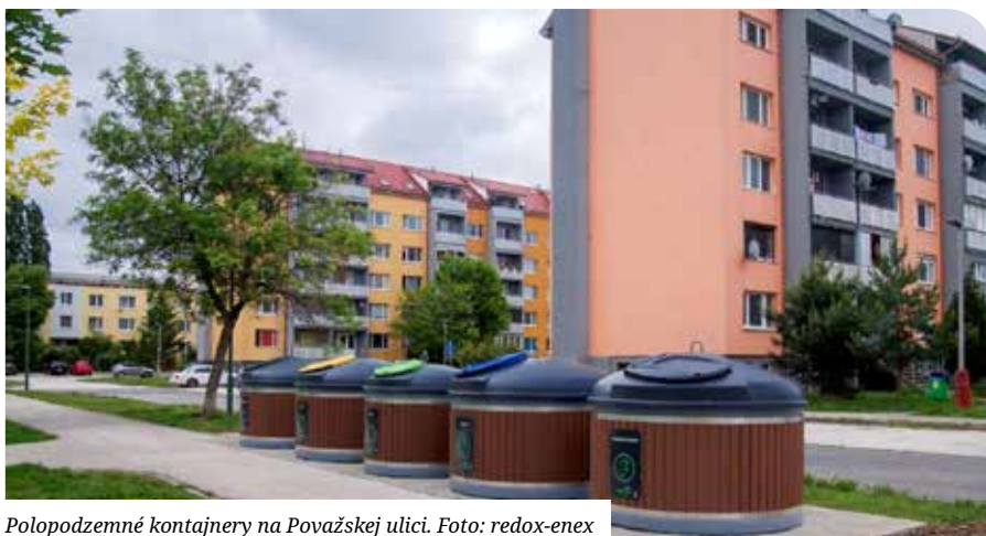
Polopodzemné kontajnery na Považskej ulici.