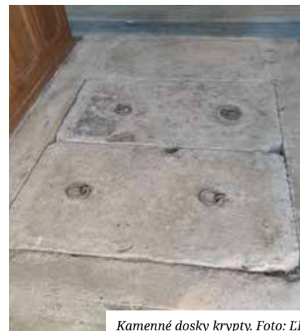
Kamenné dosky krypty.