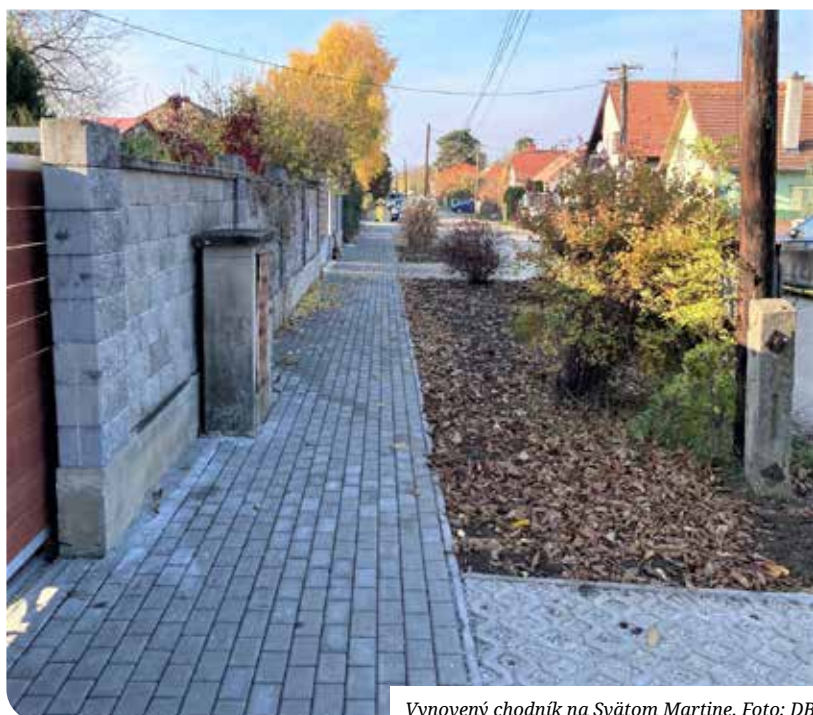
Vynovený chodník na Svätom Martine.