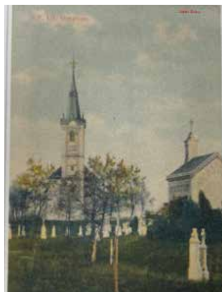
Pohľad na kostol od cintorína. Vpravo kaplnka Poórovcov.