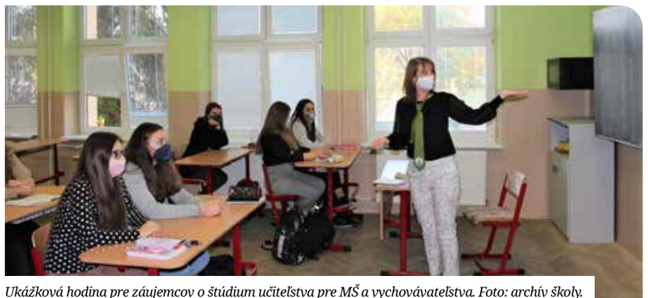
Ukázková hodina pre záujemcov o štúdium učiteľstva pre MŠ a vychovávateľstva.