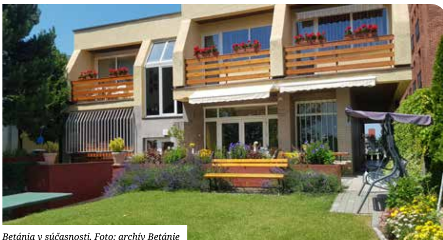
Betánia v súčasnosti.

Vďaka dlhoročnej spolupráci s Tenenetom sme sa zapojili do projektu na získanie samostatného bývania. Boli sme veľmi radi, keď sme zistili, že práve naša klientka splnila všetky podmienky a splní sa jej obrovská túžba – bude môcť opustiť Betániu a presťahuje sa do pekného jednoizbového bytu. Ten sa nám podarilo zariadiť vďaka ochote oslovených jednotlivcov. Je to zatiaľ naša prvá lastovička v procese osamostatňovania klientov, ale určite nie posledná. Budeme naďalej aj sami vyhľadávať možnosti ako získať samostatné bývanie pre našich klientov mimo Betánie.