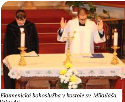
Ekumenická bohoslužba v kostole sv. Mikuláša.