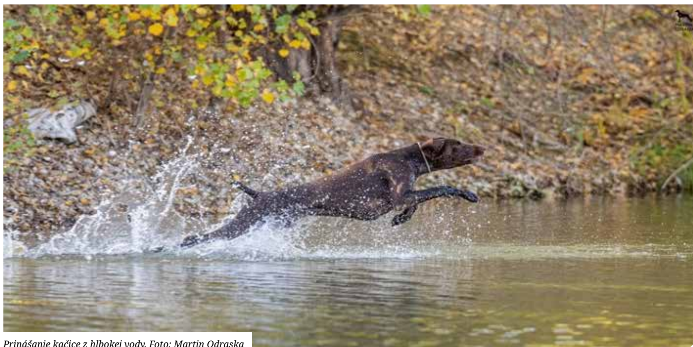
Prinášanie kačice z hlbkej vody.