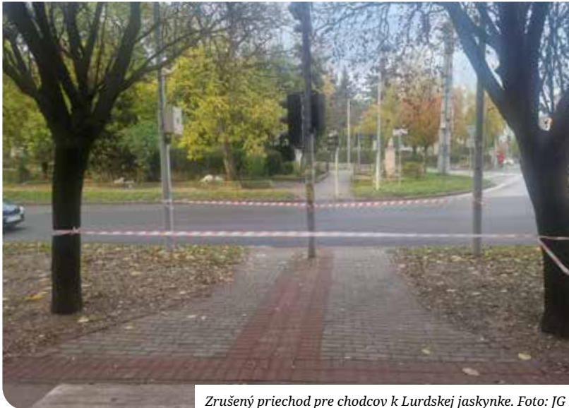
Zrušený priechod pre chodcov k Lurdskej jaskynke.