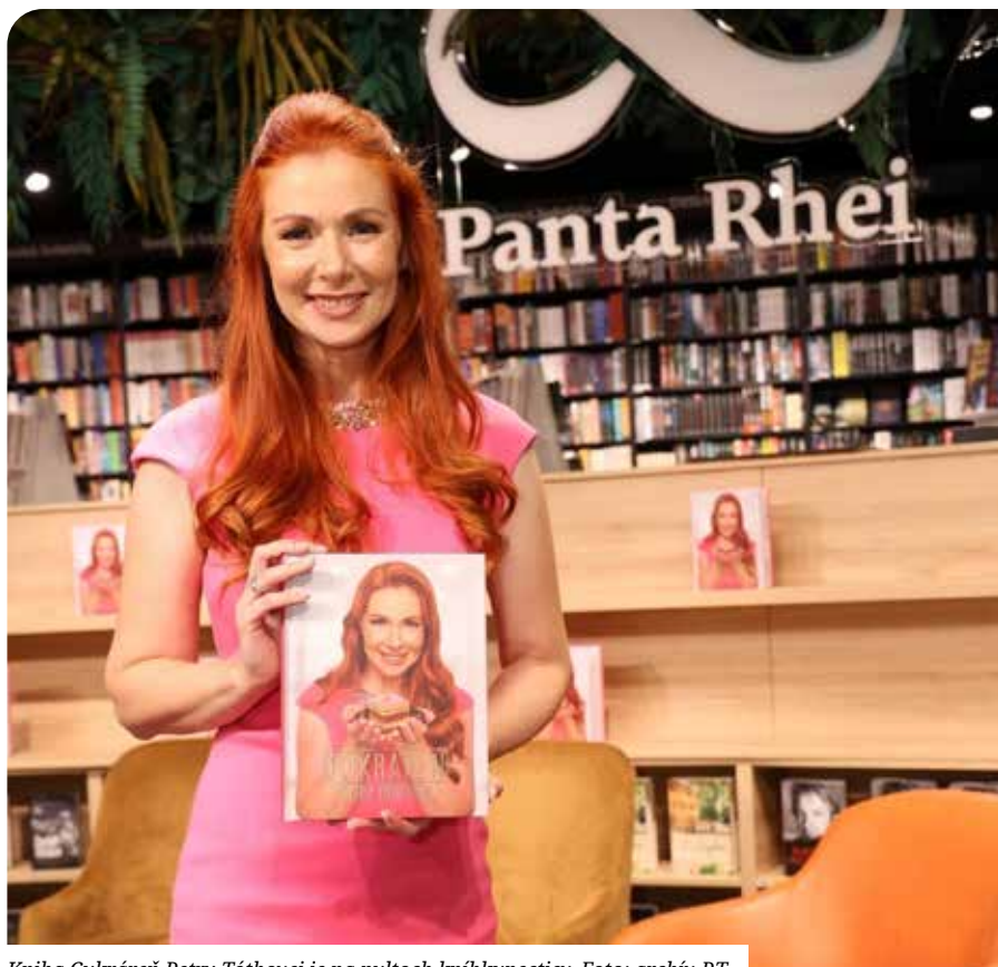
Kniha Cukráreň Petry Tóthovej je na pultoch kníhkupectiev.