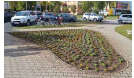
Vysadené sirôtky pri novej cyklotrase.