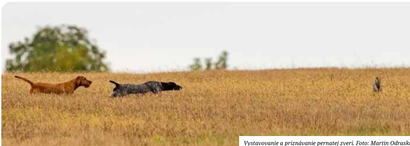
Vystavovanie a priznávanie pernatej zveri.