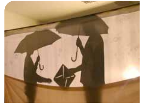
Tieňové divadlo v ZŠ A. M. Szencziho.