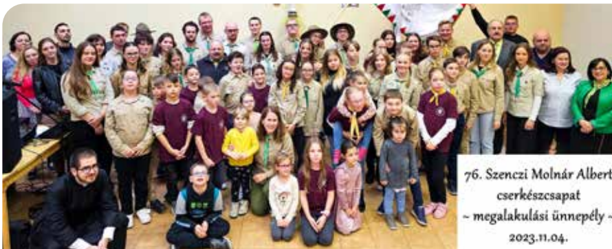
Úrtašnici slávnostného založenia 76. skautského zboru A. M. Szencziho.

A szenci cserkészszak az újjáalakult Szlovákiai Magyar Cserkészszövetségen belül 2013-ban kezdte meg újra működését a félt 24. számú szent László cserkészcsapat rajaként, Herics Hideghéty Mónika vezetésével.