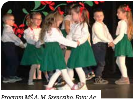
Program MŠ A. M. Szencziho.

A Szenci Molnár Albert Óvoda a kultúrház mozitermében ünnepelte megalakulásának