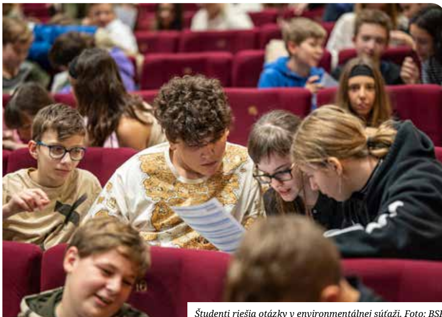
Študenti riešia otázky v environmentálnej súťaži.