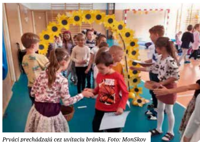
Prváci prechádzajú cez uvítaciu bránku.