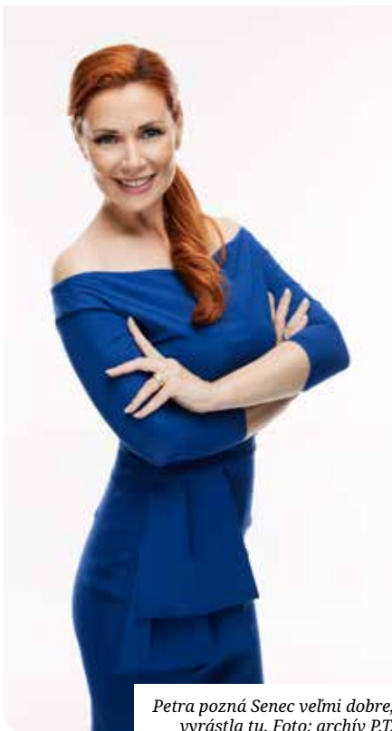
Petra pozná Senec veľmi dobre, vyrástla tu.

Páči sa mi, že mesto Senec sa stará o svojich občanov. Máme tu pešiu zónu, máme jazerá. Každý má svoje starosti, aj iné mestá a dediny ich majú, ale snažím sa vždy pozeráť na to dobré, čo sa spravilo. Páči sa mi, že sa tu robia cyklotrasy, že sa opravuje na jazerách. Jazerá sú náš hlavný ťahák. A vidím aj to, že Senec sa snaží kultúrne žiť, konajú sa akcie, ktoré sme tu predtým nemali. Páčia sa mi Farmárske trhy, ktoré sa konajú pravidelne, máme Senecké leto, karneval, Remeselné trhy, Jablkové hodovanie.