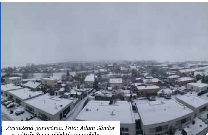
Zasnežená panoráma.

Materiály na zasadnutie sa zverejňujú na www.senec.sk a zasadnutie sa bude online vysielat' na www.zastupitelstvo.sk