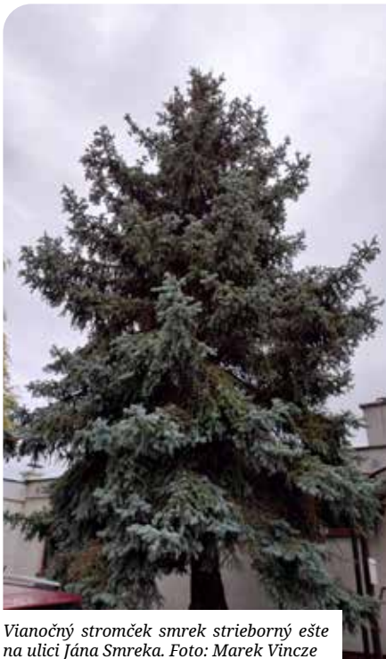
Vianočný stromček smrek strieborný ešte na ulici Jána Smreka.