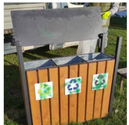
Karháme sprejera, ktorý sa realizoval na smetných košoch na triedenie odpadu. A nielen na tomto jednom.