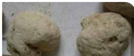
Vápnité konkrécie – cicváre, častý v sprašových horninách (N. Hlavatá Hudáčková)

Spomínaná spraš je nespevnená usadená hornina žltej farby, tvorená nadpolovičným obsahom častíc prachovej veľkosti. Glaciálne spraše sa tvorili počas pleistocénnych ľadových dôb, keď vplyvom suchého a studeného podnebia prebiehalo intenzívne mrazové zvetrávanie hornín. Pevné horniny sa účinkom mrazu rozpadli až na prach. Vodami z topiacich sa ľadovcov boli prachové zvetraliny premiestňované do dolín riek, z ktorých bol jemný prach vyvíjaný vetrom a následne sa usádzal na miestach, kde vietor strácal svoju unášaciu schopnosť. V spraši, napr. v priestoroch bývalej seneckej tehelne, nájdeme vápnité konkrécie (cicváre), podobné skamenelinám, ktoré však vznikajú chemicky. Objaviť možno aj zväpnené vajíčka fosílnych ulitníkov, ale časté sú i zachované stopy po činnosti rozmanitých dávnych druhov chrobákov, blanokřídelého hmyzu, drobných cicavcov a rastlín.