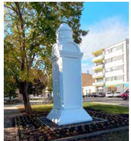
K stĺpu hanby útvary verejnej zelene, údržby a čistenia mesta vysadil 700 ks cibuľovín (zmes narcis, tulipán, modrica) a približne 200 kusov sirôtok. Na jar po ich odkvitnutí tam vysadí letničky.