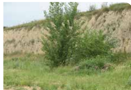
Odkryv spraše v Senci