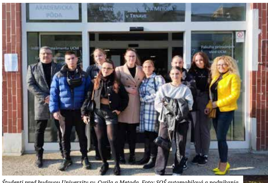
Študenti pred budovou Univerzity sv. Cyrila a Metoda.