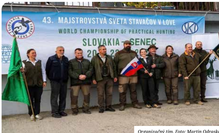
Organizačný tím.

s Majstrovstvami sveta spočíva v tom, že vodič predstavuje rolu strelca, ktorý ide na lov so psom. Ak pes spoľahlivo zver nájde, vystaví a strelec má možnosť zver bezpečne uloviť, zver sa snaží trafiť a pes ju má dohľadať a priniesť.