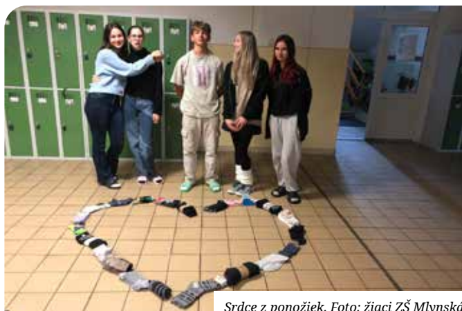
Srdce z ponožiek.