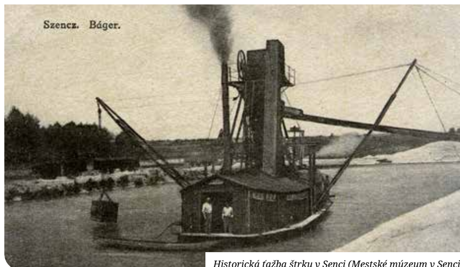
Historická ťažba štrku v Senci

Upravené z diela Fedora a kol. (2015) Senec: od návršia k horizontom. Regionálna výchova