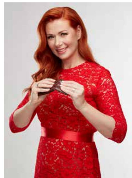
Petra pri pečení nemá rada náhrady ani skratky.