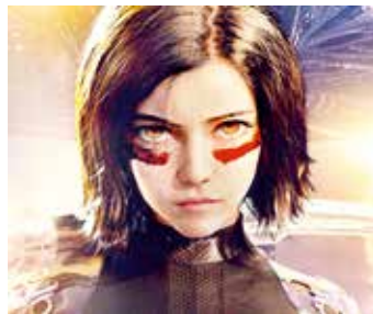
ALITA: BOJOVÝ ANJEL