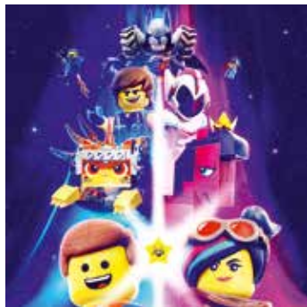
LEGO PRÍBEH 2 8.2. piatok o 18:00 5,00 Eur 10.2. nedeľa o 16:00 5,00 Eur