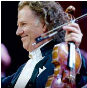
ANDRÉ RIEU ( záznam ) Koncert zo Sydney 2019 9.2. sobota o 18:00 8,00 Eur