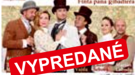
LEN SI POSPI MILÁČIK 15.2. piatok o 19:00

LEN SI POSPI MILÁČIK Finta pána gibadiera