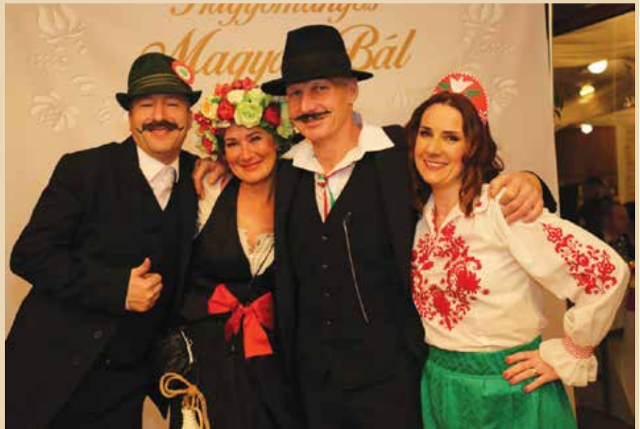
Účastníci plesu ZŠ A. M. Szenciho