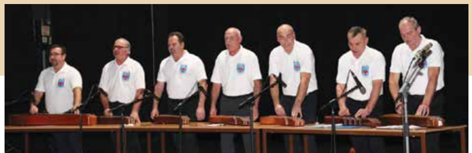
Hore citarový súbor zo Sládkovičova, pod tým súbor z Neníc