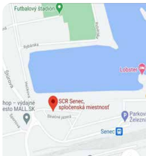
Mapka, na ktorej je vyznačená Spoločenská miestnosť na juhu Slnčnej jazier.

Antigénovým testom na COVID 19 sa testuje v Spoločenskej miestnosti na juhu Slnčnej jazier v čase od 7:30 do 15:30. Testovanie je dobrovoľné a koná sa v pracovných dňoch od pondelka do piatka. Realizuje ho zdravotnícky personál z Ružovej záhrady n.o.