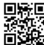
QR kód na stiahnutie minúty z vyučovacej hodiny.