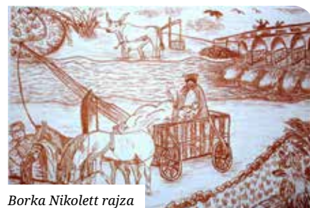
Borka Nikolett rajza

A Csemadok Országos Tanácsa megbízásából a Csemadok Rimaszombati Területi Választmánya hirdette meg a XIX. Ferenczy István Országos Képzőművészeti versenyt. A versenyre három témában várták az alkotásokat: Blaha Lujza portré - a művész nő születésének 170. évfordulója tiszteletére, Hungarikumok, Illusztráció Fekete István műveihez - az író születésének 120. évfordulója tiszteletére.