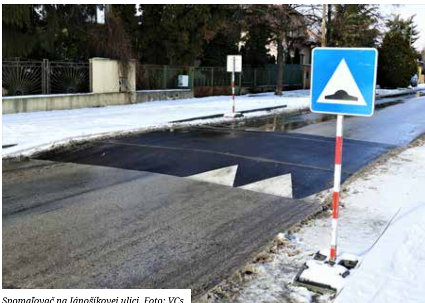
Spomaľovač na Jánošíkovej ulici.