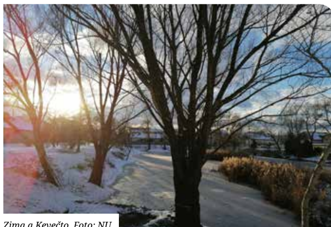
Zima a Kevečto.

Riadková inzercia: sencan@sencan.sk Uzávierka novín 20.02.2020