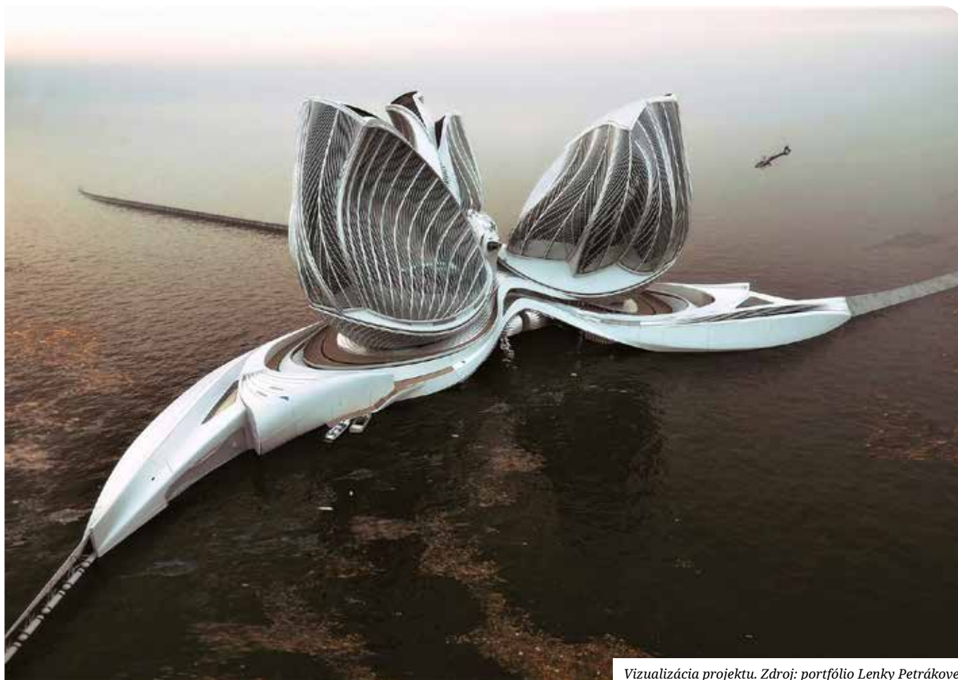
Vizualizácia projektu.