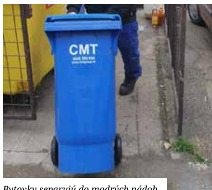
Bytovky separujú do modrých nádob.

Triedené zložky ako plasty/kovy/tetrapaky a papier je potrebné vykladať v prísvitných vreciach, ktoré získate bezplatne na referáte odpadového hospodárstva na celý rok. Zvozová spoločnosť odpad v iných vreciach nezbera z dôvodu, že sa v týchto vreciach (modré, čierne