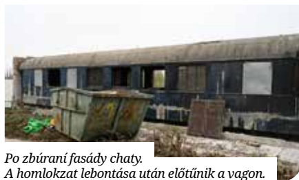
Po zbúraní fasády chaty. A homlokzat lebontása után előtűnik a vagon.