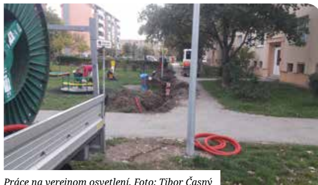
Práce na verejnom osvetlení.