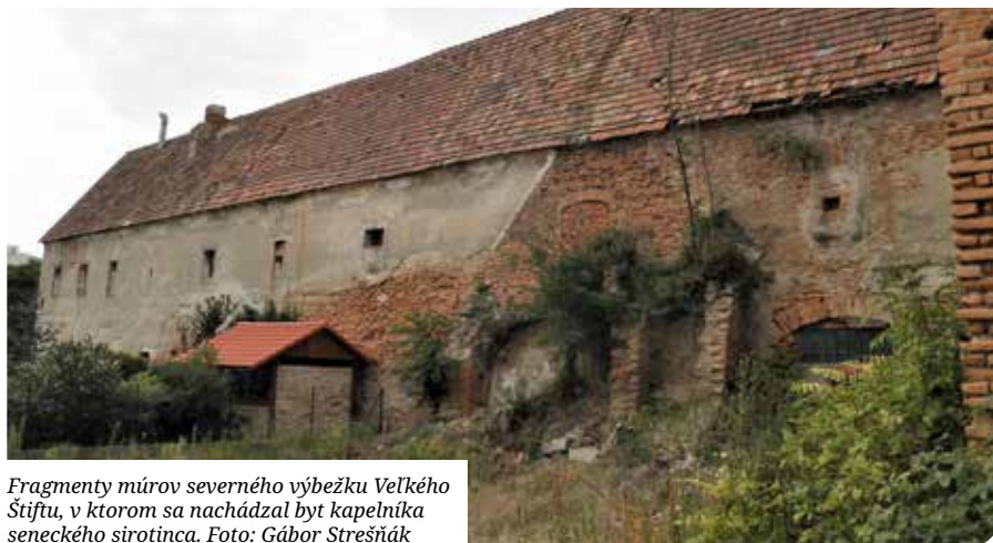
Fragmenty múrov severného výbežku Veľkého štíftu, v ktorom sa nachádzal byt kapelníka seneckého sirotinca.

Kontakty s Haydnom dopomohli Hummelovi, aby sa stal kapelníkom na esterházyovskom kniežacom dvore v Eisenstadte, kde pôsobil v rokoch 1804 až 1811.