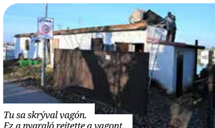
Tu sa skryval vagon. Ez a nyaraló rejtette a vagon.