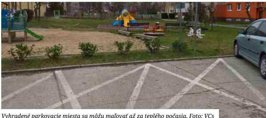
Vyhradené parkovacie miesta sa môžu malovať až za teplého počasia.