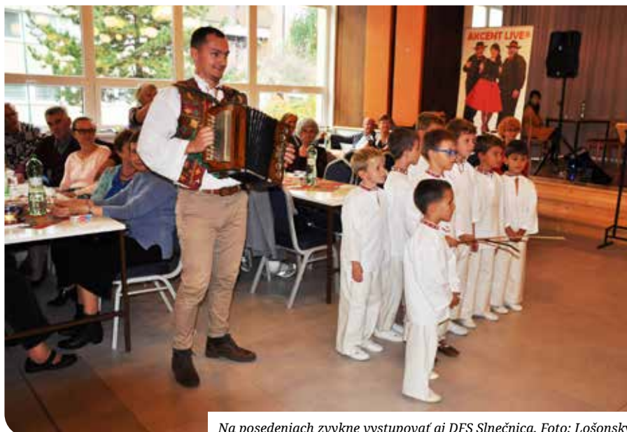
Na posedeniach zvykne vystupovať aj DFS Slnečnica.