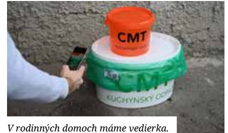
V rodinných domoch máme vedierka.

Do odpadu z kuchyne môžete dávať odpady v ich prvotnom obale. To znamená, že keď máte jogurt/smotanu po záruke, tak ju dáte do vedierka aj s prvotným obalom a to je práve téglik. Pokiaľ jogurt zjete, tak prázdny obal patrí do plastov. Odpad z kuchyne následne putuje do bioplynovej stanice a tá si s ním už poradí. Rozdiel by bol v tom, ak by odpad putoval do kompostárne – tam už odpad nesmie byť v obale.