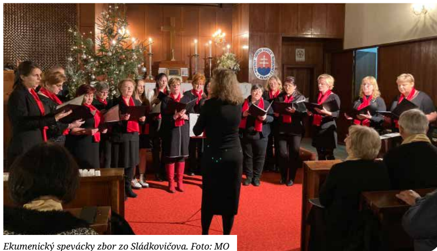
Ekumenický spevácky zbor zo Sládkovičova.