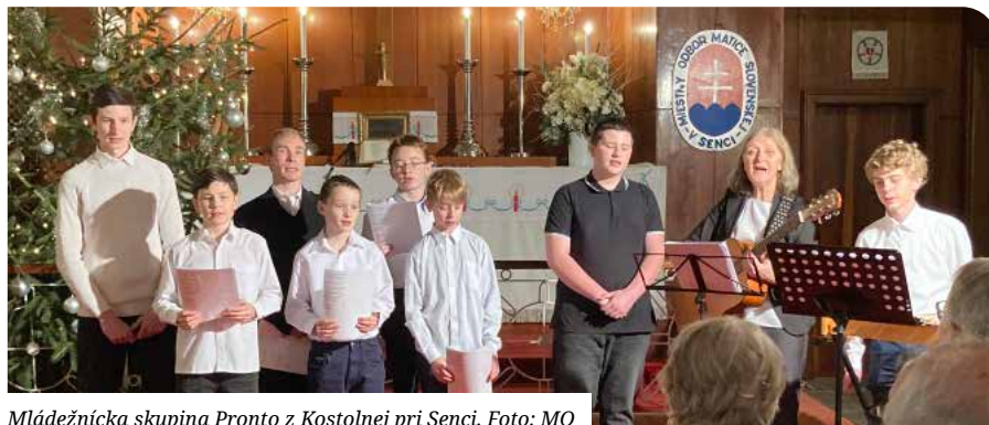
Mládežnícka skupina Pronto z Kostolnej pri Senci.