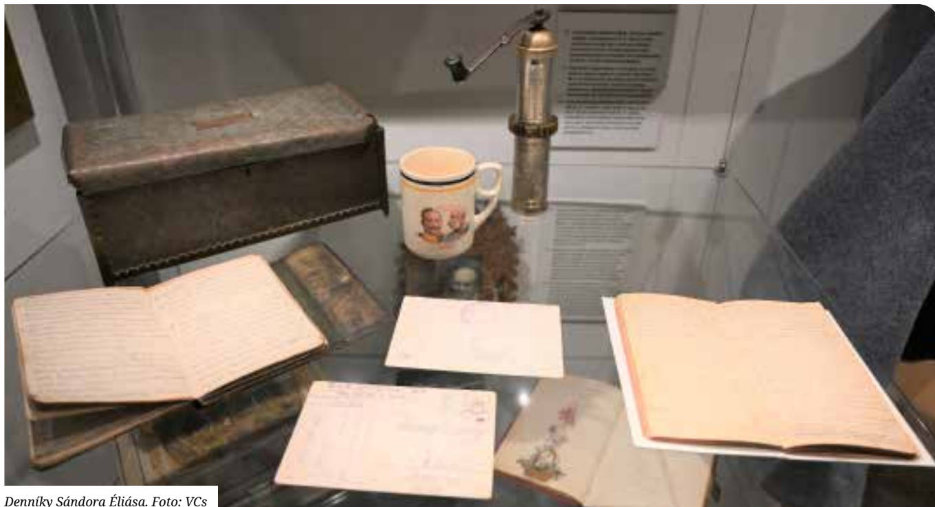
Denníky Sándora Éliása.

zrkadiel, generátorov — v Éliásovej terminológii: „aparátov“). Krstom ohňom prešiel začiatkom augusta 1914 na srbskom fronte. Miesta pobytu na fronte neskôr zhrnul takto: