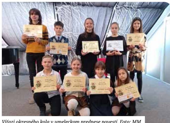
Víťazi okresného kola v umeleckom prednese povestí.