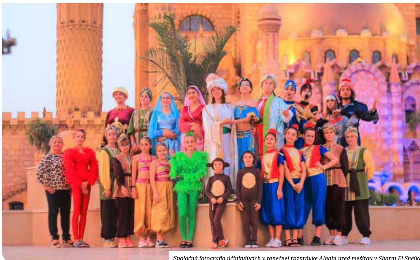
Spoločná fotografia účinkujúcich v tanečnej rozprávke Aladin pred mešitou v Sharm El Sheikh