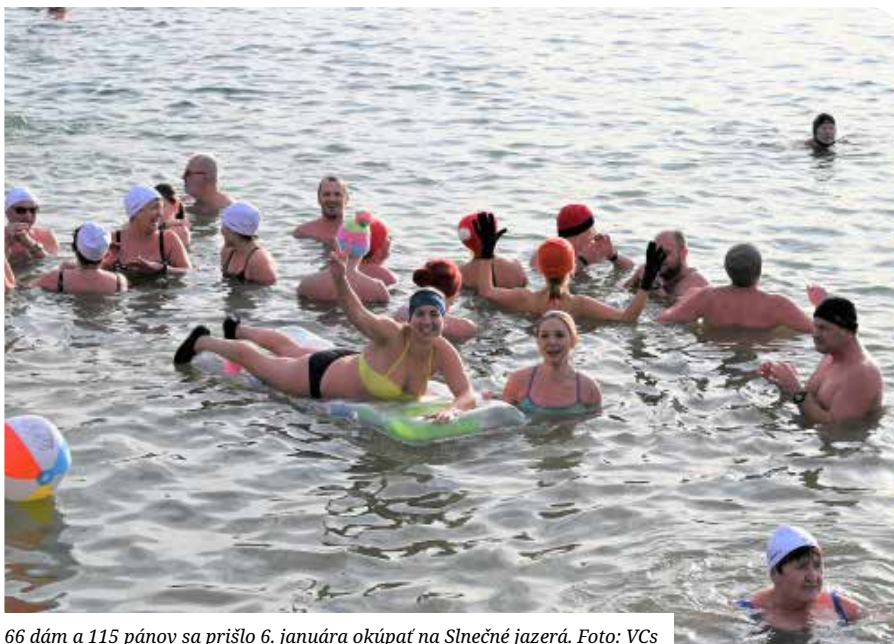
66 dám a 115 pánov sa prišlo 6. januára okúpať na Slnecné jazero.

Trojkráľové kúpanie sa na Slnecných jazeroch konalo po dvojročnej pandemickej prestávke. Masové podujatia boli síce zakázané, ale individuálnemu otužovaniu sa venovalo výrazne viac ľudí pre jeho blahodárne účinky na imunitný systém.