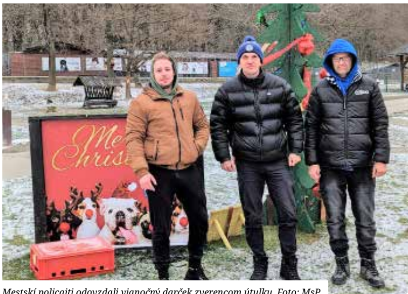
Mestskí policajti odovzdali vianočný darček zverencom útulku.