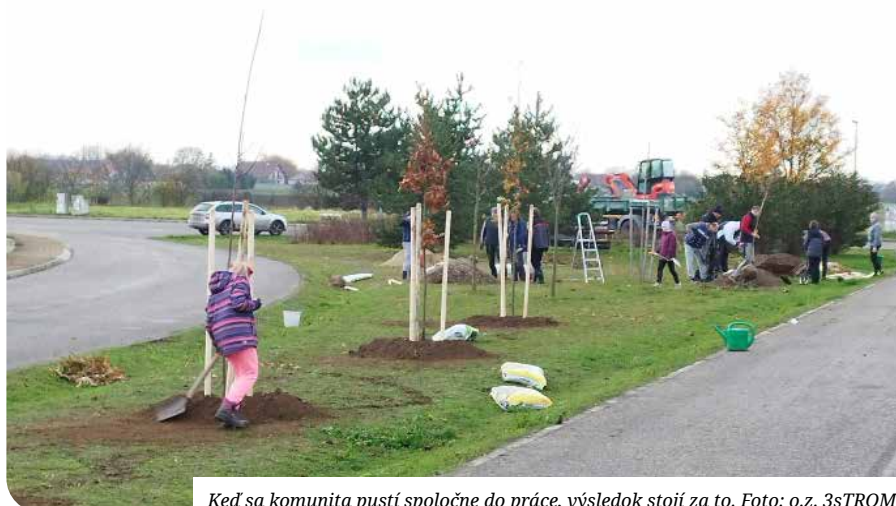
Keď sa komunita pustí spoločne do práce, výsledok stojí za to.