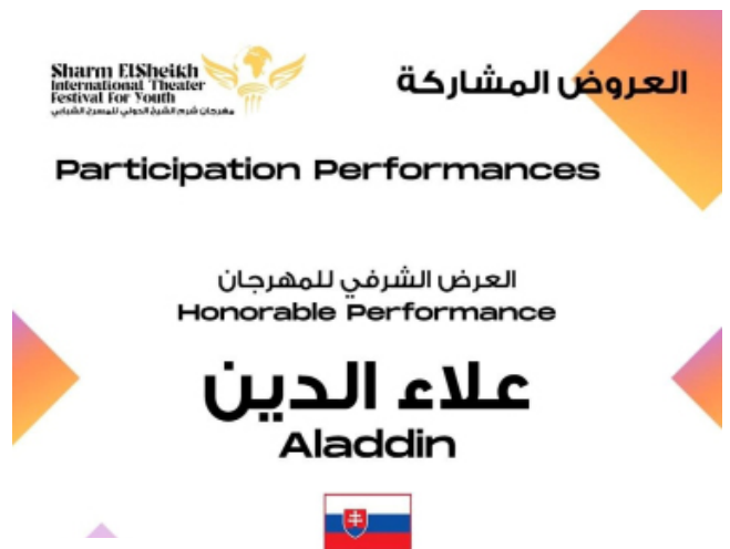
Karta účastníka festivalu