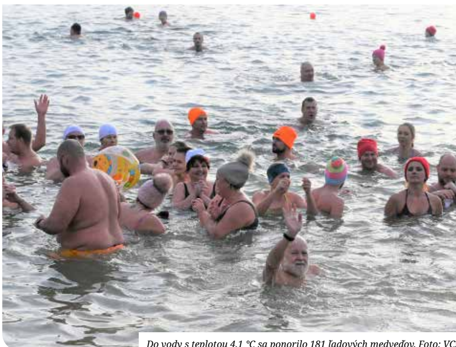
Do vody s teplotou 4,1 °C sa ponorilo 181 ľadových medved'ov.