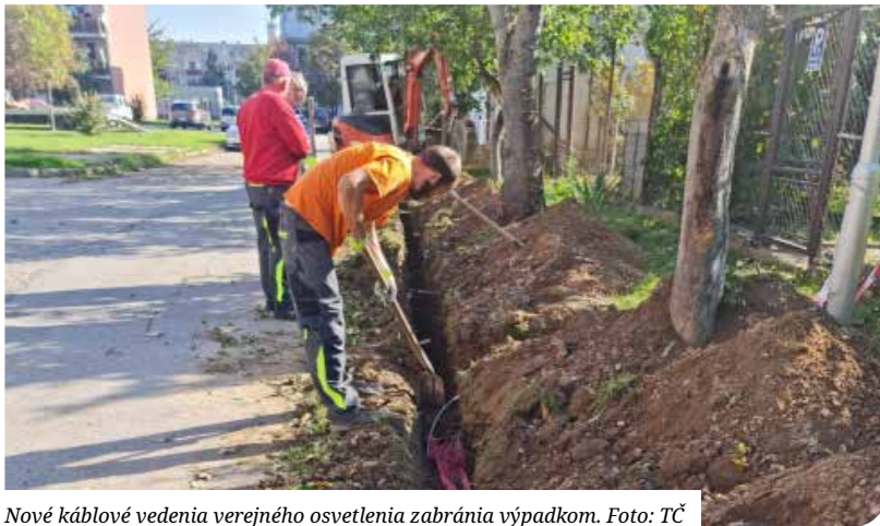
Nové káblové vedenia verejného osvetlenia zabráni výpadkom.