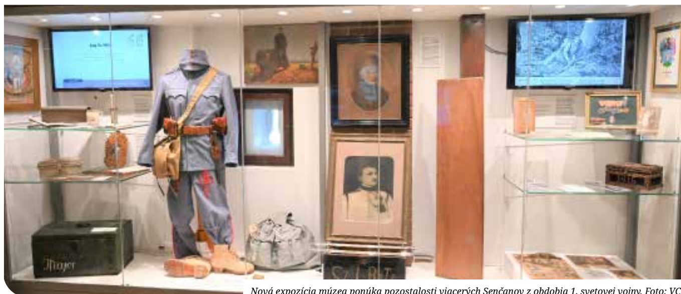
Nová expozícia múzea ponúka pozostalosti viacerých Senčanov z obdobia 1. svetovej vojny.

Úlohou jeho oddielu bolo osvetľovanie nočných bojov a údržba, oprava súvisiacej technickej výbavy (reflektorov,