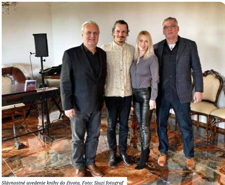
Slávnostné uvedenie knihy do života.

Je to už v názve: Naše korene sú našou korunou. Na Slovensku máme vyše 500 hradov a ku každému sa viaže niekoľko