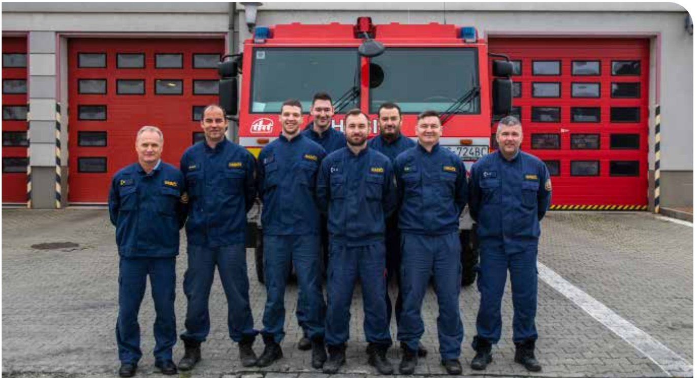
Profesionálni hasiči prajú občanom v novom roku veľa zdravia, šťastia, lásky a porozumenia a aby sa s hasičskou technikou stretávali iba na ukázkach, cvičeniach a súťažiach a aby pomoc hasičov potrebovali čo najmenej.