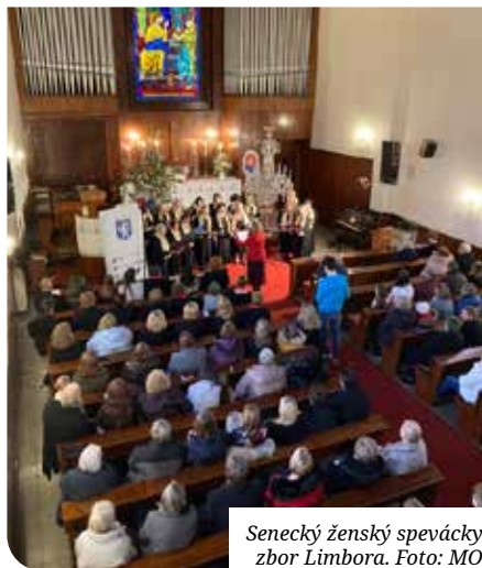
Senecký ženský spevácky zbor Limbora.