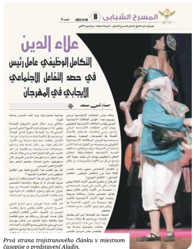
Prvá strana trojstranového článku v miestnom časopise o predstavení Aladin.