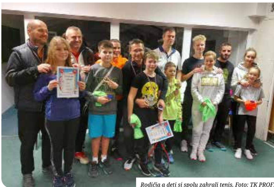
Rodičia a deti si spolu zahrali tenis.