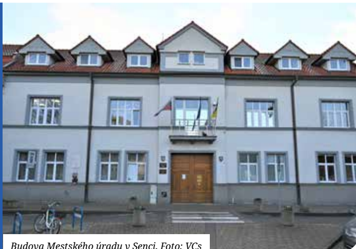
Budova Mestského úradu v Senci.

Materiály na zasadnutie sa zverejňujú na www.senec.sk a zasadnutie sa bude online vysielat na www.zastupitelstvo.sk