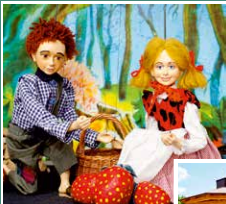
PERNÍKOVÁ CHALÚPKA 5.7. nedeľa o 16:00 3,00 Eur