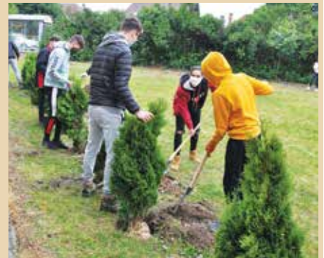
Študenti sadia tuje na dvore školy.