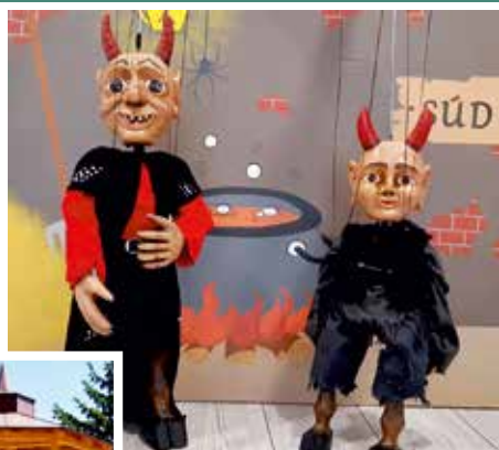
UFŮĽANÁ ROZPRÁVKA 19.7. nedeľa o 16:00 3,00 Eur