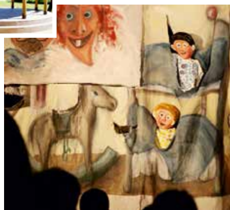
PRIPRAVUJEME: ČERTOVSKÁ ROZPRÁVKA 16.8. nedeľa o 16:00 3,00 Eur