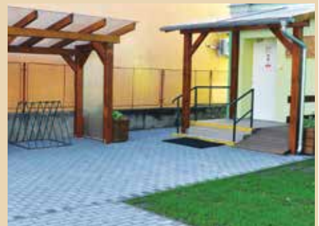
Nová dlažba na dvore škôlky.