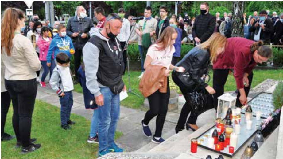
Zapálenie sviečok - „plamienka spolupatričnosti“.