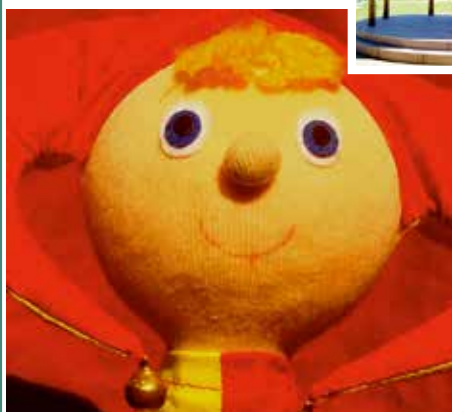
PRIPRAVUJEME: AKO ŠAŠO KRÁĽOVSTVO ZACHRÁNIL 2.8. nedeľa o 16:00 3,00 Eur