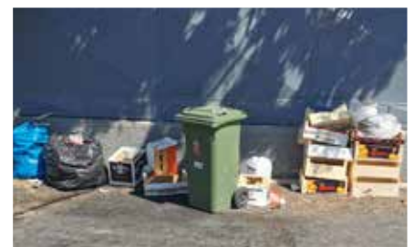
Štefánikova pri hlavnom vstupe na Slnečné jazerá.