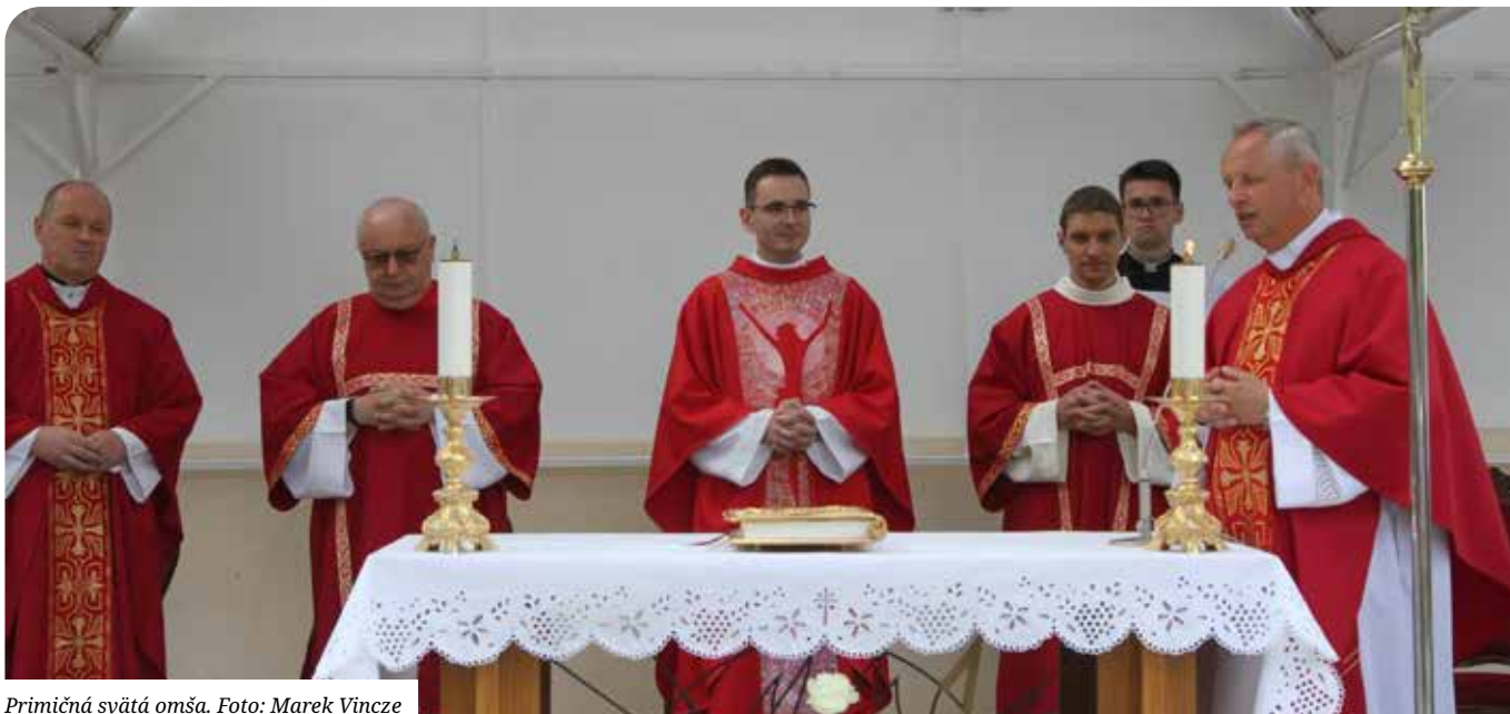
Primičná svätá omša.