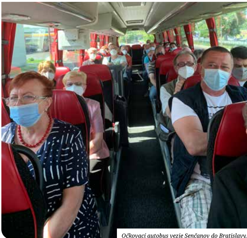
Očkovací autobus vezie Senčanov do Bratislavy.