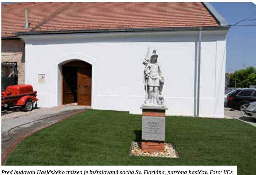
Pred budovou Hasičského múzea je inštalovaná socha Sv. Floriána, patróna hasičov.

Prvý panel nás zoznámí s vývojom hasičstva v monarchii, dozvieme sa tu viac o prvých zákonoch a o vzniku prvých hasičských spolkov na území dnešného Slovenska. Druhý panel sa už zaoberá založením Dobrovoľného hasičského spolku v Senci, ktorý vznikol 5. októbra 1879. Panel s názvom Ťažké začiatky nás prevedie prvými rokmi fungovania spolku. Štvrtý panel oboznámí návštevníka s dejinami Dobrovoľného hasičského zboru v Senci v období prvej Československej republiky, kedy vznikol aj tzv. II. hasičský zbor, ktorý fungoval iba pár rokov.