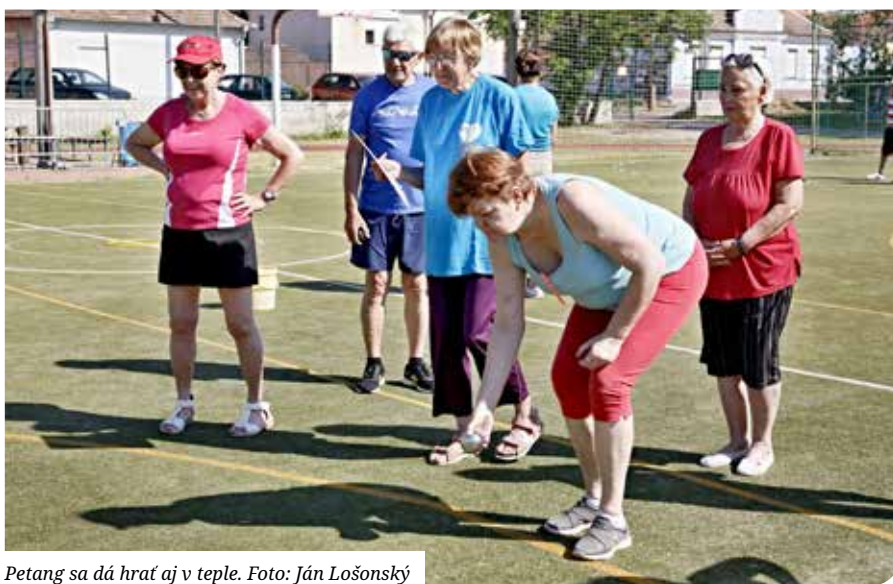
Petang sa dá hrať aj v teple.