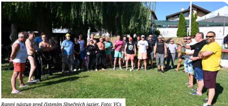
Ranný nástup pred čistením Slniečnych jazier.

Počas uplynulých ročníkov boli Slniečné jazerá zbavené celkovo 3.907 kg odpadu. Do dnešného čistenia sa zapojilo 31 potápačov zo Senca a okolia, Bratislavy, Nitry, Čiernej Vody a Popradu, ktorí spolu vynesli na breh 207 kg odpadu. Aj deti účastníkov sa pridali k akcii. Vyzbierali smeti z južnej pláže a jej okolia. Potápači našli v hĺbkach