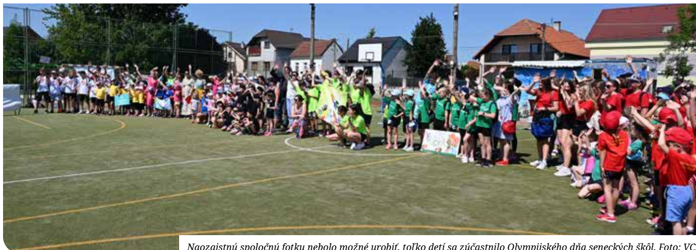
Naozajstnú spoločnú fotku nebolo možné urobiť, toľko detí sa zúčastnilo Olympijského dňa seneckých škôl.