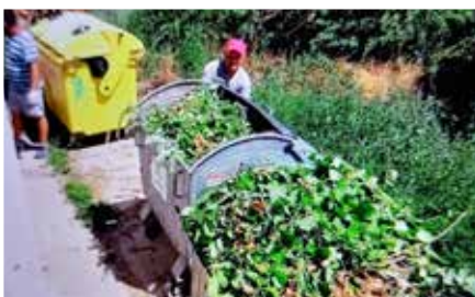
Ráno vysypali na jazerách komunálny odpad, poobede bol plný zeleného odpadu.