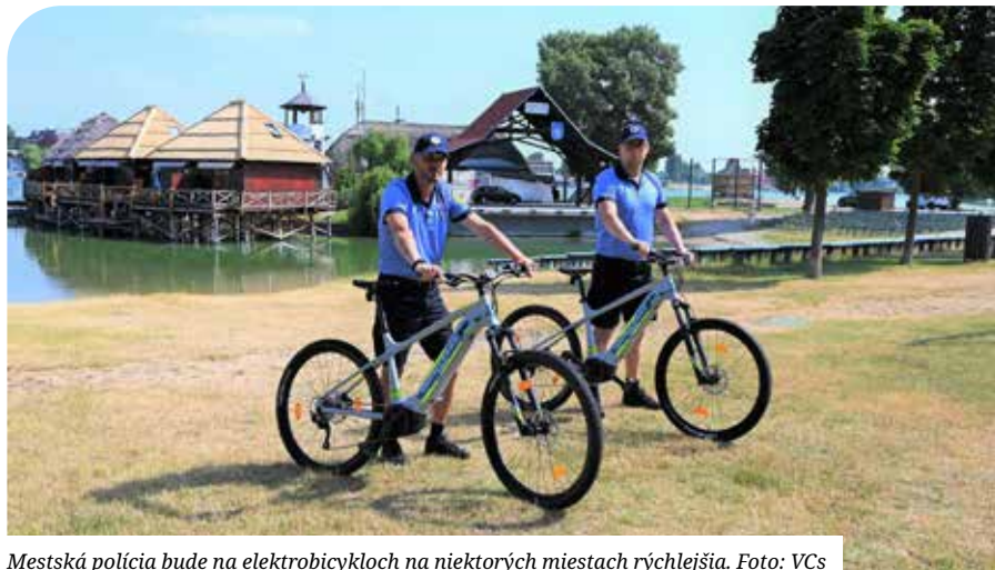
Mestská polícia bude na elektrobicykloch na niektorých miestach rýchlejšia.