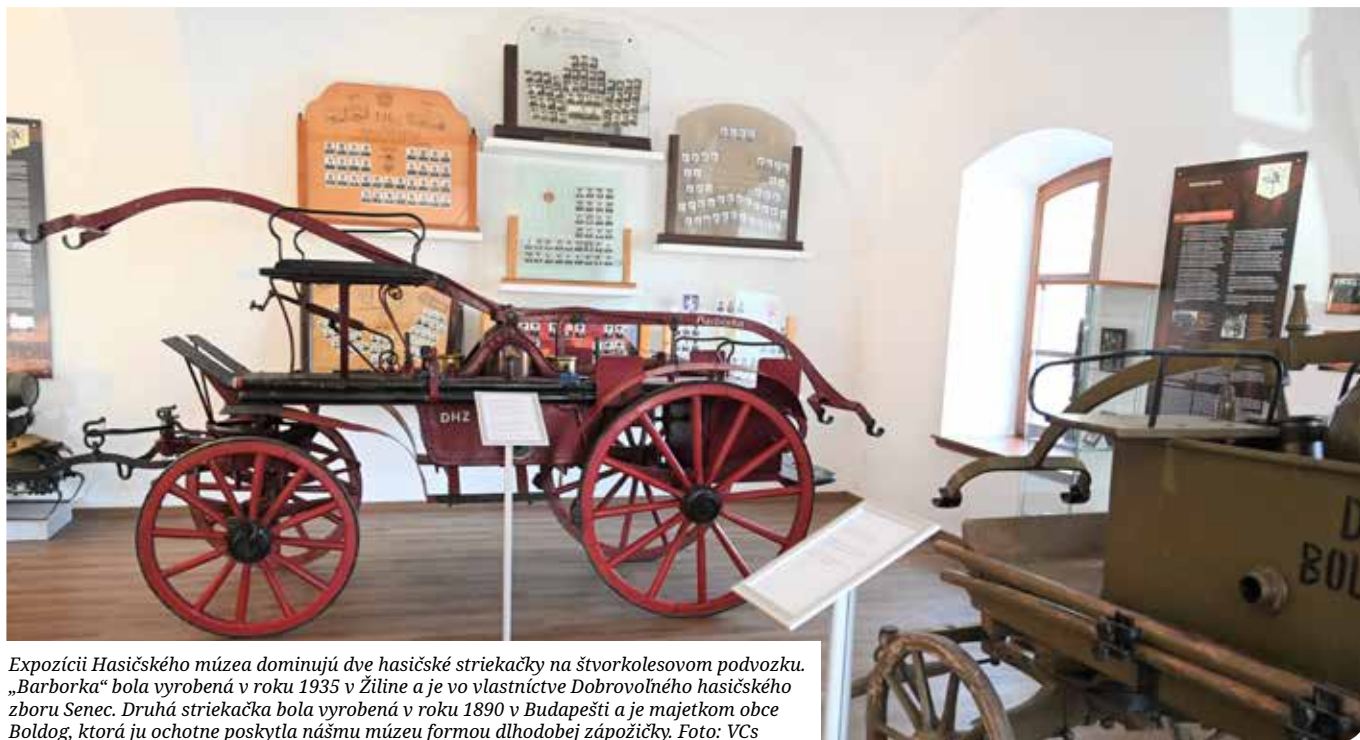
Expozícii Hasičského múzea dominujú dve hasičské striekačky na štvorkolesovom podvozku. „Barborka“ bola vyrobená v roku 1935 v Žiline a je vo vlastníctve Dobrovoľného hasičského zboru Senec. Druhá striekačka bola vyrobená v roku 1890 v Budapešti a je majetkom obce Boldog, ktorá ju ochotne poskytla nášmu múzeu formou dlhodobej zápožičky.