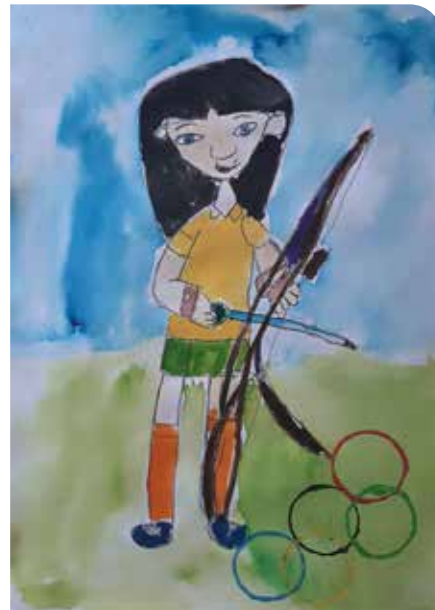
2. miesto I. kategória - deti do 6. rokov (Lukostrelec) - Emília Šiková, MŠ Kysucká 9. Dielo bude vystavené v slovenskom olympijskom dome v Tokiu.