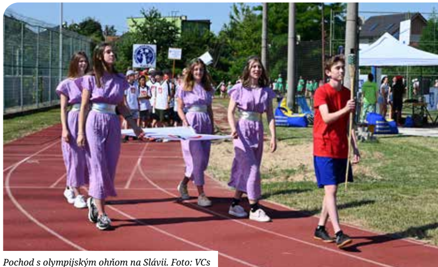
Pochod s olympijským ohňom na Slávii.

Celosvetová pandémia zapríčinila, že sa XXXI. Olympijské hry v Tokiu uskutočnia s ročným oneskorením od 23. júla do 8. augusta 2021. Púť olympijskej štafety po Japonsku odštartovala 25. marca vo Fukušime. Slovenský olympijský a športový výbor sa symbolicky pripojil k posolstvu olympijského ohňa v podobe série aktivít pre deti a mládež pod názvom Virtuálna