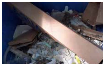
V kontajneri na papier skončil stavebný odpad.