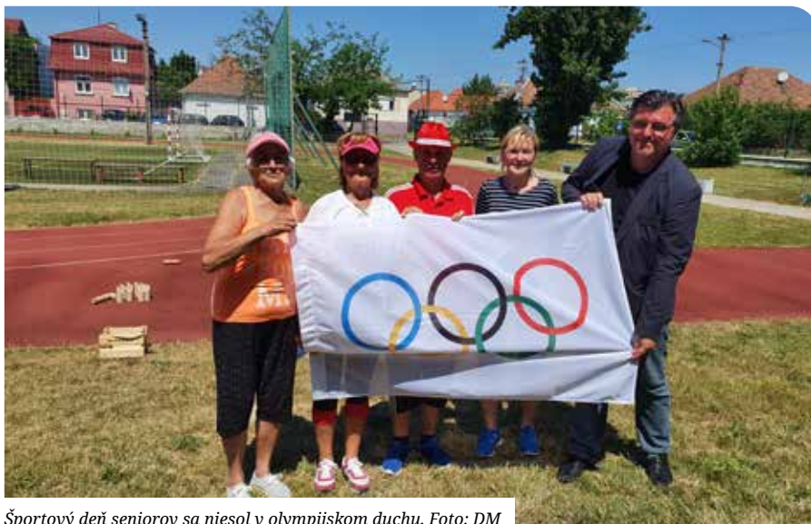
Športový deň seniorov sa niesol v olympijskom duchu.