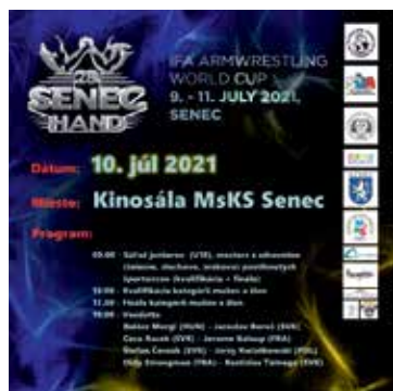
IFA ARMWRESTLING WORLD CUP 10.7. sobota