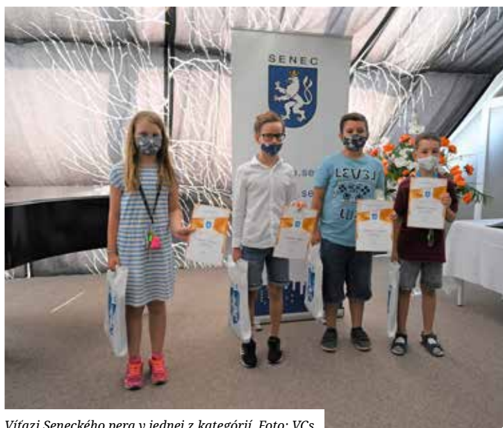
Vítazi Seneckého pera v jednej z kategórií.