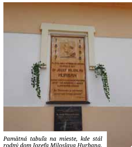
Pamätná tabuľa na mieste, kde stál rodný dom Jozefa Milošlava Hurbana.