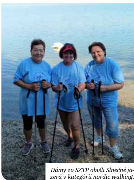
Dámy zo SZTP obišli Slnečné jazero v kategórii nordic walking.