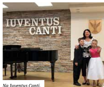
Na Iuventus Canti.