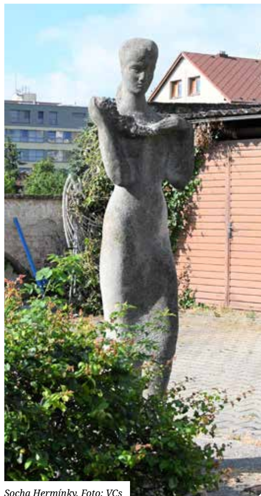
Socha Hermínky.