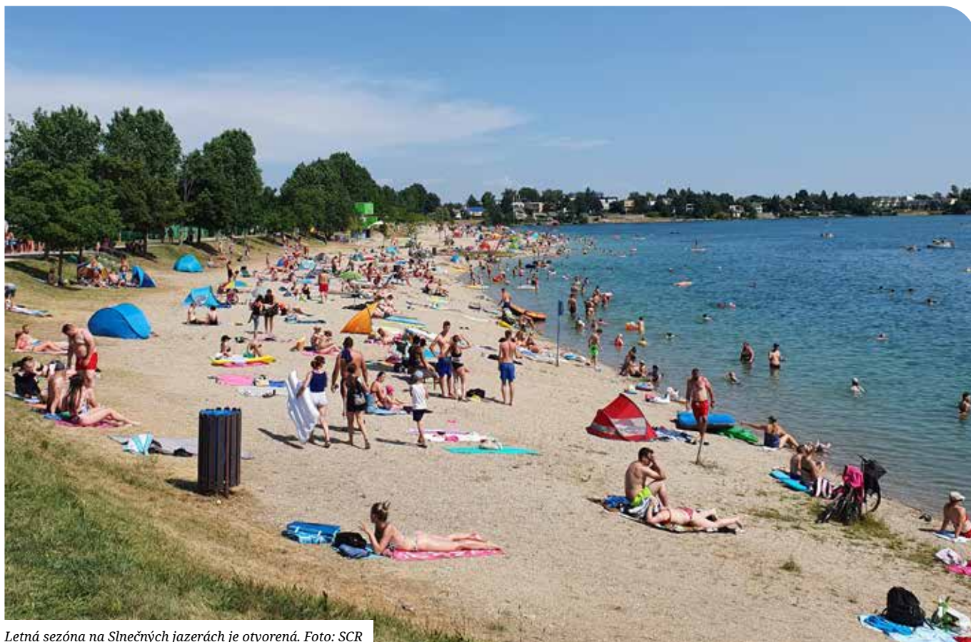
Letná sezóna na Slniečnych jazierach je otvorená.

Rozhovor s profesorom Tušerom, významnou osobnosťou žurnalistiky. (str. 20-21)