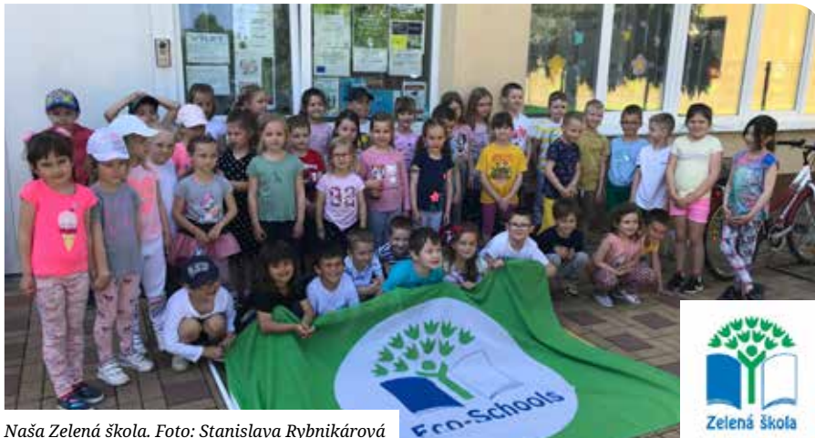
Naša Zelená škola.

Počas dvojročného certifikačného obdobia sa to v našej škole „rozbučalo“ ako v úli, pretože tému Zeleň a ochrana prírody sme sa snažili priblížiť deťom prostredníctvom pozoruhodného života včiel. Pri vstupe do MŠ sme inštalovali obrazovku, z ktorej sa deťom a rodičom prihovávajú včelári a ochrancovia prírody. Náš Eko-kódex a ciele sme vložili do hmyzieho hotela. Aby sme chránili včely, spoločne s rodičmi sme založili medonosnú záhradu s napájadlami, kde kralujú včielky, vysadili ovocné stromy, jedlý plot a jahodové pole, kde kralujú deti. V rámci proenvironmentálnej výučby sme organizovali rôzne workshopy a exkurzie. Včelársku paseku v Kráľovej pri Senci, jej arboretum aj tisíročnú včelu, deti už dobre poznajú. Tešia sa aj do ovocného sadu v Dunajskej Lužnej. Oslovili sme školskú agentúru Zvedavci, privítali sme lesného pedagóga,