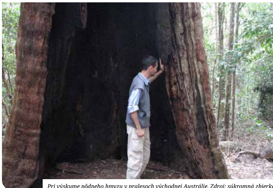
Pri výskume pôdneho hmyzu v pralesoch východnej Austrálie.

Knihy nie sú len zdrojom informácií, ale aj pocitov, emócií, radosti a strachu. V čase digitálnych médií mladí ľudia