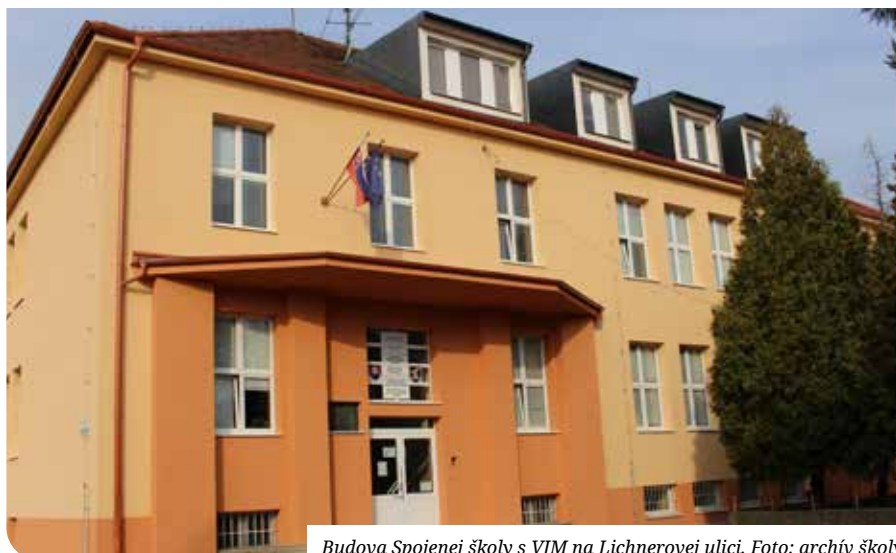
Budova Spojenej školy s VJM na Lichnerovej ulici.

Ponúkame atraktívne odbory a po absolventoch je dopyt na trhu práce. Žiaci sa učia odborné predmety v dvoch jazykoch (v maďarskom a slovenskom), základné pojmy sa učia aj v anglickom jazyku. Škola sa nachádza v centre mesta, je veľmi pekná, postupne prebieha rekonštrukcia a modernizácia.