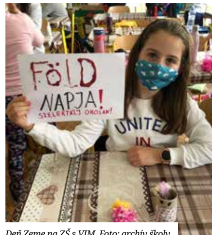
Deň Zeme na ZŠ s VJM.

Sajnos, idén a hagyományos szemétyűtés és az újrahasznosító bolhapiac elmaradt a járványellenes intézkedések miatt, de