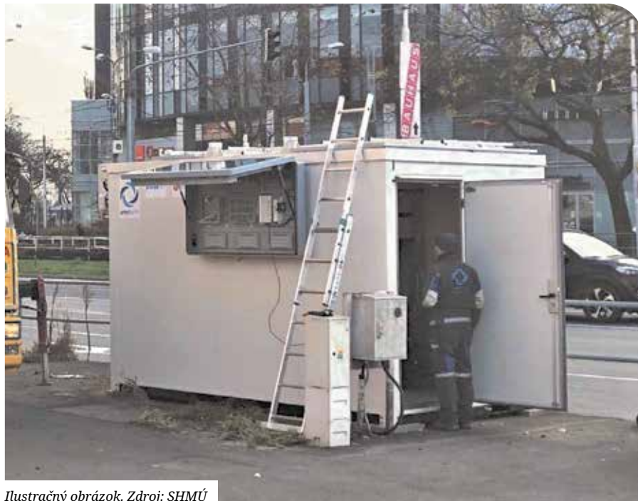
Ilustračný obrázok.

Monitorované parametre odprezentuje obyvateľom mesta svetelná tabuľa a budú dostupné aj na web stránke SHMÚ v sekcii Spravodajstvo kvality ovzdušia. V prípade zhoršenia kvality bude SHMÚ