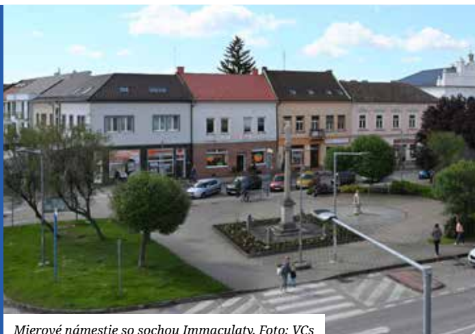
Mierové námestie so sochou Immaculaty.

Materiály na zasadnutie sa zverejňujú na www.senec.sk a zasadnutie sa bude online vysielat na www.zastupitelstvo.sk