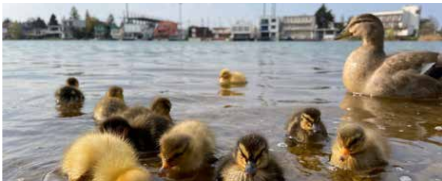
Čas pokoja vodného vtáctva na Slnčných jazerách sa pomaly končí. Letnú turistickú sezónu ovplyvnia protipandemické opatrenia. Od ich uvoľňovania bude závisieť režim v areáli.

Možnosť vyzdvihnúť si rozhodnutia k dani z nehnuteľností a poplatkom za odpady, prípadne iné daňové rozhodnutia na Mestskom úrade v Senci (tzv. dlhý týždeň) bude od 31. mája do 5. júna (vrátane) a v pondelok 7. júna 2021 v čase: pondelok – piatok 07:00 – 18:00 a v sobotu 8:00 – 12:00.