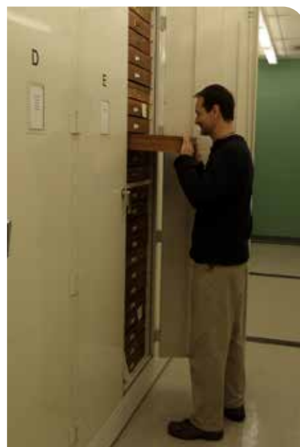
Analýzy starých neurčených zbierok hmyzu v newyorskom prírodovednom múzeu sa zdajú byť na prvý pohľad trochu nudné. Pre zoológa je však opak pravdou.