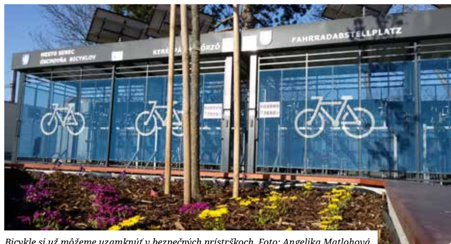
Bicykle si už môžeme uzamknúť v bezpečných prístreškoch.