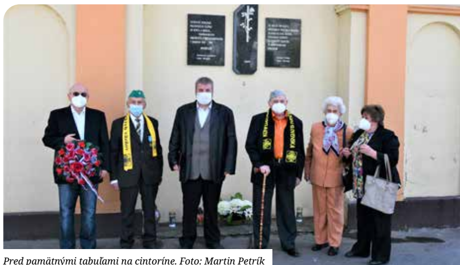
Pred pamätnými tabuľami na cintoríne.