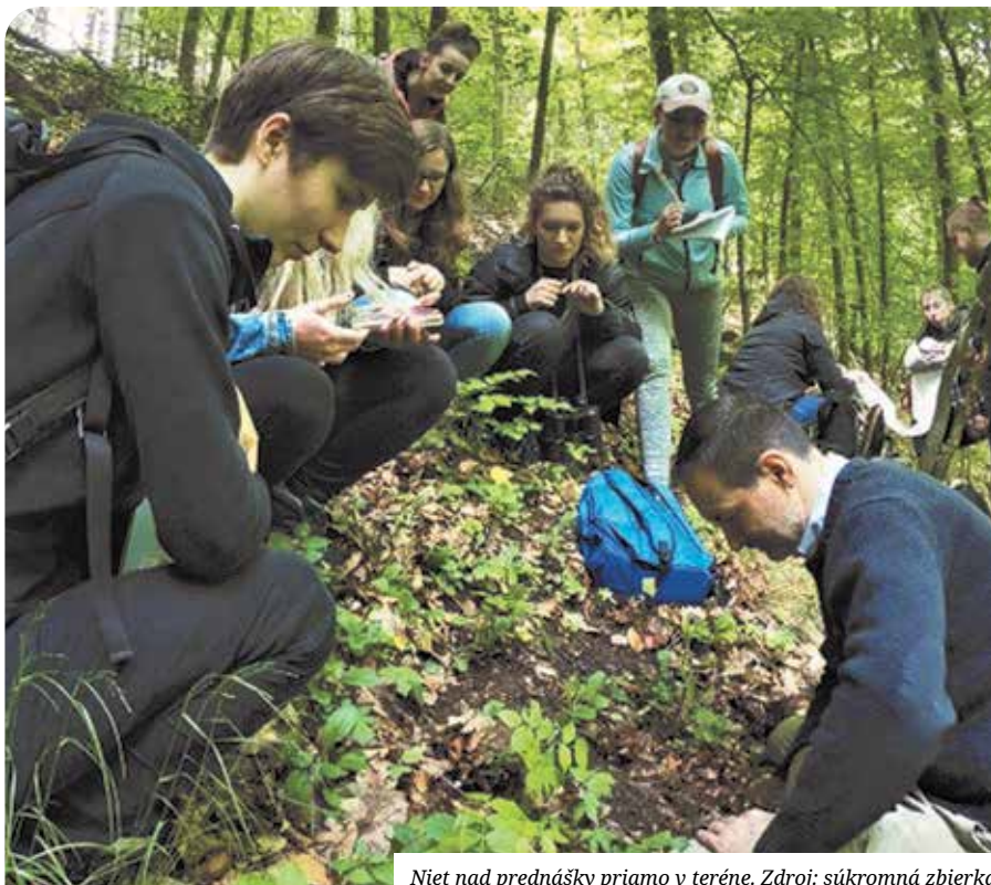
Niet nad prednášky priamo v teréne.

prichádzajú o „chuť“ knihy. Získal som nedávno vzácnu prvotlač z konca 15. storočia, ktorú pokojne mohli listovať študenti aj na našej bratislavskej Istropolitane. Keď privrie čitateľ oči, ten ruch neustálej túžby po vzdelávaní a humanizácii vedy sa jednoducho nedá v nej prepočuť.