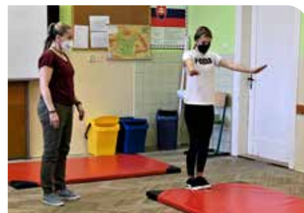
Talentové skúšky z telesnej výchovy

Az, hogy végül hány tanulóval találkozunk szeptemberben a tanévnyitón, majd