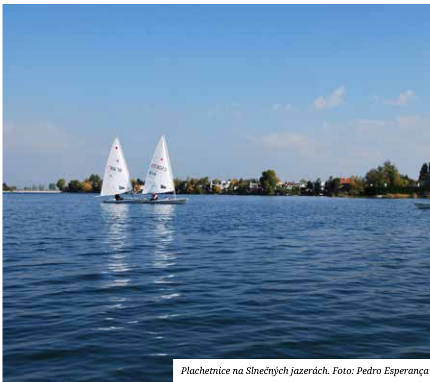
Plachetnice na Slniečných jazierách.