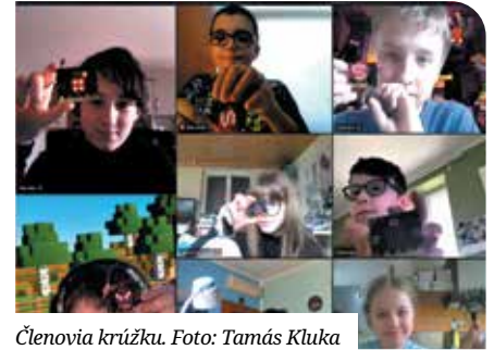
Členovia krúžku.

A szakkörre nyolc diák jelentkezett. Annak ellenére, hogy új felületen, az MS