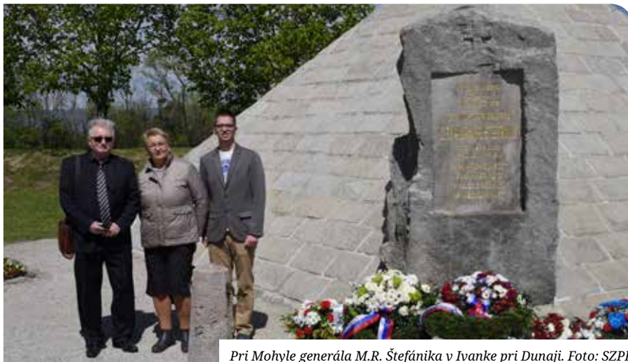
Pri Mohyle generála M.R. Štefánika v Ivanke pri Dunaji.

Miestny odbor Matice slovenskej v spolupráci s mestom Senec pozýva všetkých