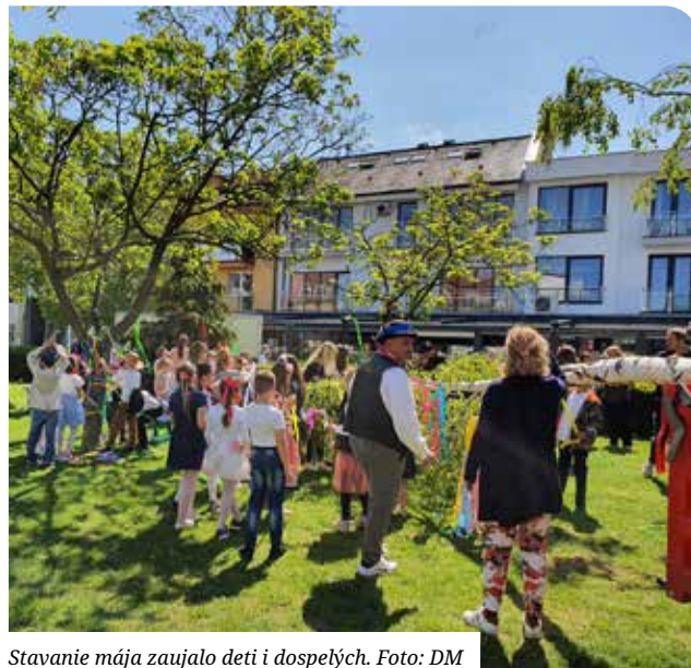
Stavanie mája zaujalo deti i dospelých.