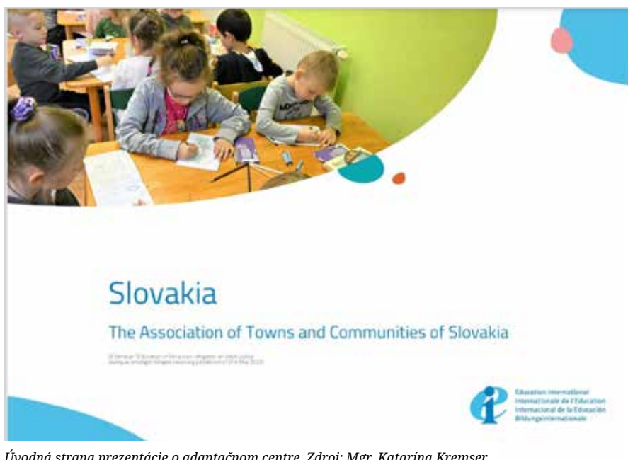
Úvodná strana prezentácie o adaptačnom centre.