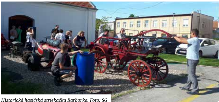
Historická hasičská striekačka Barborka.