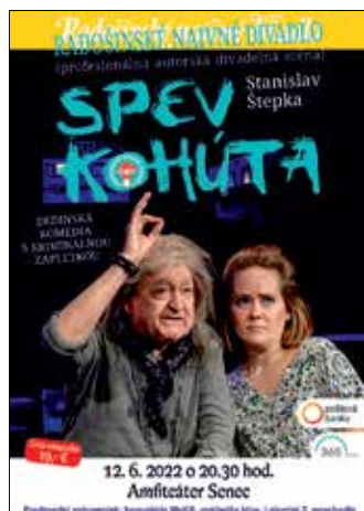
SPEV KOHŪTA Radošinské naivné divadlo zmena dátumu 12.6. nedeľa o 20:30