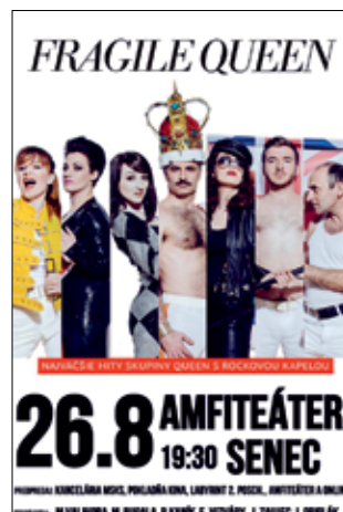
FRAGILE QUEEN Koncert 26.8. piatok o 19:30