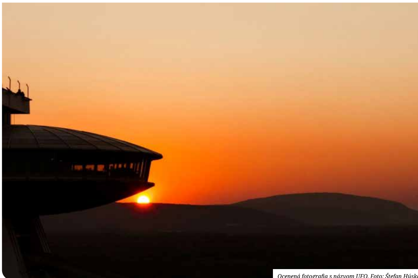
Ocenená fotografia s názvom UFO.