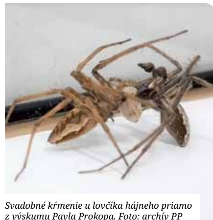
Svadobné kŕmenie u lovcíka hájneho priamo z výskumu Pavla Prokopa.

Mám len výskumné méty, chcem realizovať svoje nápady. Nemám iné ciele, nemám vôbec ambíciu získať akademickú pozíciu ako napríklad vedúci katedry,