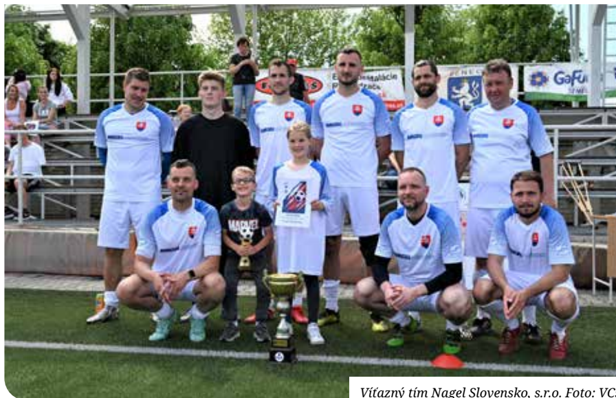
Vítaný tím Nagel Slovensko, s.r.o.