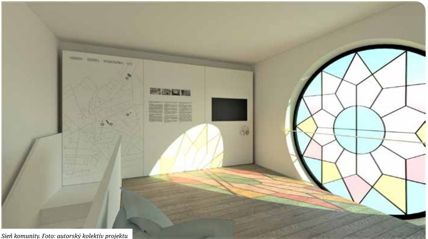
Sieň komunity.

ktorý sme odovzdali pánovi primátorovi minulý rok 9. septembra pri príležitosti Pamätného dňa obetí holokaustu a rasového násillia.