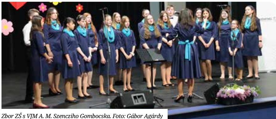
Zbor ZŠ s VJM A. M. Szenciho Gombocska.