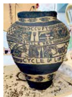
Výstava Výtvarný odbor žiakov ZUŠ Senec 15.6. streda o 18:30 vernissáž Výstava trvá od 15.6. do 30.6. Vstup voľný