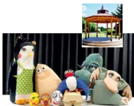
CESTOVINY S VAJCOM NevaDivadlo 19.6. nedeľa o 16:00 Park oddychu - altánok Autorská rozprávka na motívy oblíbeného príbehu o vajci, ktoré išlo na vandrovku. V príbehu vystupujú cestovatelia, ktorí informujú detského diváka o zaujímavostiach, ktoré si dieťa môže ľahko zapamätať. Vstupné: 3,00 Eur