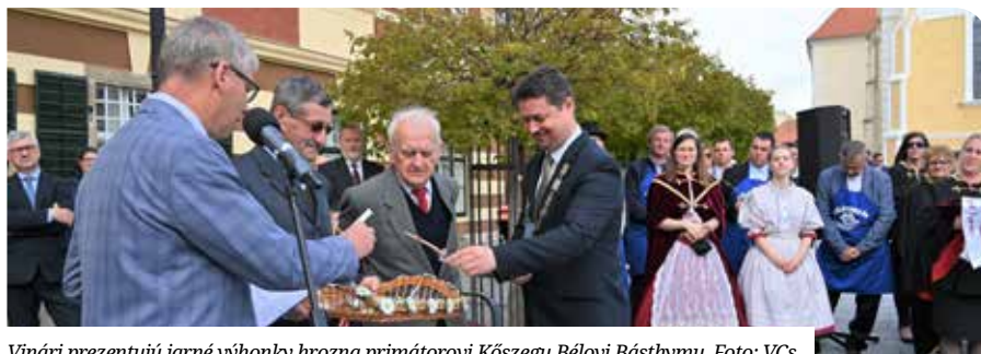
Vinári prezentujú jarné výhonky hrozna primátorovi Kőszegu Bélovi Básthymu.

Szenc és Kőszeg városok barátságát a 2010-ben megkötött partnerségi és együttműködési megállapodás szentesítette. Az elmúlt években kölcsönösen előnyös kapcsolatok jöttek létre az oktatás és a kultúra területén, de a két város és az őket övező régiók borászai között is. A járvány miatt megszakadt személyes kapcsolatok április 24-én Kőszegen, a Szent György-napi ünnepségek keretében újultak meg.