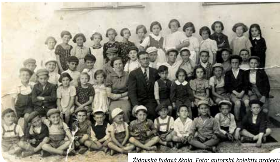
Židovská ľudová škola.