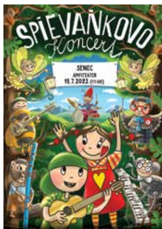
SPIEVANKOVO Koncert 15.7. piatok o 17:00