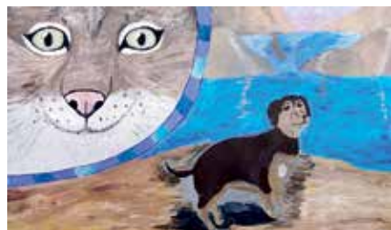
Výstava Súkromná základná umelecká škola Ateliér Kompas z Novej Dedinky 5.6. nedeľa o 15:00 vernissáž a vystúpenie hudobného odboru Výstava trvá od 26.5. do 12.6. Vstup voľný