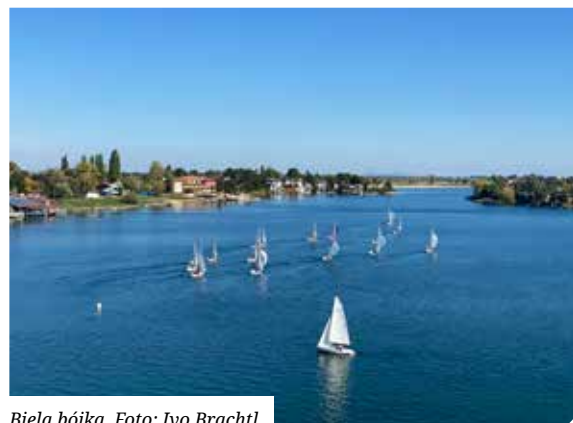
Biela bójka.