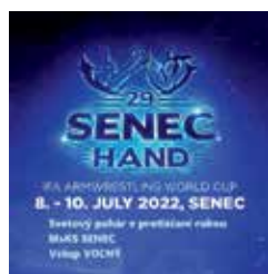
IFA ARMWRESTLING WORLD CUP 9.7. sobota