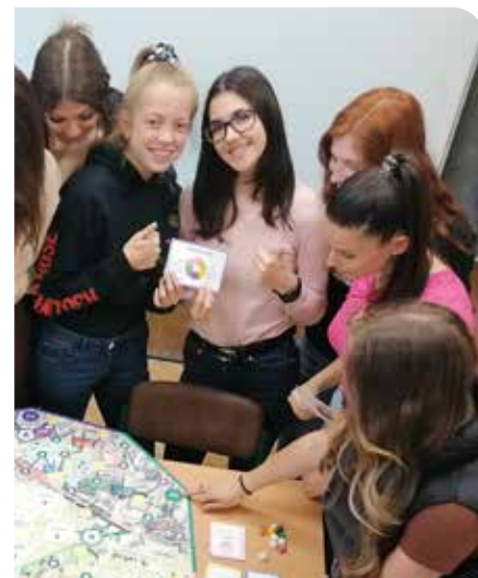
Študentky sa zoznamujú s programom participatívneho rozpočtu.