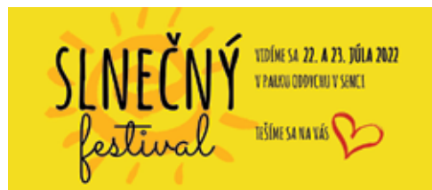
SLNEČNÝ FESTIVAL 22. a 23. júl v Parku oddychu