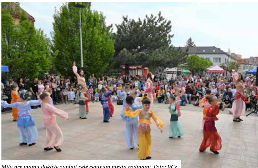
Míľa pre mamu dokáže zaplniť celé centrum mesta rodinami.