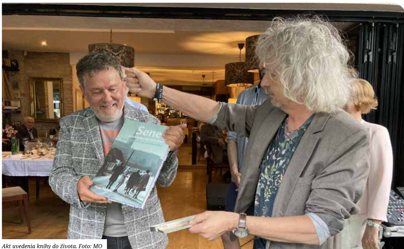
Akt uvedenia knihy do života.