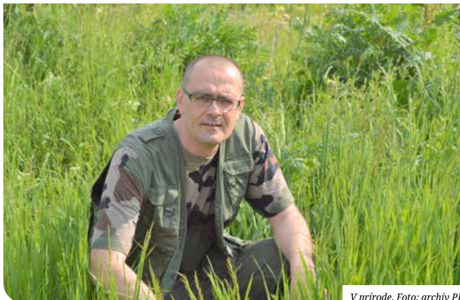
V prírode.

Nikdy som nemal iné hobby, len biológiu. Najprv som preferoval vtáky a potom na základnej škole som choval modlivky. Neskôr som sa začal venovať pavúkom a hmyzu, viac-menej z logistických dôvodov, pretože sa s nimi dá oveľa efektívnejšie manipulovať. Začal som klásť jednoduché otázky, napríklad prečo samica modlivky či pavúka zožerie samca? Gymnázium som absolvoval v Pezinku. Biológia ma stále bavila. Doma som vyrábal búbky pre vtákov, chodil som po prírode, robil som si zápisky, meral šublerou vajíčka strák, ale chýbal niekto, kto by ma správne nasmeroval. Venoval som sa tomu po škole, cez víkendy, cez prázdniny... Chodil som do Búroša, dnes už ten lesík neexistuje, potom popri kolajniciach od Senca až do Bernolákova. Všetky stračie hniezda, ktoré sa dali zliezť, som ich zliezal a zaznamenával som si údaje o počte vajíčok, predácii a podobne. Tam som si prvýkrát všimol, že keď sa sokol myšiar objavil pri stračom hniezde, za pár dní straku vyhnal z hniezda.