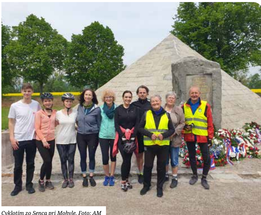
Cyklotím zo Senca pri Mohyle.