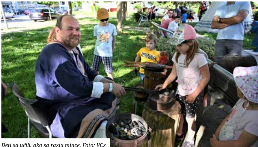
Deti sa učili, ako sa razia mince.