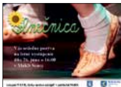
SLNEČNICA 26.6. nedeľa o 16:00