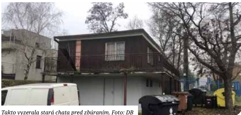
Takto vyzerala stará chata pred zbúraním.