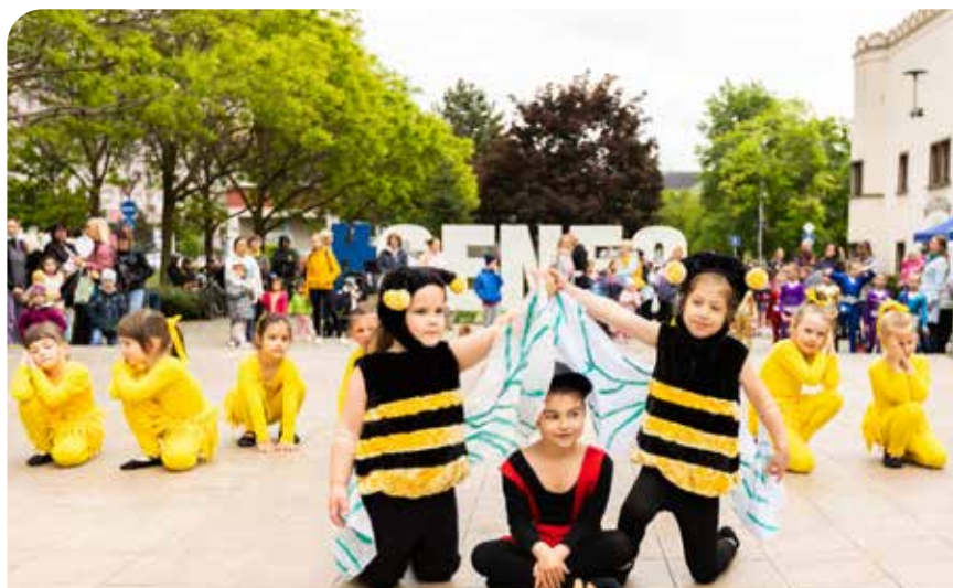
Na mnohých miestach Slovenska a zahraničia sa 13. mája oslavuje materstvo. Prejdením pomyselnéj míle sme sa chceli poďakovať mamám, starým mamám, krstným mamám aj adoptívnym mamám za ich bezhraničnú lásku.