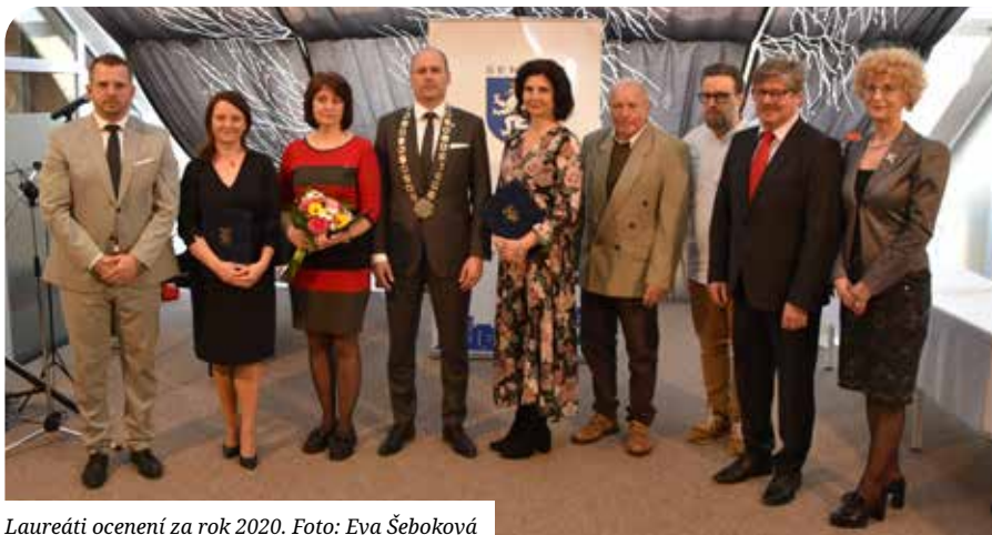
Laureáti ocenení za rok 2020.