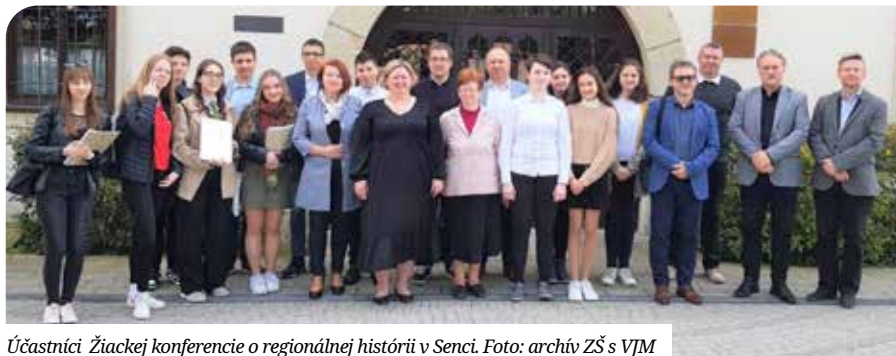
Účastníci Žiackej konferencie o regionálnej histórii v Senci.

A Szenczi Molnár Albert Alapiskola, a Szenci Városi Múzeum és a Szenczi Molnár Albert Pedagógiai és Közgazdasági Szakközépiskola 2023. április 28-án, pénteken tartotta a Szenci Városi Múzeum épületében a X. helytörténeti diákkonferenciáját.