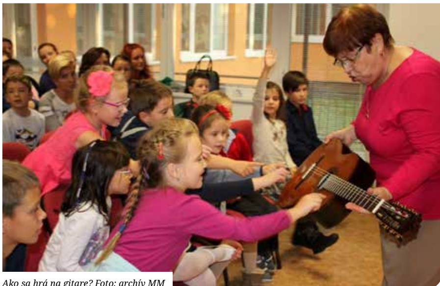
Ako sa hrá na gitare?