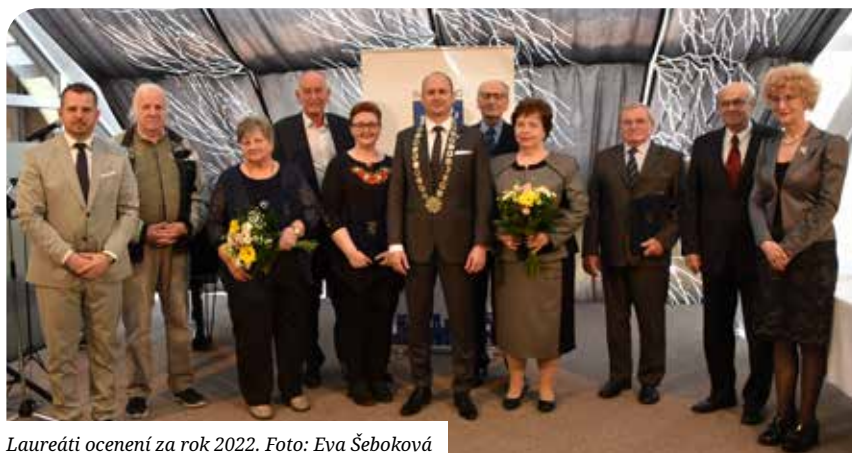
Laureáti ocenení za rok 2022.

Veľkým letným karnevalom sa rozlúčime so školským rokom 2022/2023 a privítame prázdniny. (str. 27)