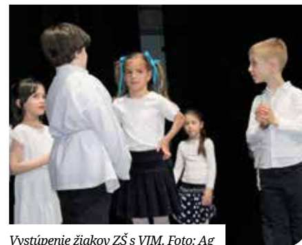
Vystúpenie žiakov ZŠ s VJM.