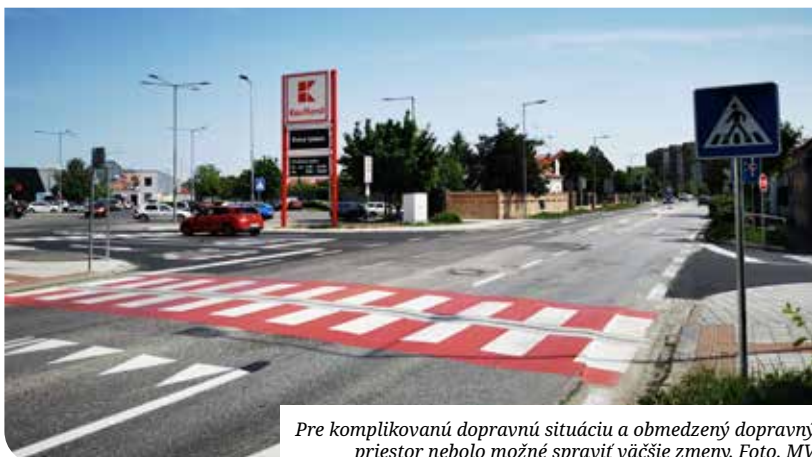
Pre komplikovanú dopravnú situáciu a obmedzený dopravný priestor nebolo možné spraviť väčšie zmeny.

dotiahli vylepšenia pre účastníkov cestnej premávky ako aj chodcov v tejto časti mesta. Realizátori zabezpečili práce tak, aby boli obmedzenia minimálne. Ďakujeme obyvateľom mesta za trpezlivosť.