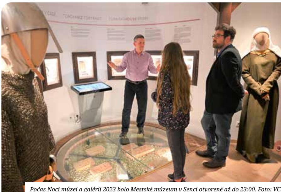
Počas Noci múzeí a galérií 2023 bolo Mestské múzeum v Senci otvorené až do 23:00.