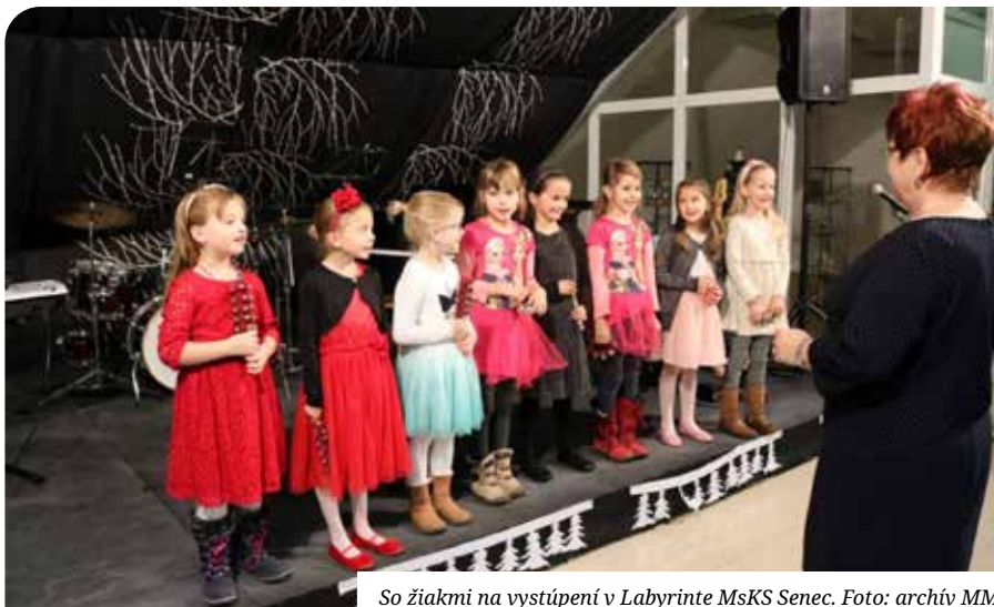
So žiakmi na vystúpení v Labyrinte MsKS Senec.

pre absolventov. Príklady z rôznych oblastí predmetu ako pracovné listy pre všetky ročníky, vyhľadávanie zaujímavých piesní, pri ktorých sa dá použiť hra na telo, rytmický a klavírny sprievod. Piesne so sprievodom harmoniky. Vianočné piesne a koledy.