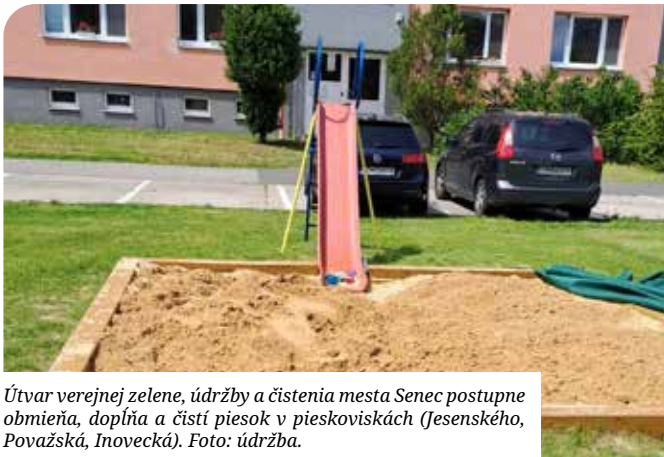
Útvar verejnej zelene, údržby a čistenia mesta Senec postupne obmieňa, dopĺňa a čistí piesok v pieskoviskách (Jesenského, Považská, Inovecká).