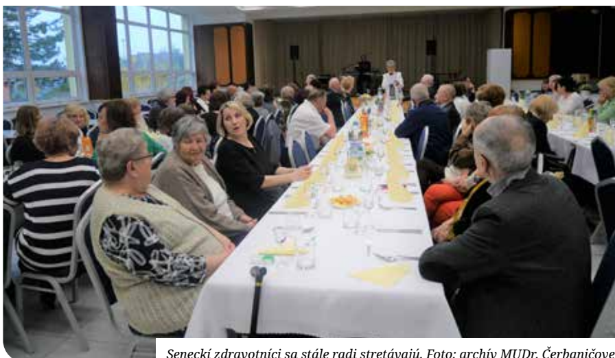
Seneckí zdravotníci sa stále radi stretávajú.

Želáme si, aby mladší kolegovia spomínali na starších predchodcov, ktorí pracovali za iných pracovných podmienok. S úctou sme si pripomenuli aj zosnulých kolegov, ktorí nie sú už medzi nami.