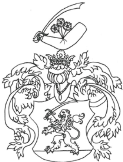
Erb rodu Imely