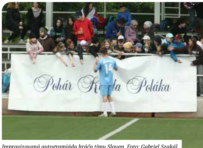
Improvizovaná autogramiáda hráča tímu Slovan.