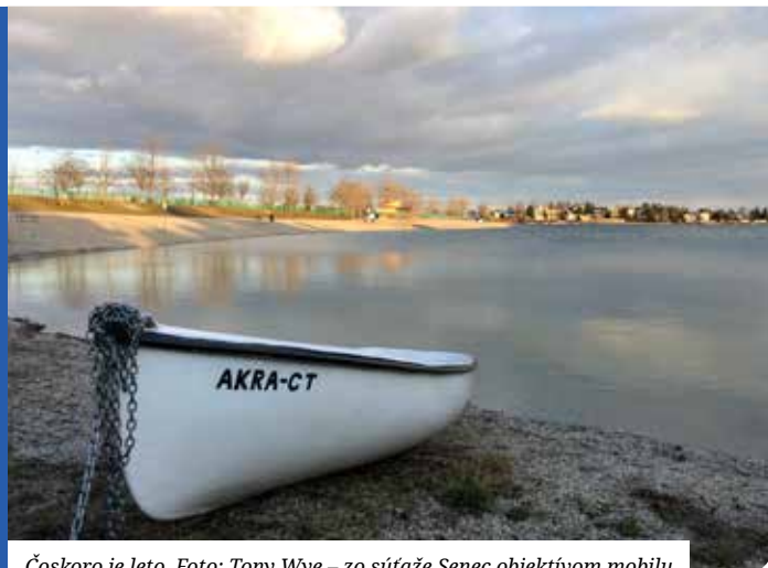
Čoskoro je leto. Foto: Tony Wye – zo súťaže Senec objektívom mobilu

Materiály na zasadnutie sa zverejňujú na www.senec.sk a zasadnutie sa bude online vysielat na www.zastupitelstvo.sk