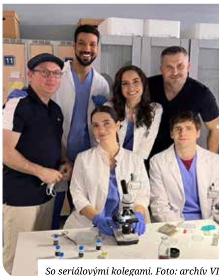
So seriálovými kolegami.