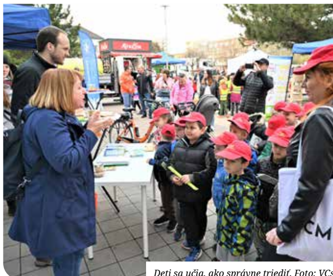
Deti sa učia, ako správne triediť.