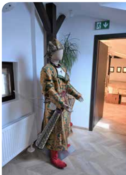
Prvá z troch postáv v dobovom oblečení.

Písomný súhlas na spoluprácu dali tri múzeá, ktoré budú pre potreby expozície ochotné dlhodobo zapožičať svoje relevantné zbierky. Ide o Slovenské národné múzeum – Archeologické múzeum v Bratislave, Slovenské národné múzeum – Historické múzeum v Bratislave a o Vlastivedné