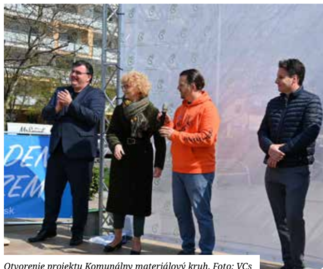
Otvorenie projektu Komunálny materiálový kruh.