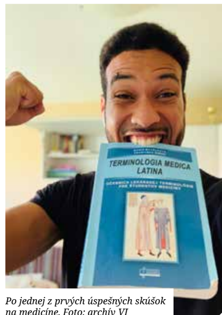
Po jednej z prvých úspešných skúšok na medicíne.

Obaja rodičia – mama je vyštudovaná zdravotná sestra a otec internista, nefrológ. Kým však bol len internista, musel sa tiež veľa učiť, aby mohol byť nefrológom. Vtedy mu mama veľmi pomáhala a vyrastali sme v medicínskej terminológii. Od malička sme počúvali rôzne cudzie