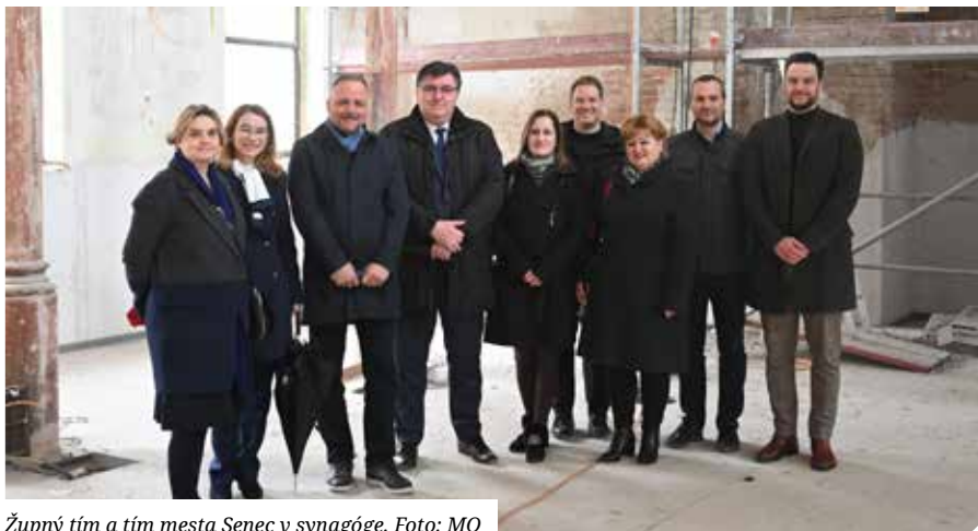
Župný tím a tím mesta Senec v synagóge.

Primátora zaujímali plány BSK na rekonštrukciu križovatky ciest II/503 a III/1062, kde je teraz kapacitne nevyhovujúci kruhový objazd (výjazd zo Senca na diaľnicu). Pracuje sa na prípravách zmeny križovatky s tým, aby tu nevznikli také veľké zápchy ako v súčasnosti. MO