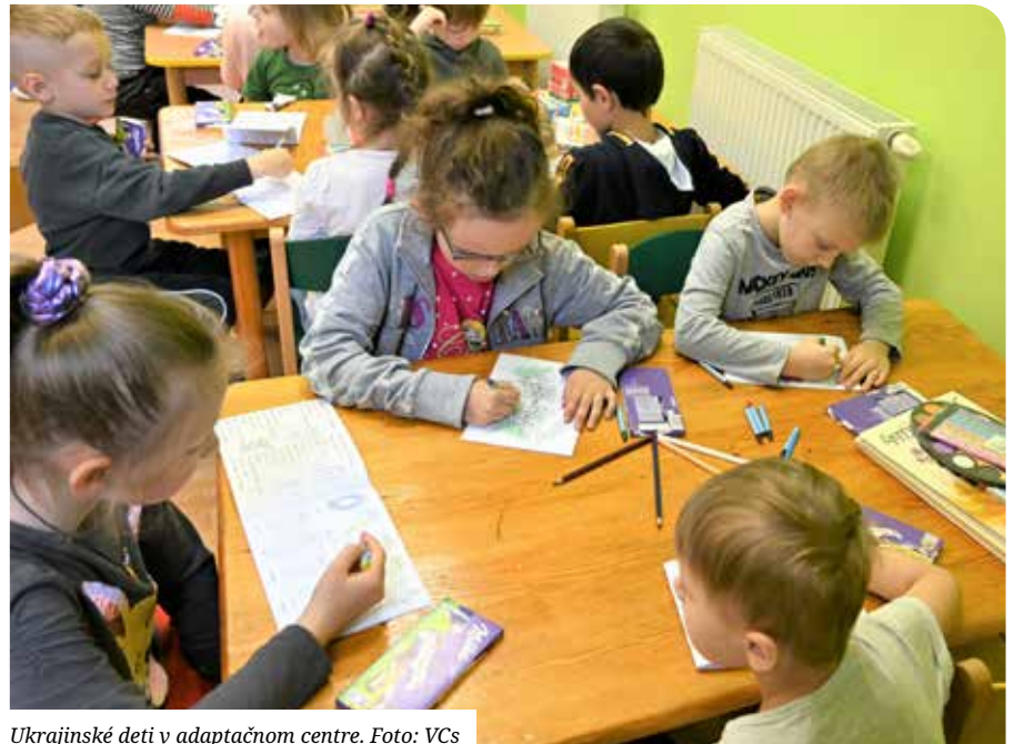
Ukrajinské deti v adaptačnom centre.

Krízový tím spustil elektronickú databázu na prepojenie zložiek, ktoré zabezpečujú pomoc tak, aby samospráva dokázala identifikovať počet, cieľovú skupinu,