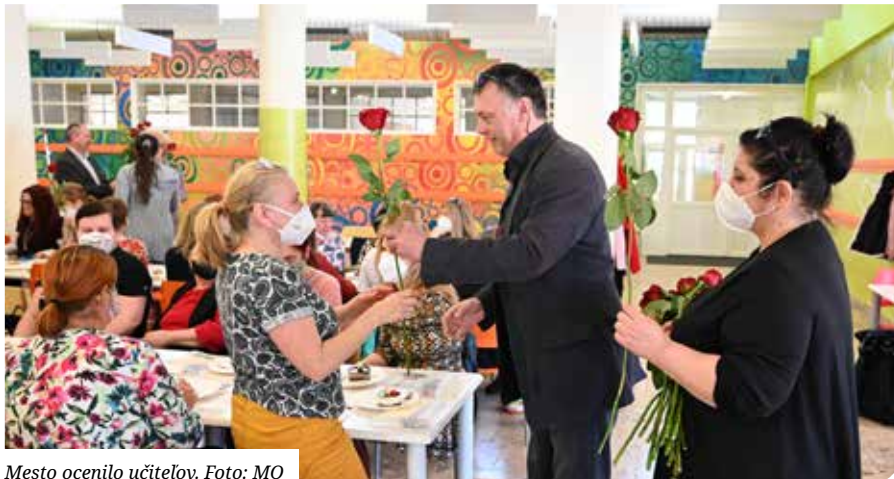
Mesto ocenilo učiteľov.

na nákup kníh a pán primátor pre všetkých zabezpečil ružu ako vďaka za záslužnú prácu. Učiteľia ostatných seneckých škôl dostali tiež ďakovný list a pero. Osobne prišli učiteľom zablahoželať predstavitelia mesta a komisie školstva a kultúry. MO