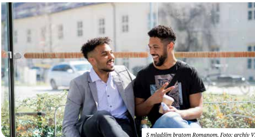
S mladším bratom Romanom.