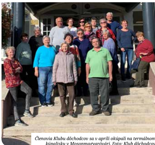
Členovia Klubu dôchodcov sa v apríli okúpali na termálnom kúpalisku v Mosonmagyaróvári.