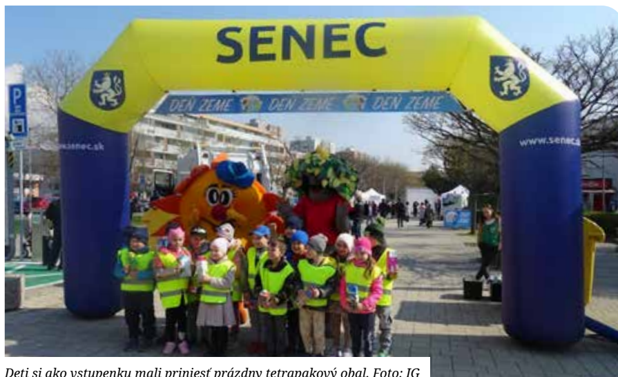
Deti si ako vstupenku mali priniesť prázdny tetrapakový obal.

Tohoročné podujatie bolo výnimočné tým, že senecský primátor ohlásil správu, ktorá poteší všetkých, ktorým záleží na zodpovednom prístupe k životnému prostrediu. Dňom zeme bol otvorený projekt Komunálny materiálový kruh Senec, ako prvý svojho druhu na Slovensku. Projekt spája separovanie odpadu a obehovú eko-