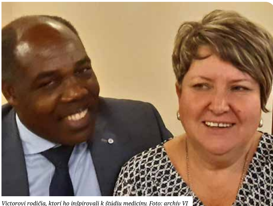
Victorovi rodičia, ktorí ho inšpirovali k štúdiu medicíny.

Určite by som veľmi rád zostal pracovať aj v Senci. Ak by bolo voľné miesto, hneď by som ho vzal. Alebo pokojne aj nejakú dedinu alebo nejaké mesto v okolí. Určite by som radšej pracoval tu ako v Bratislave alebo niekde v zahraničí.