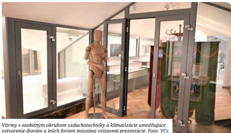
Vitríny s osobitným okruhom vzduchotechniky a klimatizácie umožňujúce vytvorenie diorám a iných foriem múzejnej výstavnej prezentácie.

múzeum v Galante. Okrem týchto inštitúcií sme rámcovo komunikovali a ráťame so spoluprácou aj s Prírodovedným múzeom SNM v Bratislave, Múzeom mincí a medailí v Kremnici ale aj Ústredným archívom knižnice Rehole piaristov v Budapešti. Ostatné exponáty budú pochádzať z vlastných zbierok Mestského múzea v Senci.