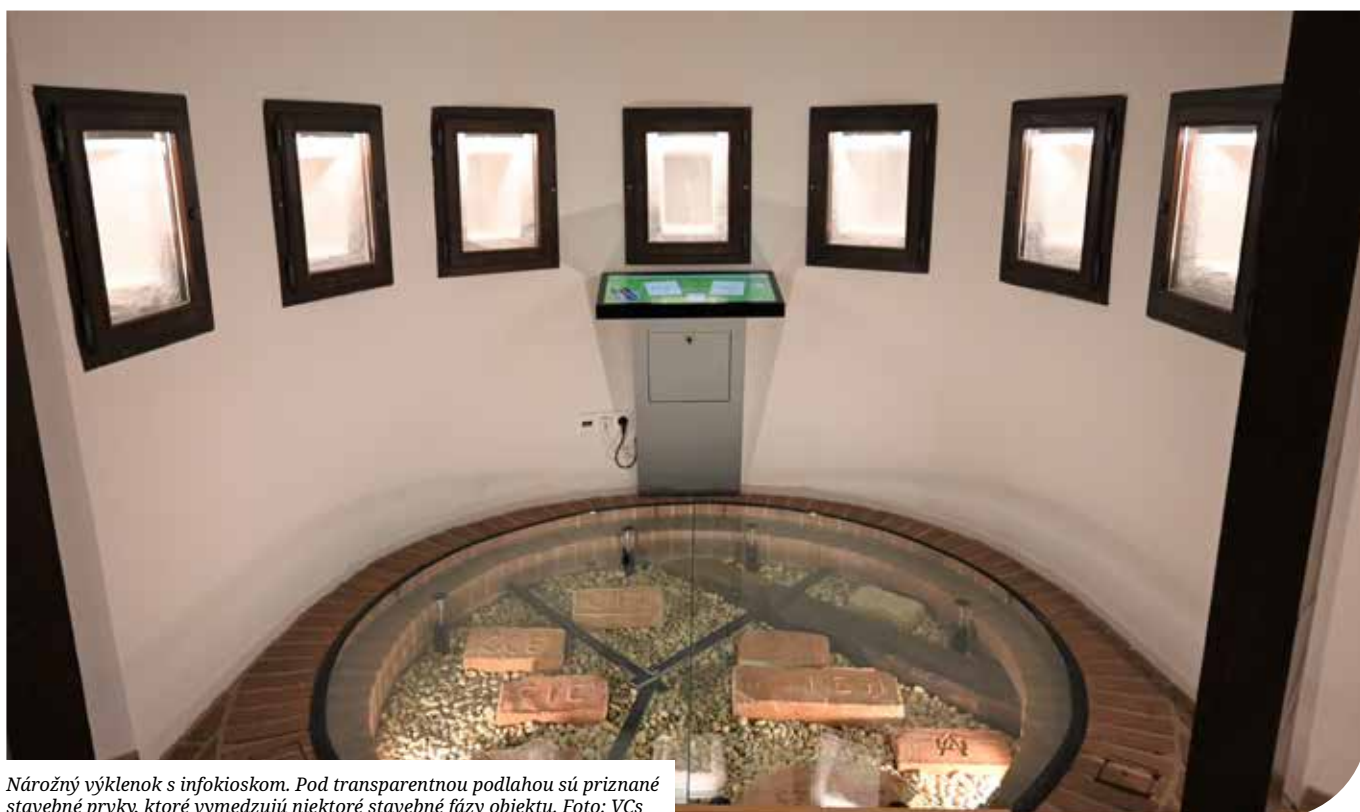
Náročný výklenok s infokioskom. Pod transparentnou podlahou sú priznané stavebné prvky, ktoré vymedzujú niektoré stavebné fázy objektu.

Niektorým obdobiam sa budeme venovať viac. Napríklad pripravujeme ideálnu rekonštrukciu časti hrovej komory halštatskej mohyly. Tiež z novších dejín možno spomenúť tematické spracovanie prvej vysokej školy ekonomického zamerania v Uhorsku, seneckého Collegium Oeconomicum, alebo výsledky archeologického výskumu stredovekého hradu Čeklís v neďalekom Bernolákove. V týchto prípadoch bude spracovaná tematika podporená aj