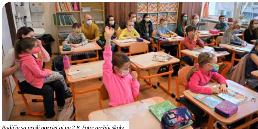
Rodičia sa prišli pozrieť aj na 2.B.

Ha a leendő beiratkozó elsős a család legidősebb gyermeke, akkor a szüleinek még nem volt kapcsolata az alapiskolával, nincsenek ismeretei az alapiskolában zajló életről, oktató-nevelő munkáról. Elsősorban az ő kedvükért hirdettünk nyílt napot az alsó tagozaton április 8-ra, péntekre.