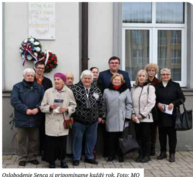
Oslobodenie Senca si pripomínáme každý rok.