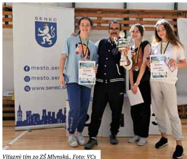
Vítaný tím zo ZŠ Mlynská.