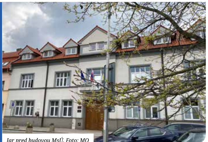
Jar pred budovou MsÚ.

Materiály na zasadnutie sa zverejňujú na www.senec.sk a zasadnutie sa bude online vysielat na www.zastupitelstvo.sk