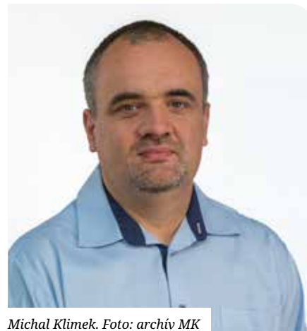
Michal Klimek.

Myšlienka eventu vznikla v októbri minulého roka. Spolu s 13-ročným synom sme mali možnosť navštíviť deň otvorených dverí pre stredné školy na vysokej