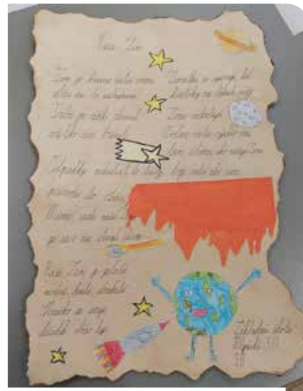
Básnička, ktorú vytvorila 3.B zo ZŠ Mlynská.

Školy sa pripravovali na Deň Zeme vopred. Rozprávali sa o životnom prostredí a o tom, ako sa môže každý z nás správať zodpovednejšie. Jednotlivé triedy spoločne písali básničky na túto tému a triedy v materských školách pripravili plagáty. Ich výtvory sú zverejnené na sociálnej sieti Mesto