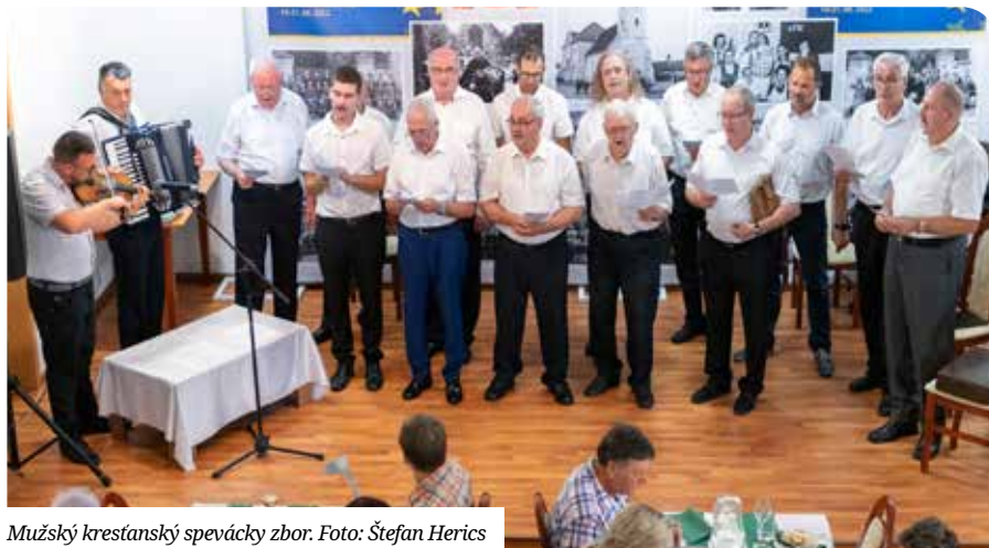
Mužský kresťanský spevácky zbor.

Ez a mottója a férfi egyházi énekkarnak, mely immár több mint 50 éve működik Szencon a magyar katolikus közösség mellett. Küldetésünk célja a hit, remény és szeretet egységének az erősítése, valamint nemzeti értékeink ápolása, életben tartása.