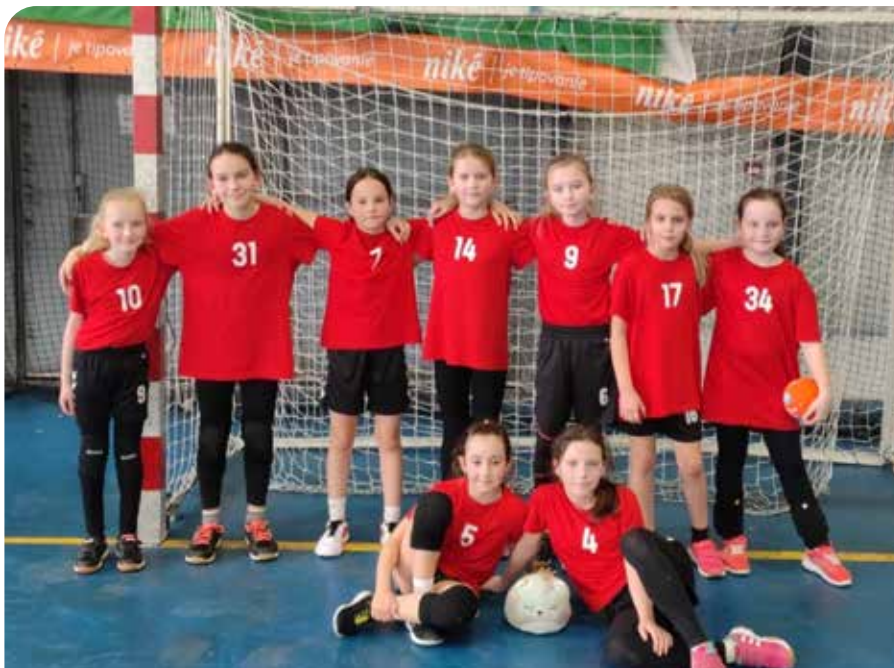
1. 4. na Hádzanárskom turnaji prípravka 6+1 dievčatá sú dievčatá SPORT CLUBU Senec na 4. mieste tabuľky BKZhá. (na obrázku) Na hádzanárskom turnaji mladších žiačok v Malackách 22.3. sa podarilo Senčankám poraziť družstvo SLOVAN MODRA, ale nestačili na STROJÁR Malacky. V SKUPINE C celoslovenskej súťaže mladších žiačok sú na 3. mieste.