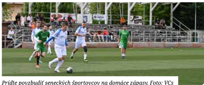
Príďte povzbudiť seneckých športovcov na domáce zápasy.

18.3.2023 Levy SC – BK Nové Mesto n/Váhom 98 - 38 19.3.2023 Levy Senec – BK AS Trenčín 83 - 59