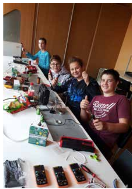
Technológie vedia byť zábavné.

V rámci eventu budú prebiehať interaktívne ukážky pod dozorom skúsených pedagógov, či doktorandov vysokých škôl. Deti budú experimentovať s chémiou a fyzikou pomocou virtuálnej reality, nahliadnu aj do sveta anatómie. Budú