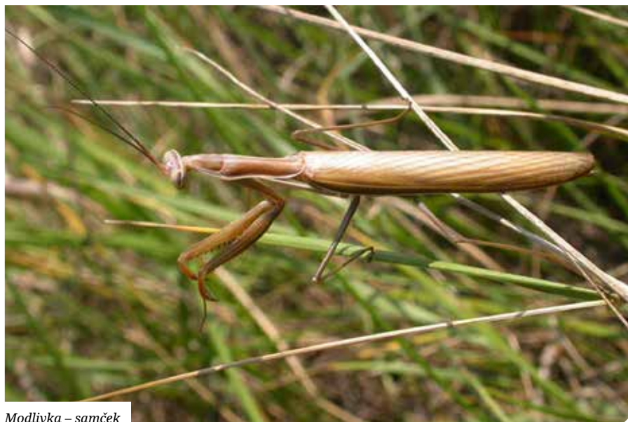
Modlivka – samček