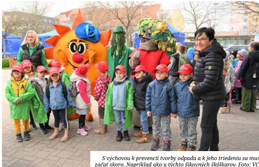
S výchovou k prevencii tvorby odpadu a k jeho triedeniu sa musí začať skoro. Napríklad ako u týchto šikovných škôlkarov.

Deti sa počas Dňa Zeme naučili, aké firmy sa starajú o odvoz odpadu, videli videá v mini kine, kde sa dozvedeli, ako sa má správne triediť či aký je priebeh spracovania odpadu. Naučili sa, ako sa starať o oblečenie a tak predchádzať vzniku textilného