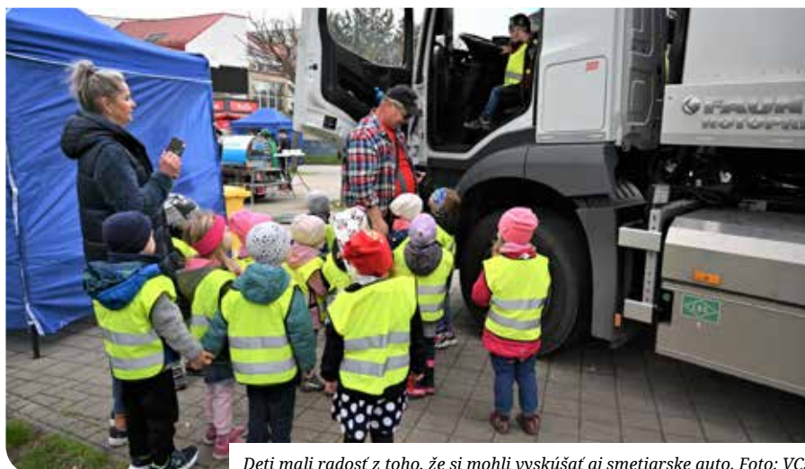
Deti mali radosť z toho, že si mohli vyskúšať aj smetiarske auto.