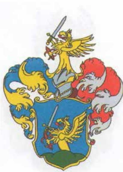
Erb rodu Gál