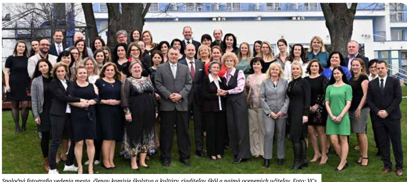
Spoločná fotografia vedenia mesta, členov komisie školstva a kultúry, riaditeľov škôl a najmä ocenených učiteľov.

Plánované domáce zápasy a výsledky niektorých našich športových klubov. (str. 27)