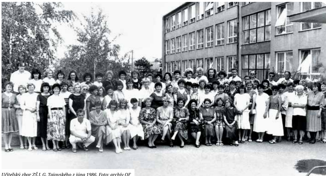
Učiteľský zbor ZŠ J. G. Tajovského z júna 1986.

žiakov, 102 učiteľov, 20 zamestnancov. Toto ohromné číslo bolo hlavným dôvodom pre uvažovanie o rozšírení kapacít školstva v Senci. Najprv sme začali prístavbou, ktorú realizoval OSP Pezinok. Bola to rekordná stavba – 1. mája sa kopal a 1. septembra sa učilo. Najdôležitejším dôvodom bolo, že sme nutne potrebovali kotelňu.