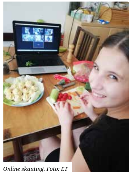
Online skauting.

Zapojili sme sa aj do potravinovej zbierky, ktorú organizovala Charita Senec spolu s Tescom. V rámci Slovenského skautingu stále funguje skautská služba, kde sa mnohí zapojili aj pri celoplošných testovaniach ako dobrovoľníci. Pre starších (rangerov/