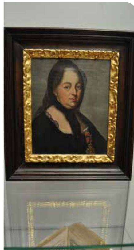
Portrét panovníčky Márie Terézie v zbierkach Mestského múzea v Senci.

V období osvietenstva došlo k snahám zreformovať jednotlivé oblasti spoločnosti, ktoré v dobových podmienkach už neboli schopné zabezpečiť očakávaný rozvoj štátu ako takého. Zároveň sme svedkami snáh integrovať jedinca ako súčasť istej sociálnej skupiny s maximálnym využitím jeho schopností pre potenciál rozvoja krajiny. Bránou do vstupu mysle, formovania vedomia a schopností jednotlivca bola z hľadiska štátu cirkev a prostredníctvom nej škola. Aj v podmienkach Rakúskej monarchie bola cirkev jednou z dôležitých sfér šírenia štátneho záujmu. K tomuto šíreniu mali poslúžiť aj reformné úsilie smerujúce k postupnému vytvoreniu školského systému, pozostávajúceho z rôznych, na seba nadväzujúcich typov škôl podliehajúcich štátnej kontrole. Došlo pri tom neraz k obmedzeniu dovtedy zohraných cirkevných úloh, inokedy však k podpore činnosti vybraných reholí v štátom odobrených, či dokonca v ním zriadených školských zariadeniach. Príkladom môže byť viedenská škola piaristov, ale aj senecké Collegium Oeconomicum ponúkajúce možnosti získania vyššieho, špecifikovaného vzdelania. Aj tieto mali byť prvými „dielňami“ pre produkciu ideálnych občanov priamo využiteľných v štátnych úradoch.