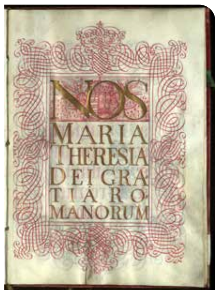
Titulná strana zakladacej listiny seneckého kolégia Collegium Oeconomicum z roku 1763, vydanéj v mene panovníčky Márie Terézie

V roku 1776 sa tragicky skončila história prvej vyššej školy zameranej predovšetkým na vyučovanie tzv. kamerálnych vied.