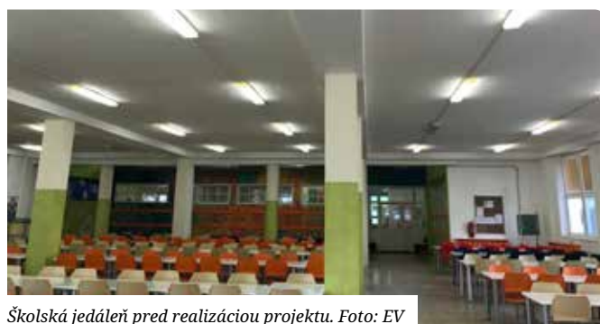
Školská jedáleň pred realizáciou projektu.