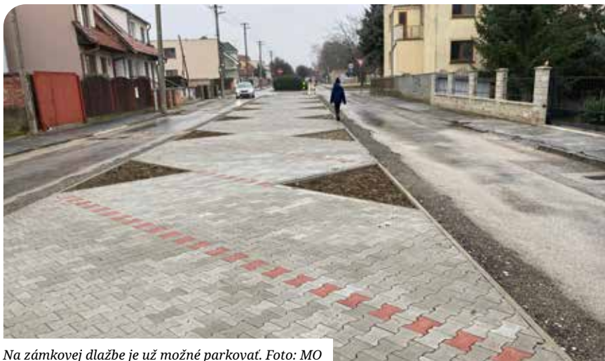
Na zámkovej dlažbe je už možné parkovať.