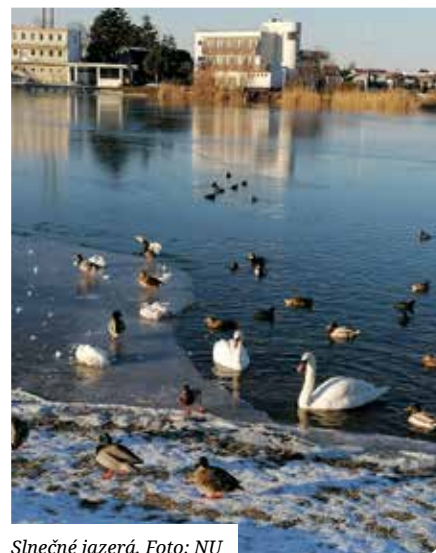
Slnecné jazerá.