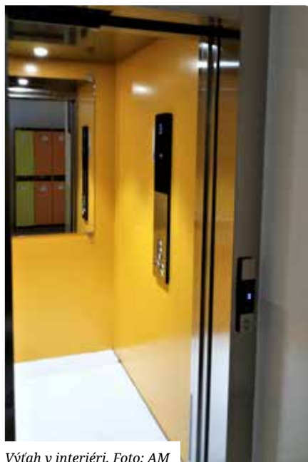
Výťah v interiéri.

Zistilo sa, že celá kanalizácia je nefunkčná s prasknutými a zlomenými časťami potrubia, odsadenými spojmi, lapač tukov je zanesený a nefunkčný, jestvujúce šachty potrebovali opraviť. Mesto muselo