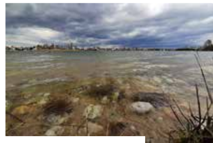
Na hladine 2.

Aj keď sa život ešte stále nevrátil do pôvodných kolají, nemôžeme zatiaľ chodiť na výstavy, či inak sa kultúrne vyžiť, môžeme však zapojiť svoju tvorivosť a prihlásiť svoje diela do rôznych súťaží. Môžete si vybrať podľa svojich záujmov a koníčkov. Môžete fotiť, písať či maľovať. Tvorivosti sa medze nekladú a vytvorené diela prinášajú pocit uspokojenia. Ak by to neslačilo, víťazov čakajú aj pekné ceny.