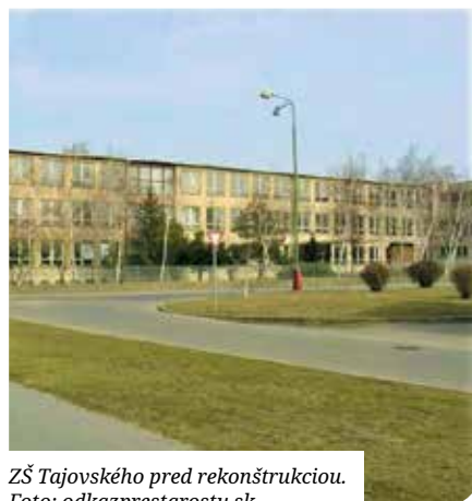
ZŠ Tajovského pred rekonštrukciou.