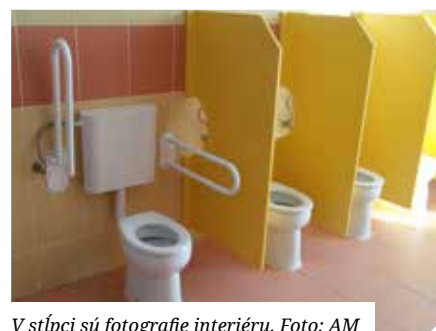
V stĺpci sú fotografie interiéru.