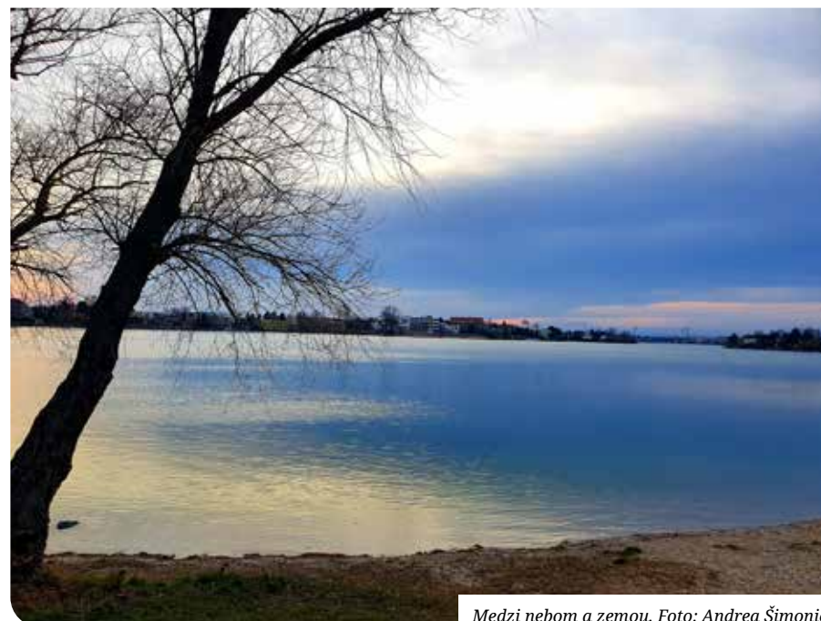
Medzi nebom a zemou.

si vyhradil právo zo súťaže vyradiť fotografie, ktoré nespĺňajú základné technické, umelecké, morálne a etické predpoklady alebo nesúvisia so zadanou témou. Súťaž sa nemôžu zúčastniť zamestnanci organizátora. Súťaže sa môže zúčastniť každá fyzická osoba. Osoba mladšia ako 15 rokov len v prípade, že bude pri podpise