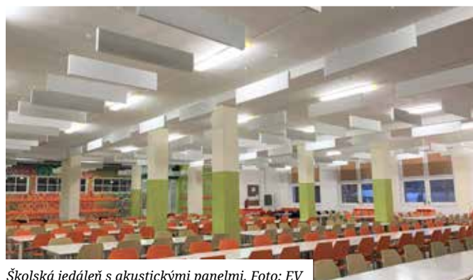
Školská jedáleň s akustickými panelmi.