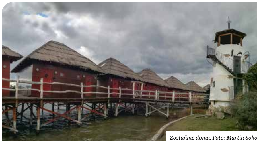
Zostaňme doma.