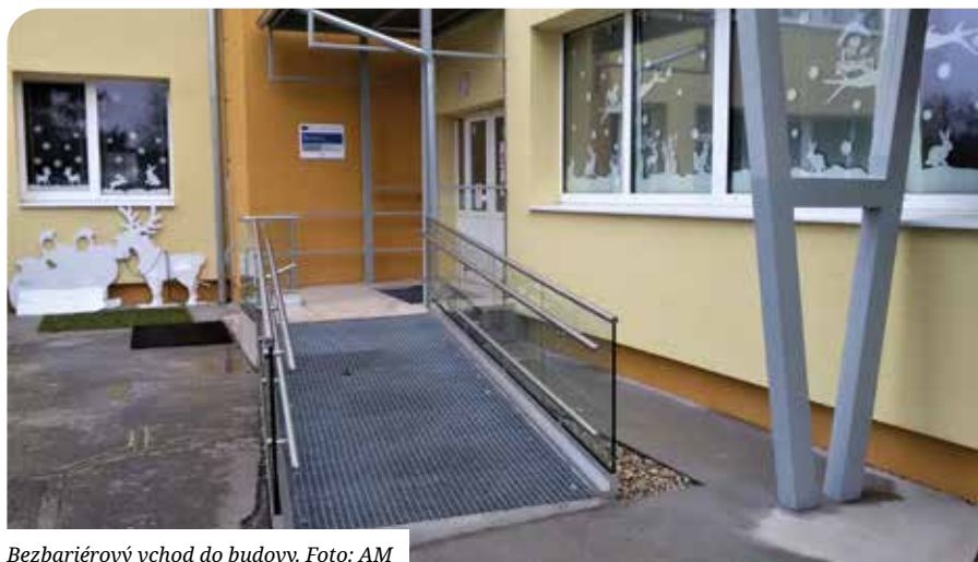
Bezbariérový vchod do budovy.

prístup ku kompletnej výmene všetkých poškodených ležatých rozvodov kanalizácie a lapača tukov. Tieto práce boli spojené s potrebou ďalších nečakaných vyvolaných investícií spojených okrem iného s opätovnou obnovou podláh v sanovaných priestoroch budovy, povrchových úprav stien a stropov, opravou časti poškodených vodovodných rozvodov, väčšiemu rozsahu spevnenia podlažia pod priečkami, opravou a stabilizáciou základových