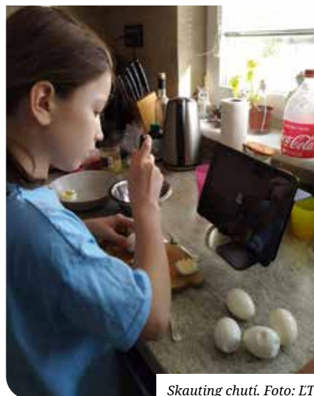
Skauting chutí.

oldskautov...) pravidelne prebiehajú online diskusie cez Skautský inštitút so zaujímavými hosťami na rôzne témy (napr. médiá, radikalizácia, občiansky aktivizmus či životné prostredie... ale aj o tom, ako s týmito témami ďalej pracovať v rámci osobného rozvoja, alebo pri činnosti s deťmi a mládežou). Aj vzdelávanie nových vodcov a radcov sa prenieslo do online sveta. Dve z našich vodkýň takto dokončili svoju Lesnú školu. Momentálne sa pripravujeme na letný tábor, ktorý sa, dúfam, bude môcť uskutočniť.