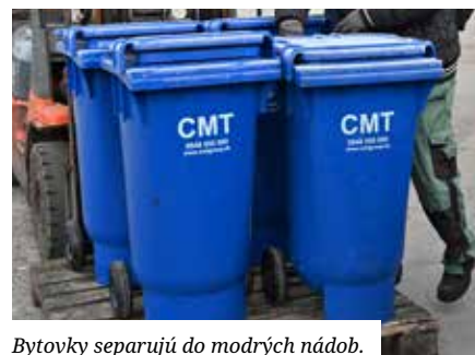
Bytovky separujú do modrých nádob.

V prípade, že niektoré bytové domy nie sú vybavené týmito nádobami, ich obyvatelia môžu kontaktovať príslušný útvar MsÚ na odpady@senec.sk .