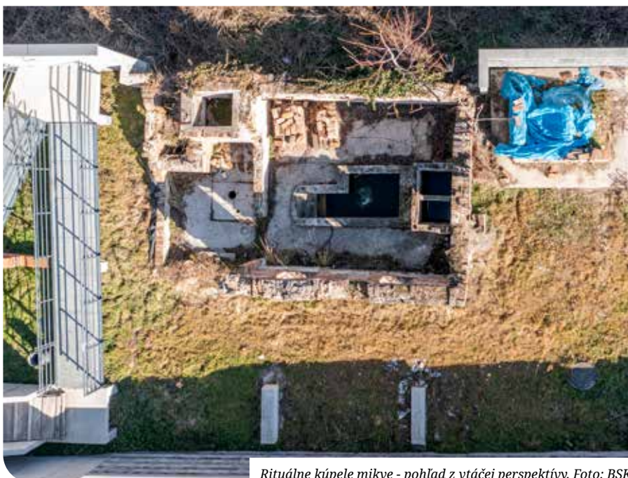
Rituálne kúpele mikve - pohľad z vtáčej perspektívy.

Synagóga bude rozširovať kultúrnu ponuku pre obyvateľov mesta Senec, ale aj celého bratislavského regiónu. Program