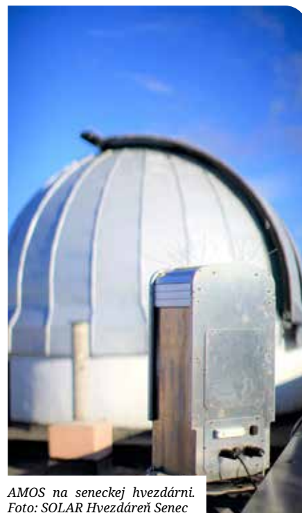
AMOS na seneckej hvezdárni.

Každá kamera AMOS zaznamená približne 10 - 20 tisíce meteorov ročne v závislosti od polohy a podmienok pozorovania. Okrem toho pozoruje aj približne 50 svetelných javov v atmosfére.