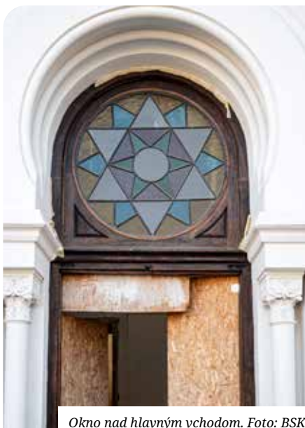
Okno nad hlavným vchodom.