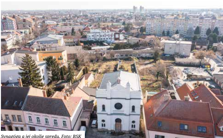
Synagóga a jej okolie spredu.