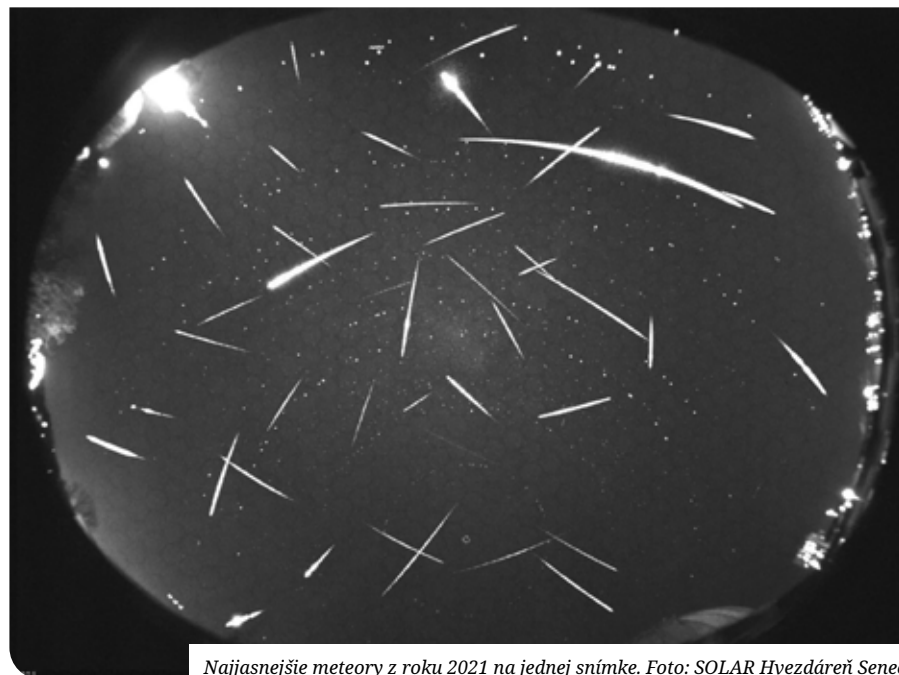
Najjasnejšie meteory z roku 2021 na jednej snímke.

V rámci Slovenska sú kamery zapojené v sieti na výpočet polohy meteorov alebo meteorických rojov. Kamery v zahraničí fungujú v pároch a sú od seba vzdialené vzdušnou čiarou približne 100 - 150 km.