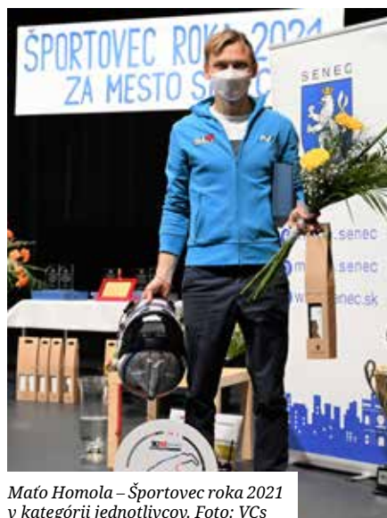
Maťo Homola – Športovec roka 2021 v kategórii jednotlivcov.