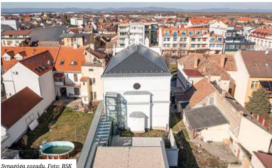
Synagóga zo zadu.