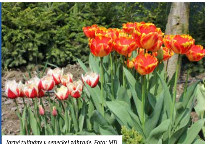
Jarné tulipány v seneckej záhrade.

Materiály na zasadnutie sa zverejňujú na www.senec.sk a zasadnutie sa bude online vysielat na www.zastupitelstvo.sk