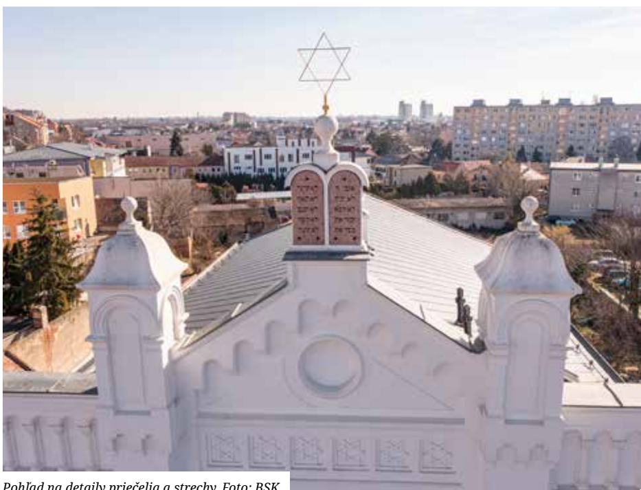
Pohľad na detaily priečelia a strechy.