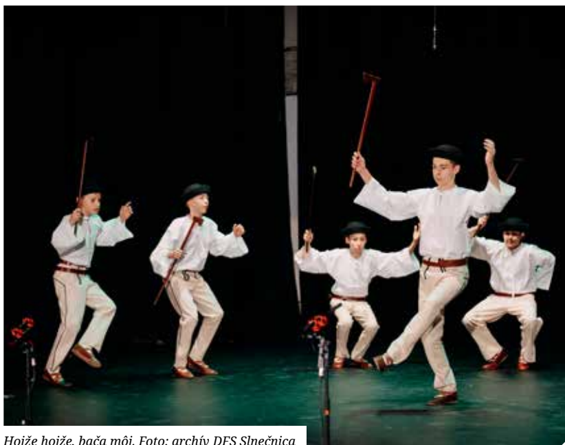
Hojže hojže, bača môj.