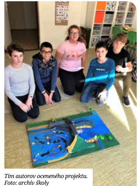
Tím autorov oceneného projektu.