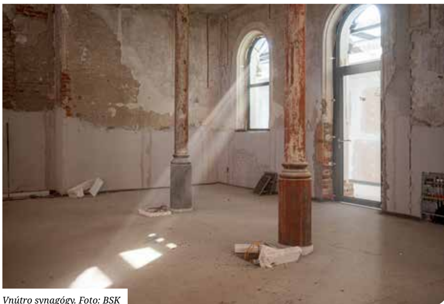
Vnútro synagógy.