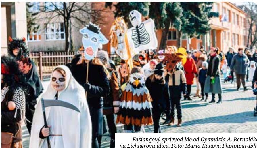
Fašiangový sprievod ide od Gymnázia A. Bernoláka na Lichnerovu ulicu.