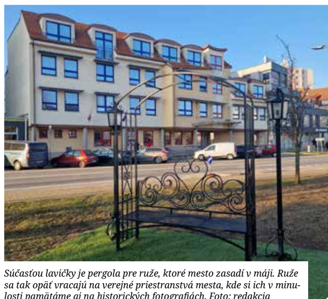
Súčasťou lavičky je pergola pre ruže, ktoré mesto zasadí v máji. Ruže sa tak opäť vracajú na verejné priestranstvá mesta, kde si ich v minulosti pamätáme aj na historických fotografiách.