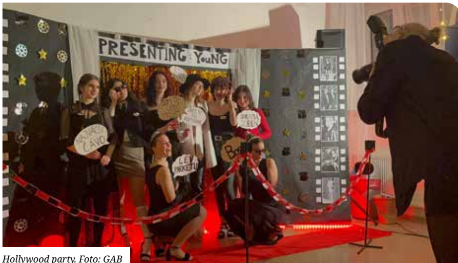
Hollywood party.

Prvú akciu firma YouNG zorganizovala koncom januára. Počas piatkového večera sa školou premávali celosvetové hviezdy na Hollywood party. Keď celebrity vkročili na červený koberec ich snov, mali šancu vidieť nádherné dekorácie, na ktorých si dali členovia firmy naozaj záležať. Čakalo na nich skvelé občerstvenie formou bufetového stola, pestrý program, kvalitná hudba a súťaže. Hlavným cieľom však v tento večer mala byť predovšetkým dobrá zábava. Študenti od prímý až