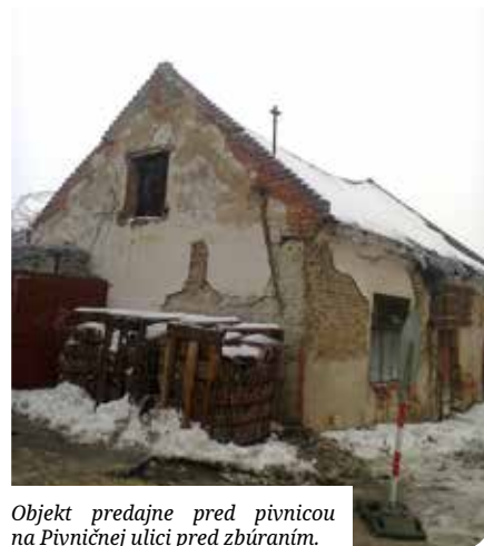
Objekt predajne pred pivnicou na Pivničnej ulici pred zbúraním.