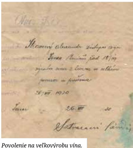
Povolenie na veľkovýrobu vína.