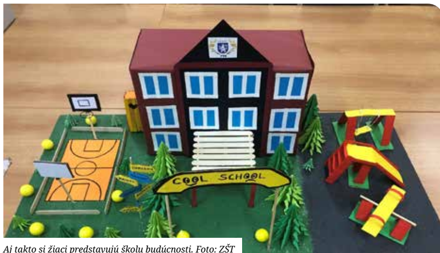
Aj takto si žiaci predstavujú školu budúcnosti.

Od slov prešli k činom a počas štyroch týždňov sa fantázie žiakov pretavili do skutočnosti a vytvorili unikátne modely moderných škôl podľa vlastných predstáv. Nás teší, že okrem rôznych športových areálov, oddychových detských kútikov, súčasťou ich projektov boli aj moderné priestory pre knižnice, eko-školy