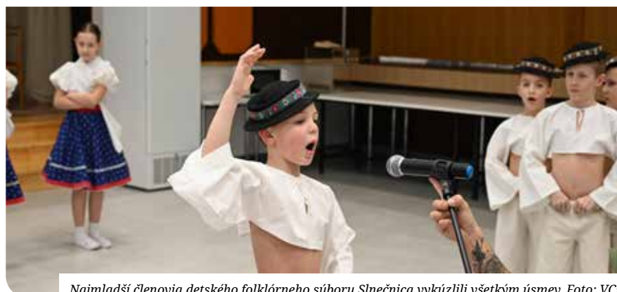
Najmladší členovia detského folklórneho súboru Slniečnica vykúzlili všetkým úsmev.