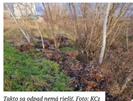
Takto sa odpad nemá riešiť.