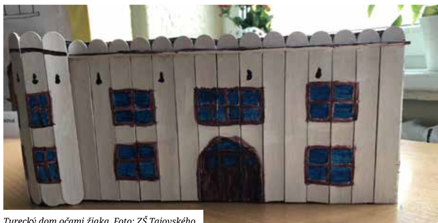
Turecký dom očami žiaka.