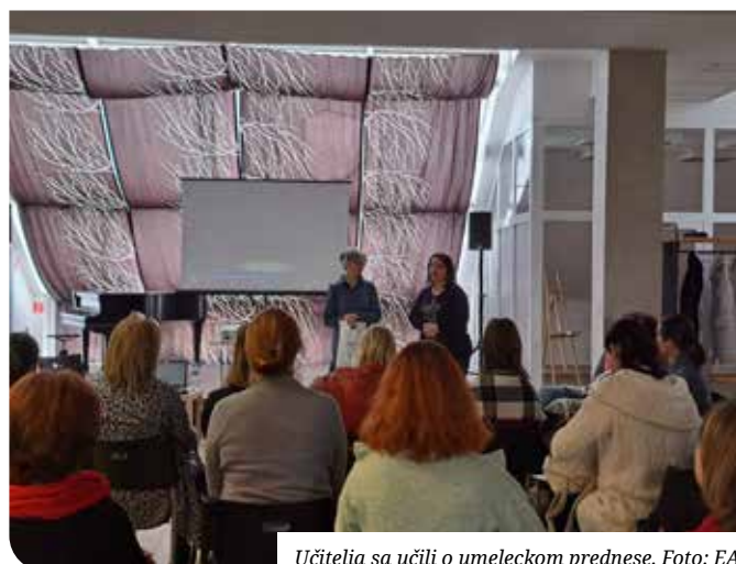
Učitelia sa učili o umeleckom prednese.