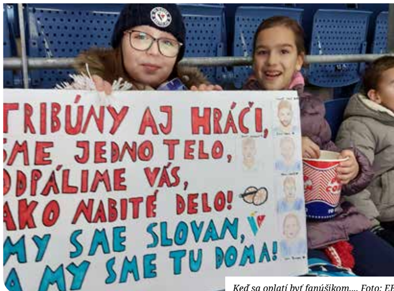
Keď sa oplati byť fanúšikom....