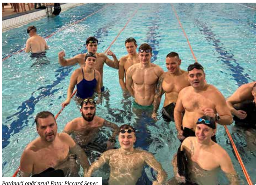
Potápači opäť prví!