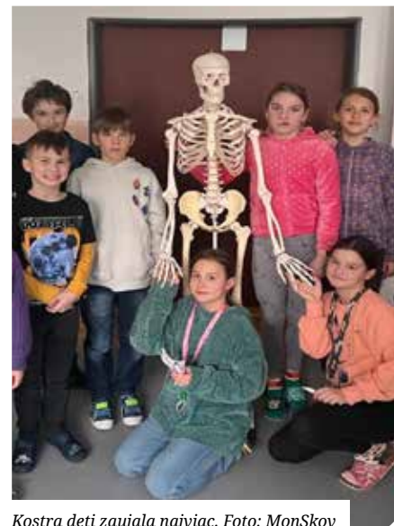
Kostra deti zaujala najviac.