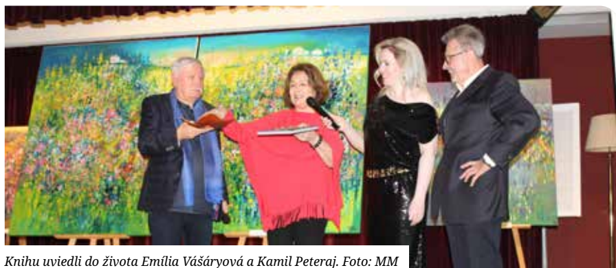
Knihu uviedli do života Emília Vášáryová a Kamil Peteraj.