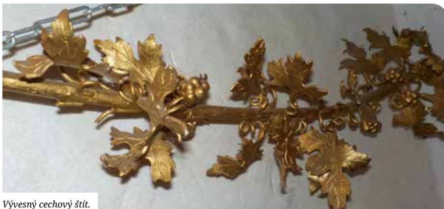
Vývesný cechový štít.