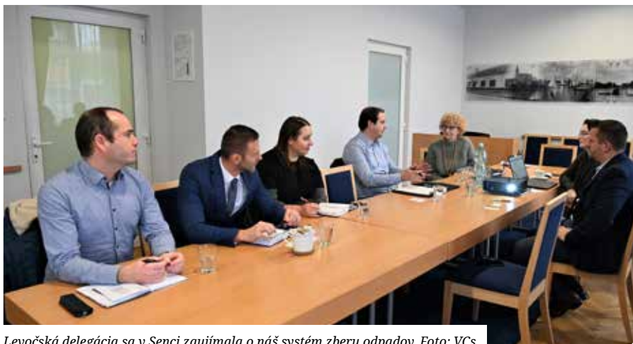
Levočská delegácia sa v Senci zaujímala o náš systém zberu odpadov.