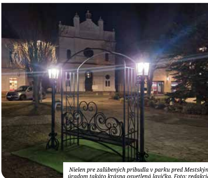
Nielen pre zalúbených pribudla v parku pred Mestským úradom takáto krásna osvetlená lavička.