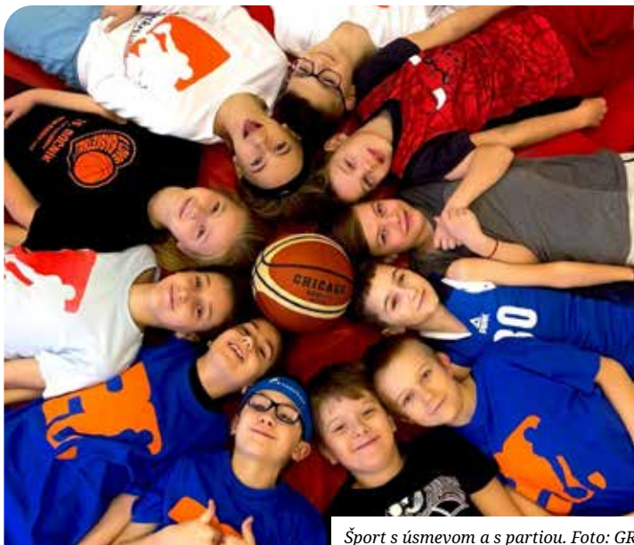
Šport s úsmevom a s partiou.