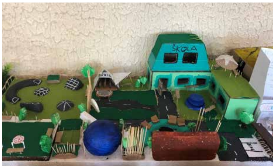
Vela priestoru, možnosti športovania a zeleň – tak má podľa detí škola vyzerat.