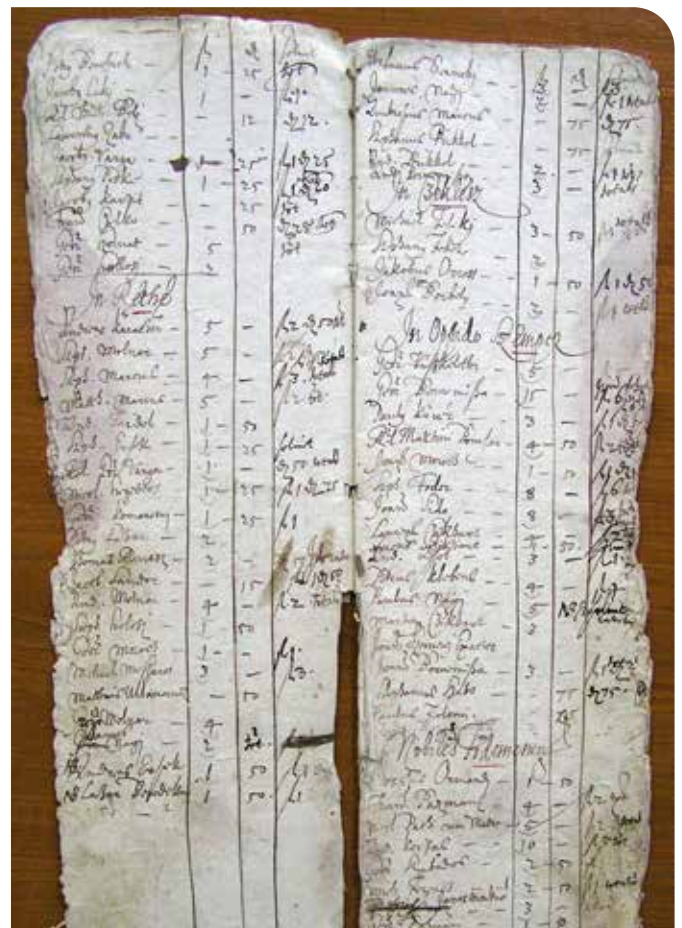
Súpis taxalistov z roku 1650 (Reca, Bernolákovo, Senec, Pusté Úľany).