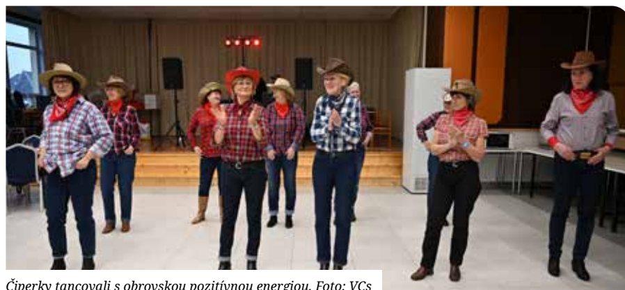
Čiperky tancovali s obrovskou pozitívnou energiou.