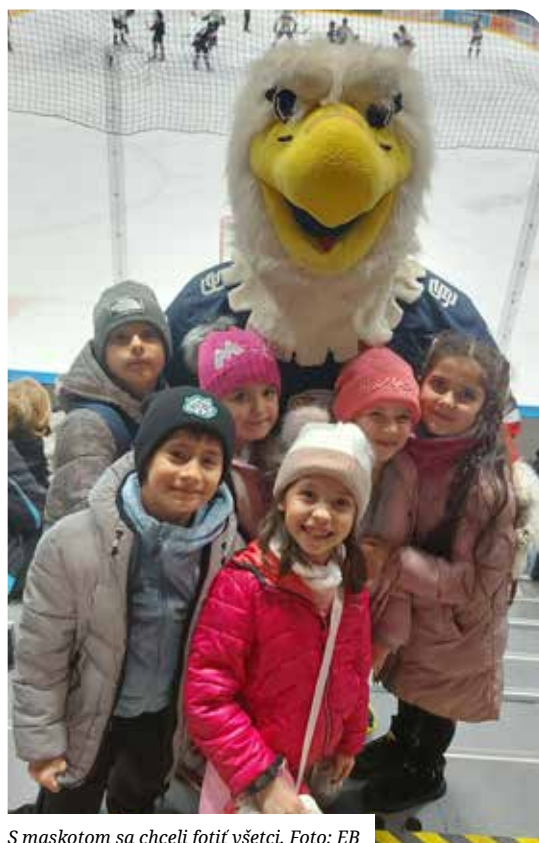
S maskotom sa chceli fotiť všetci.