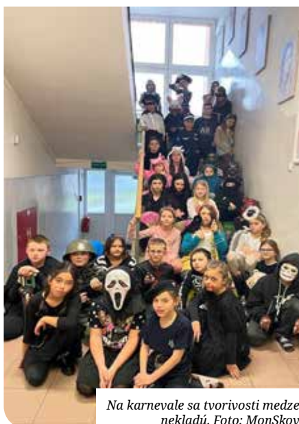
Na karnevale sa tvorivosti medze nekladú.