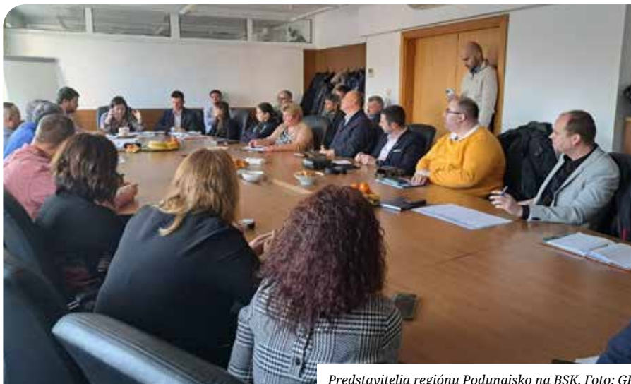
Predstavitelia regiónu Podunajsko na BSK.