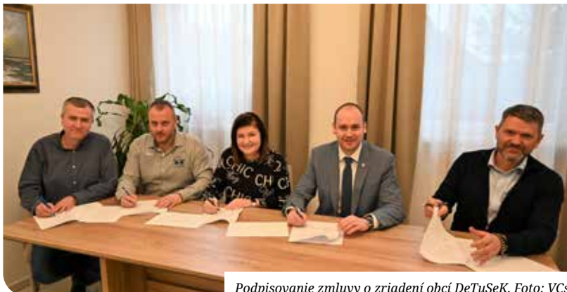
Podpisovanie zmluvy o zriadení obcí DeTuSeK.