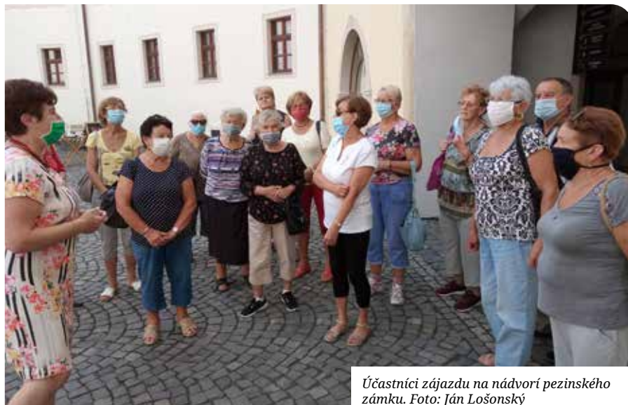
Účastníci zájazdu na nádvorí pezinského zámku.