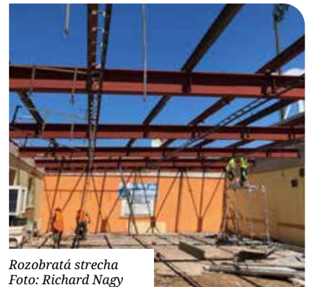
Rozobratá strecha

Celú opravu zabezpečovala firma Tili-co s.r.o., inštaláciu podhladov a maľovku IN REAL, spol. s r.o. Práce prebiehali v júli až auguste. Pri odstraňovaní pôvodnej strešnej krytiny sa zistilo, že prepadnutie strechy z dôvodu prehrdzavenia hrozilo na viacerých miestach. Počas výmeny bola pôvodná strecha úplne odstránená, a preto došlo počas tohto obdobia niekoľkokrát