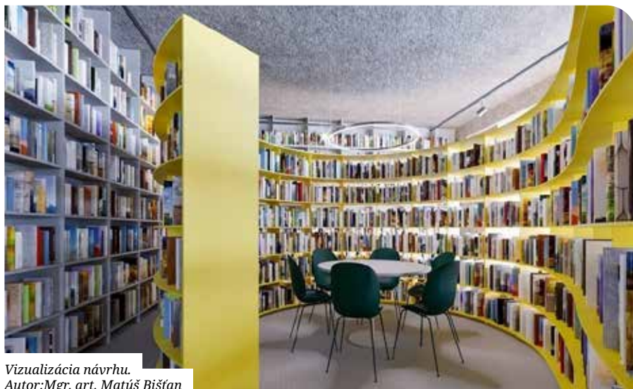
Vizualizácia návrhu. Autor: Mgr. art. Matúš Bišťan

Anetta Zelmanová Vedúca mestskej knižnice