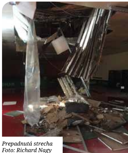
Prepadnutá strecha

Druhého júna pri príchode na tréning stolného tenisu čakalo všetkých prítomných nepríjemné zistenie resp. šok z pohľadu, ktorý sa nám naskytl pri otvorení stolnotenisovej haly. Na jednom mieste bola úplne prepadnutá strecha v šírke asi 2,5 metra a v dĺžke cca 5 metrov. Našťastie v hale v čase prepadu strechy nikto nebol a strecha prepadla na mieste, kde sa nenachádzali ani stoly či iné vnútorné zariadenia. Stolnotenisová hala je v areáli futbalového štadióna, ide o budovu starej tribúny. Na prízemí sú priestory a šatne futbalového klubu a na poschodí stolnotenisová hala.