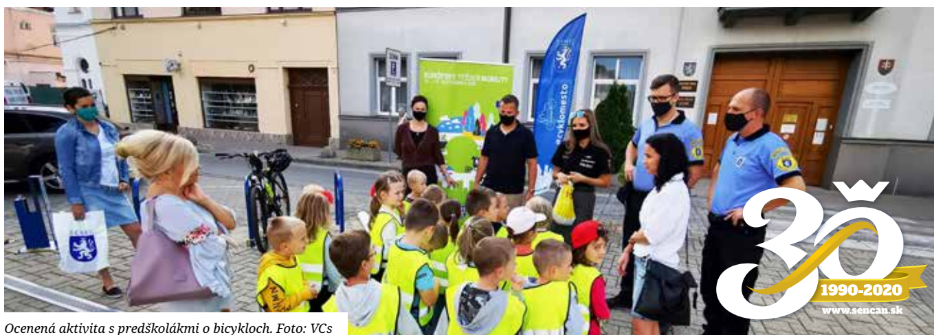
Ocenená aktivita s predškôlkami o bicykloch.