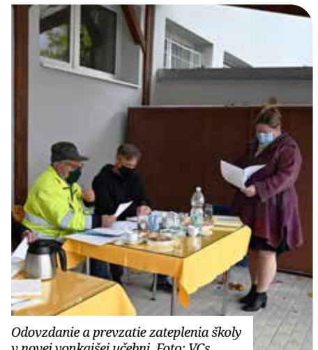
Odovzdanie a prevzatie zateplenia školy v novej vonkajšej učebni.