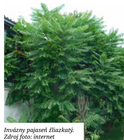
Invázny pajasen žliazkatý.