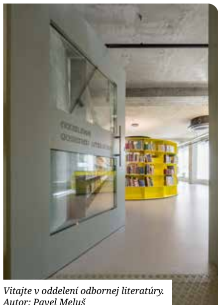
Vitajte v oddelení odbornej literatúry. Autor: Pavel Meluš