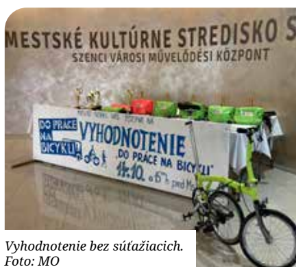
Vyhodnotenie bez súťažiach.

Ako samospráva sme sa dostali do TOP 10 a porazili sme také cyklomestá ako sú Trnava, či Galanta. Do kampane za samosprávu Senec sa v roku 2020 zapojilo celkom 37 tímov (naš predchádzajúci rekord bolo 48 tímov), celkový počet registrovaných účastníkov bol 131 (doterajší rekord je 151), spolu sme najazdili 8.714,95 km, čo je o 1.500 km viac ako v predchádzajúcej kampani (7.147 km), ušetrili sme 2.478,30