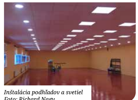
Inštalácia podhladov a svetiel