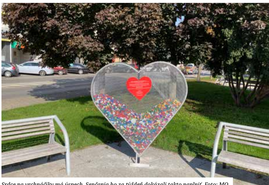
Srdce na vrchnáčiky má úspech, Senčania ho za týždeň dokázali takto naplniť.