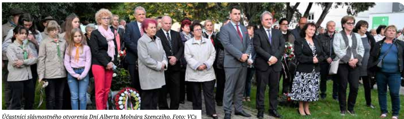
Účastníci slávnostného otvorenia Dní Alberta Molnára Szencziho.

A tavalyi járványhelyzetben csak két kültéri esemény valósulhatott meg a Szenczi Molnár Albert Napok programjából. Idén kedvezőbb a helyzet és a lapzártáig betervezett események megvalósultak.