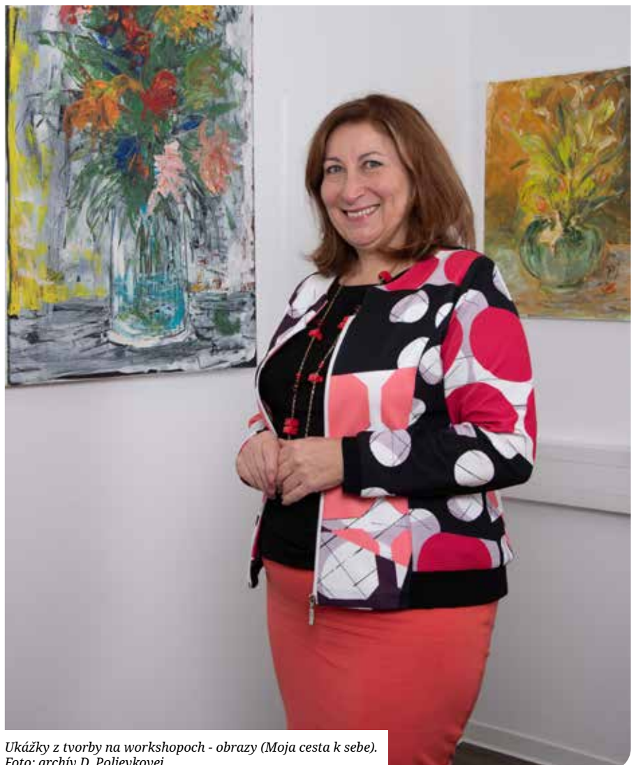
Ukážky z tvorby na workshopoch - obrazy (Moja cesta k sebe).