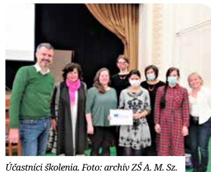
Účastníci školenia.