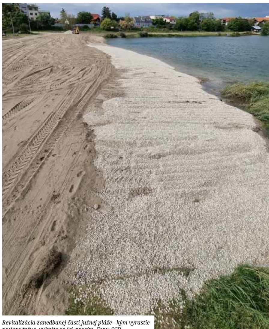
Revitalizácia zanedbanej časti južnej pláže - kým vyrastie zasiať tráva, vyhňte sa jej, prosím.