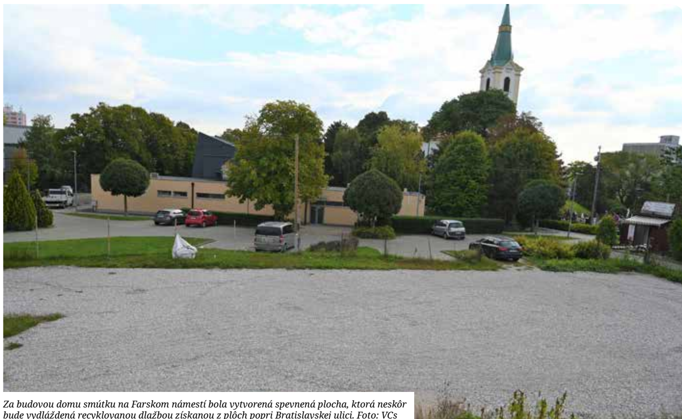
Za budovou domu smútku na Farskom námestí bola vytvorená spevnená plocha, ktorá neskôr bude vydláždená recyklovanou dlažbou získanou z plôch popri Bratislavskej ulici.