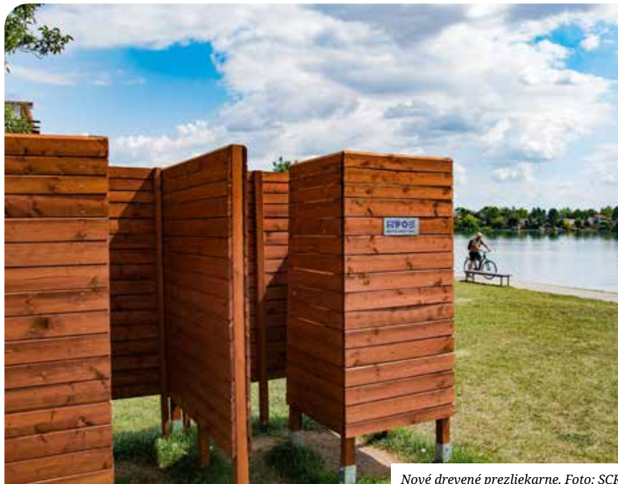
Nové drevené prezliarkarne.