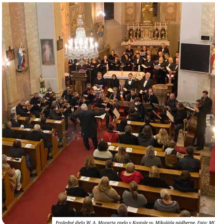
Posledné dielo W. A. Mozarta znelo v Kostole sv. Mikuláša nádherne.