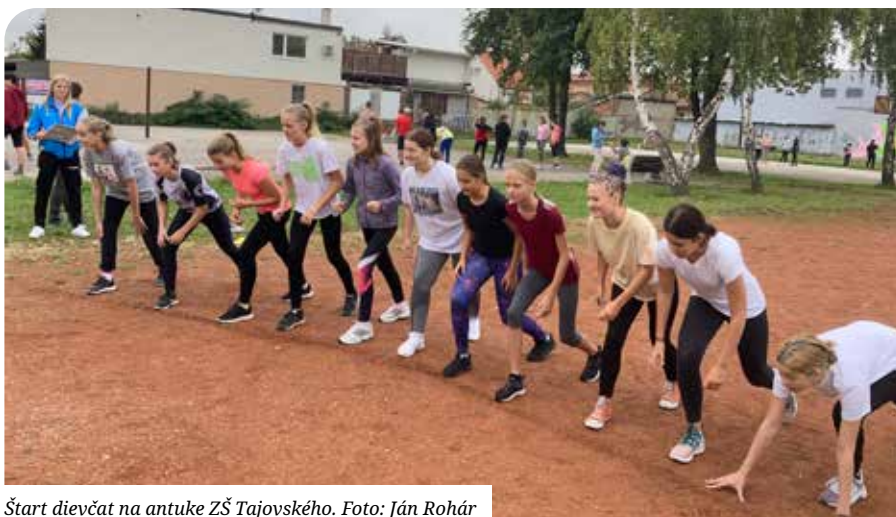
Štart dievčat na antuke ZŠ Tajovského.