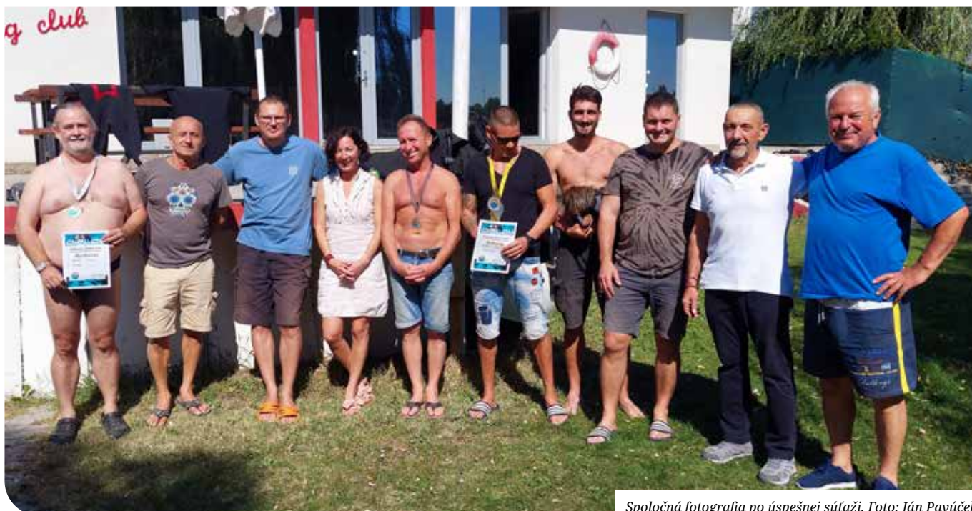
Spoločná fotografia po úspešnej súťaži.