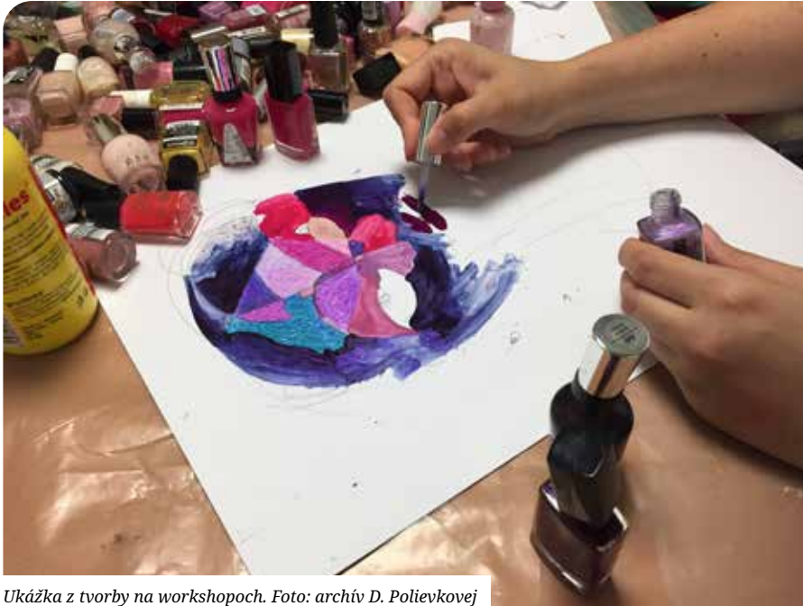
Ukážka z tvorby na workshopoch.

osobnosť a priniesť mu pocit zmysluplného života. Ľudia sú unavení zo slov. Tie im pri vyjadrovaní toho, čo sa aktuálne v ich živote deje, niekedy zavádzajú. Vtedy nepomáha, že som skúsený manažér a viem ako systém (ne)funguje. V takýchto prípadoch viem podporiť klienta inak a viem nedirektívne prejsť z verbálnej roviny na neverbálny dialóg. Teda od (niekedy zbytočných) rečí k tvorbe.