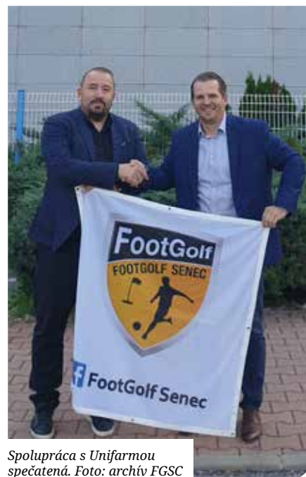
Spolupráca s Unifarmou spečatená.