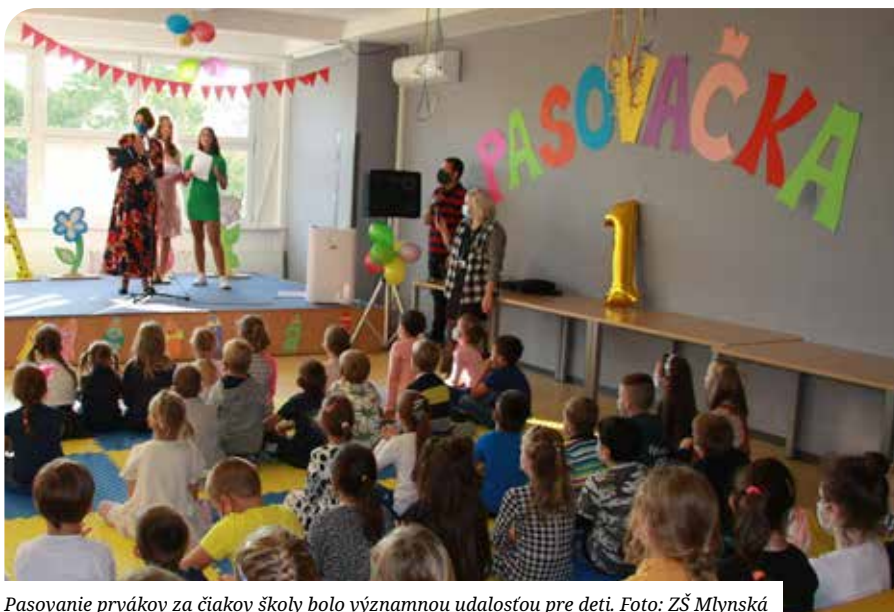
Pasovanie prvákov za čiaikov školy bolo významnou udalosťou pre deti.