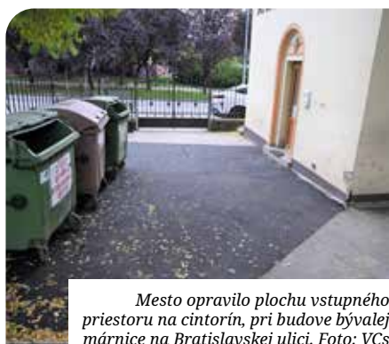
Mesto opravilo plochu vstupného priestoru na cintorín, pri budove bývalej márnice na Bratislavskej ulici.