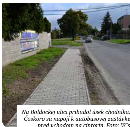
Na Boldockej ulici pribudol úsek chodníka. Čoskoro sa napojí k autobusovej zastávke pred vchodom na cintorín.