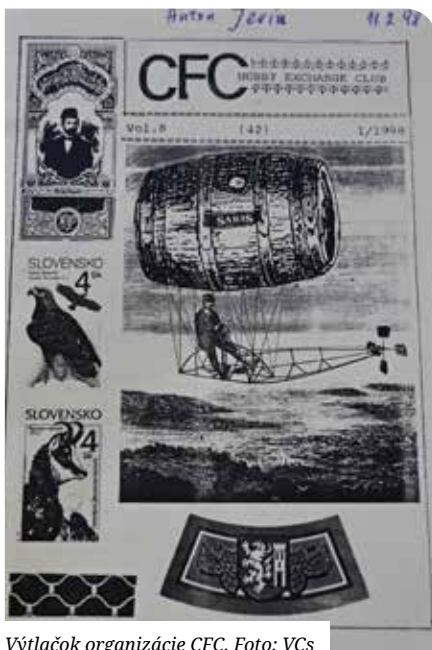
Výtlačok organizácie CFC.