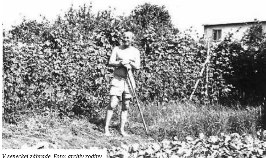
V seneckej záhrade.