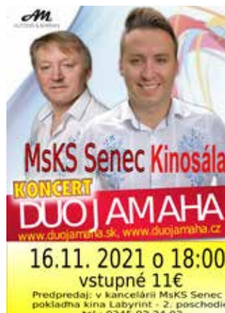
16.11. DUO JAMAHA