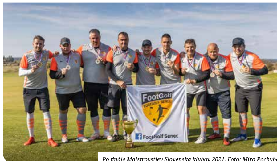
Po finále Majstrovstiev Slovenska klubov 2021.

Veľkým úspechom pre klub v tomto roku je podpísanie spolupráce s novým generálnym partnerom klubu, ktorým sa stala spoločnosť UNIPHARMA. Veľmi si vážime, že sme získali podporu, vďaka ktorej v budúcom roku plánujeme obnoviť našu ligu – Footgolf Unique League, ktorá sa bude hrať v Trnave a ktorá bude zameraná hlavne na juniorov a pre celé rodiny.