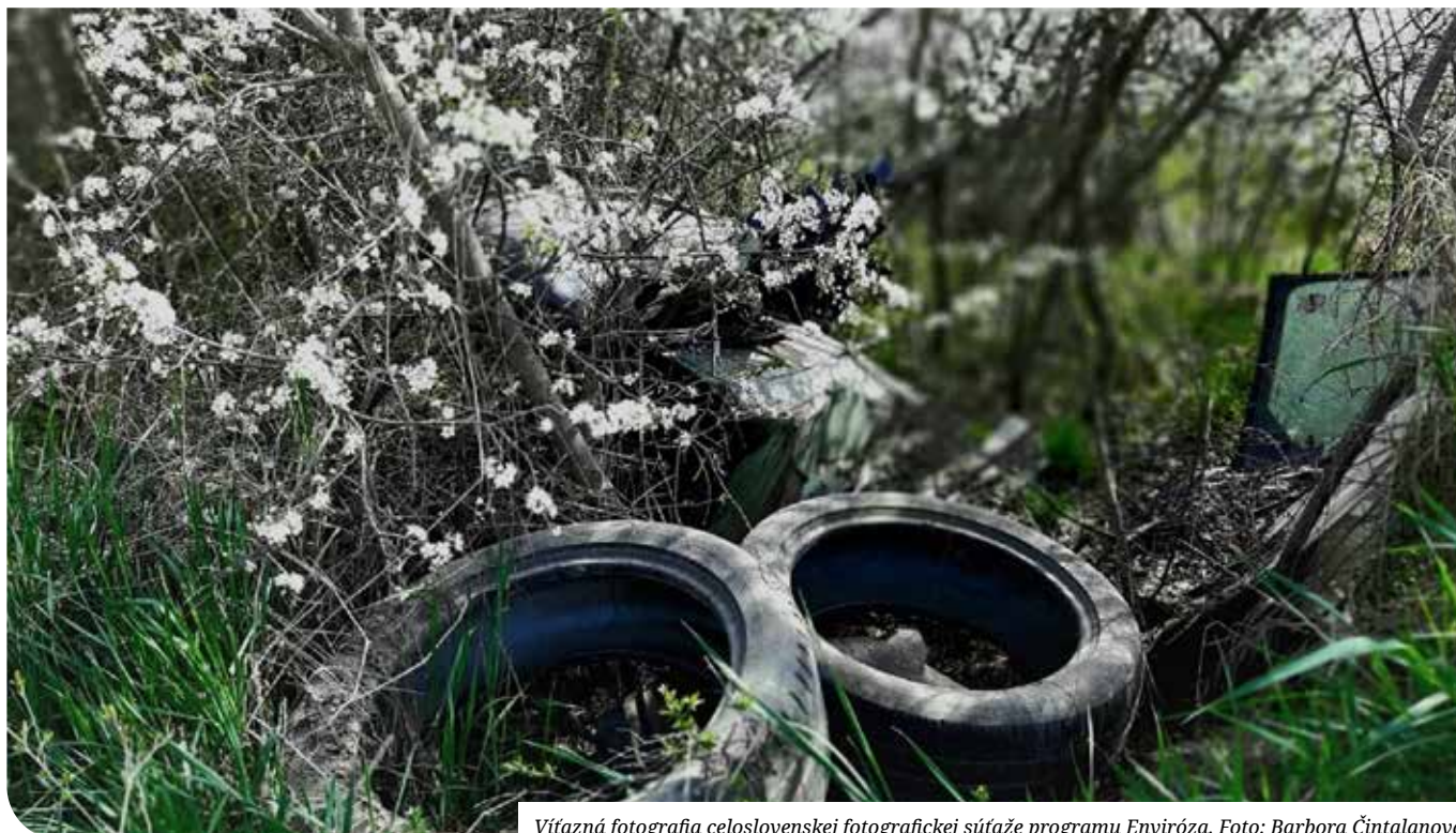
Vítaná fotografia celoslovenskej fotografickej súťaže programu Enviróza.