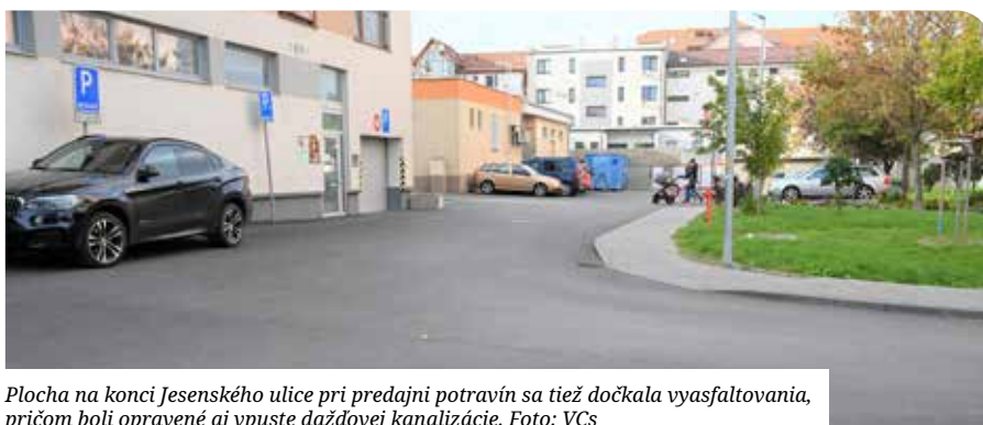
Plocha na konci Jesenského ulice pri predajni potravín sa tiež dočkala vyasfaltovania, pričom boli opravené aj vpuste dažďovej kanalizácie.