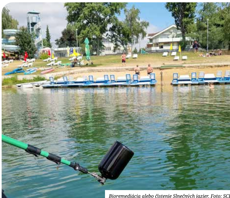
Bioremediácia alebo čistenie Slniečnych jazier.

O živote Ivana Dobrakova, Senčana a svetového matematika píše jeho dcéra. (str. 16-17)