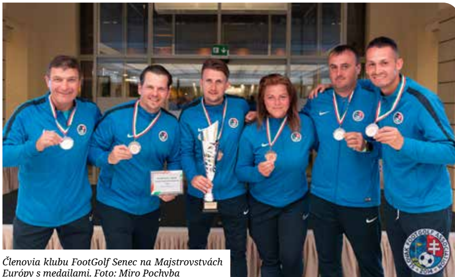
Členovia klubu FootGolf Senec na Majstrovstvách Európy s medailami.