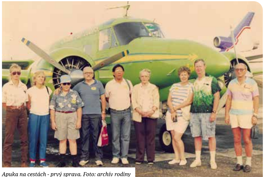
Apuka na cestách - prvý sprava.

Mama, ktorá je tiež matematicka, si spomína, že keď mal niečo vysvetliť študentom na Strojníckej fakulte, vysvetľoval im to spôsobom, akoby to hovoril svojim