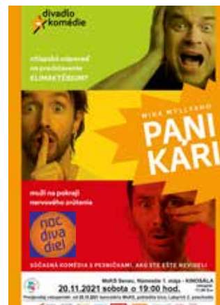
20.11. NOC DIVADIEL - Panikári