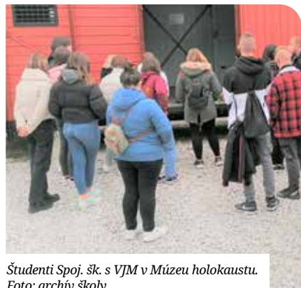
Študenti Spoj. šk. s VJM v Múzeu holokaustu.

Szakiskolánk elsős és másodikos diákjai 2021. október 15-én, Pozsony megye támogatását igénybe véve, ellátogattak a szeredi Holokausztmúzeumba, amely az egykori munkatábor területén jött létre.