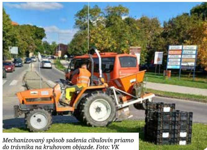
Mechanizovaný spôsob sadenia cibuľovín priamo do trávnik na kruhovom objazde.