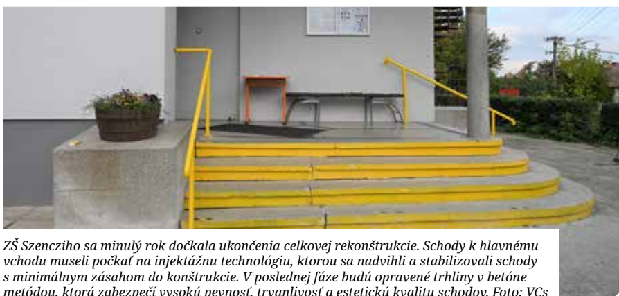
ZŠ Szencziho sa minulý rok dočkala ukončenia celkovej rekonštrukcie. Schody k hlavnému vchodu museli počkať na injektážnu technológiu, ktorou sa nadvihli a stabilizovali schody s minimálnym zásahom do konštrukcie. V poslednej fáze budú opravené trhliny v betóne metódou, ktorá zabezpečí vysokú pevnosť, trvanlivosť a estetickú kvalitu schodov.