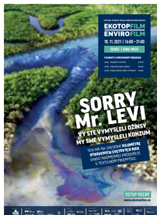
10.11. EKOTOPFILM ENVIROFILM