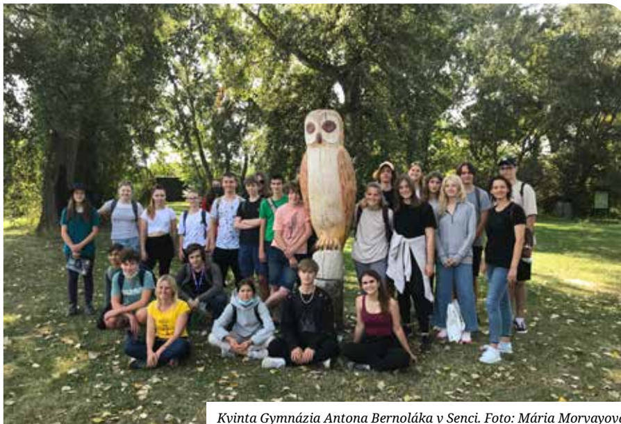
Kvinta Gymnázia Antona Bernoláka v Senci.

V to ráno sme už všetci s nadšením očakávali príchod autobusu. Každého potešilo, keď sme dostali balíčky s desiatou, ktoré spolu s väčšinou zásob zmizli nevýdanou rýchlosťou už počas cesty do našej prvej destinácie, pevnosti v Komárne. Napriek tomu, že regionálna história väčšinou nepatrí medzi priority mládeže, pán sprievodca si nás rýchlo získal vtipným a priateľským prístupom, pričom výklad obohatil trefnými poznámkami a kuriozitami, a tak nám priblížil dramatickú minulosť majestátnych múrov pevnosti. Súčasťou prehliadky bolo aj bludisko, kde si návštevníci môžu otestovať svoje orientačné