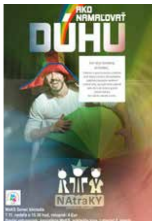
7.11. AKO NAMALOVAŤ DÚHU