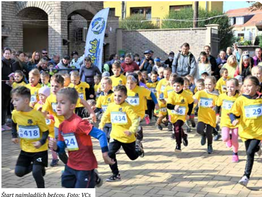
Štart najmladších bežcov.