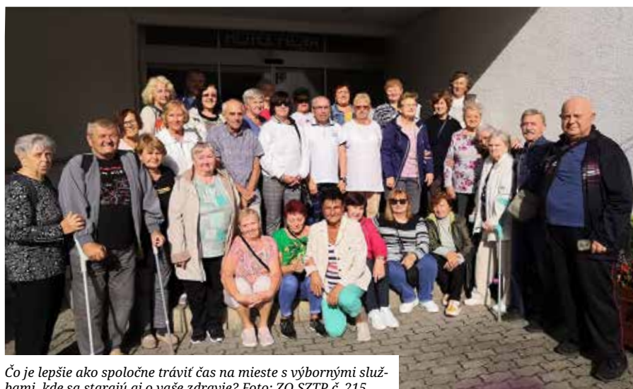
Čo je lepšie ako spoločne tráviť čas na mieste s výbornými službami, kde sa starajú aj o vaše zdravie?