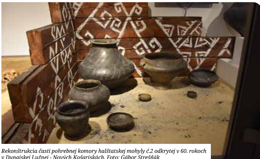
Rekonštrukcia časti pohrebnej komory halšatskej mohyly č.2 odkrytej v 60. rokoch v Dunajskej Lužnej - Nových Košariskách.

Po návrate z výstavnej miestnosti č. 2 do miestnosti 1 sa návštevník stretáva s úžitkovými predmetmi každodennosti z 19., resp. prelomu 19.-20. storočia. Okruh uzatvára veľkorozmerná vitrína venovaná obdobiu prvej svetovej vojny. Umiestnili sme sa tu aj rekonštrukciu uniformy vojaka 72. cisársko – kráľovského pešieho pluku, do ktorého rukovala značná časť mužov nášho regiónu. Zároveň tu prezentujeme aj viaceré trojrozmerné predmety a dokumenty pochádzajúce z osobných či rodinných pozostalostí Senčanov i obyvateľov okolitých obcí.