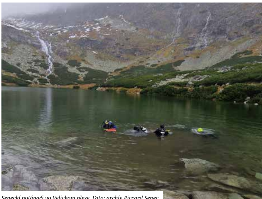
Senecí potápači vo Velickom plese.