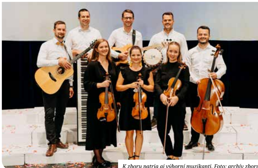
K zboru patria aj výborní muzikanti.

Na zbere sa mi páči, že každý z nás je dôležitý a prijatý taký, aký je. Zbor Radosť je moja veľká srdcová záležitosť. Ďakujem, že môžem byť súčasťou Radosť, že spolu dávame radosť, úsmev, pieseň, tanec, milé slová a to všetko na oslavu Boha.