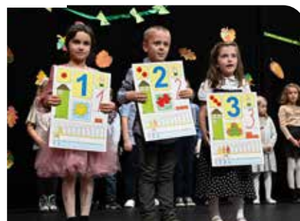
18.X. – Privítanie prváčikov ZŠ s VJM okresu Senec, program prváčikov ZŠ A.M.Sz. Senec.