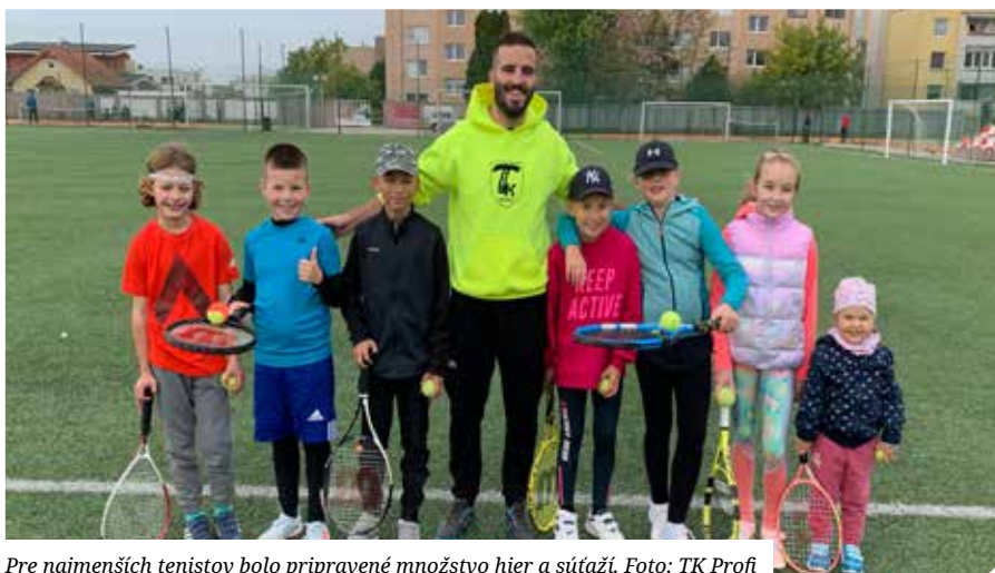
Pre najmenších tenistov bolo pripravené množstvo hier a súťaží.