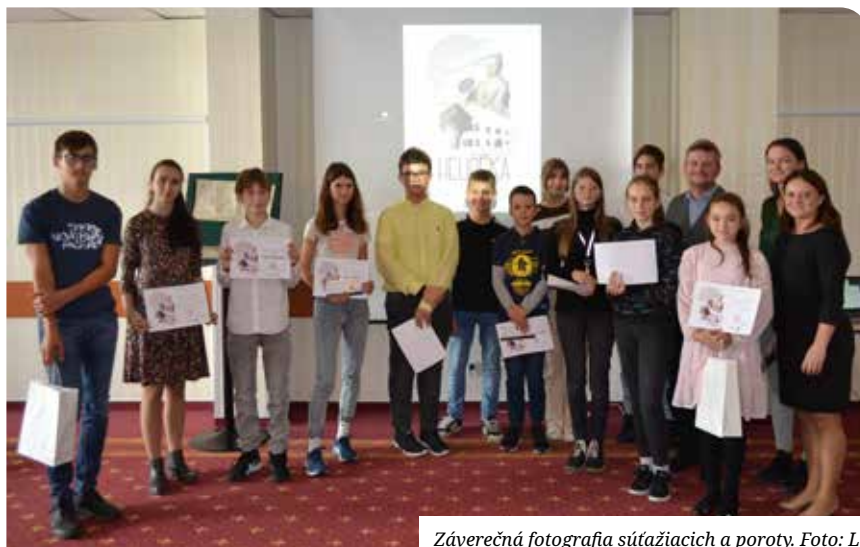
Záverečná fotografia súťažiacich a poroty.