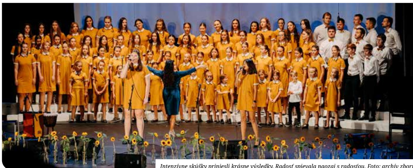
Intenzívne skúšky priniesli krásne výsledky. Radosť spievala naozaj s radosťou.

M: Pokračovať. Po koncerte sa nám hlásili mnohí rodičia, ktorí chcú prihlásiť deti do zboru. Sme otvorené spoločenstvo