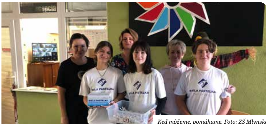
Keď môžeme, pomáhame.

Za dobrovolný príspevok sme rozdávali biele pastelky. V mene neziskovej organizácie Únia slabozrakých a nevidiacich Slovenska, ktorá zbierku organizuje a zastrešuje, ďakujeme všetkým rodičom, ktorí sa