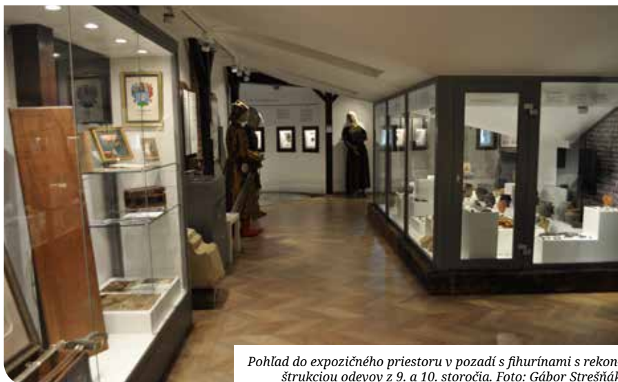
Pohľad do expozičného priestoru v pozadí s figurínami s rekonštrukciou odevov z 9. a 10. storočia.

V ďalšej miestnosti je spodná časť vitrín upravená pre spôsob postupného objavovania exponátov (zásuvky s obsahom listín, súborov stredovekých mincí napr. z blízkeho Čataja atď.). Ich horná časť sa venuje tematickým okruhom prvej písomnej zmienky Senca, sú tu vystavené richtárske kalichy Senca datované do roku 1614. Ďalej