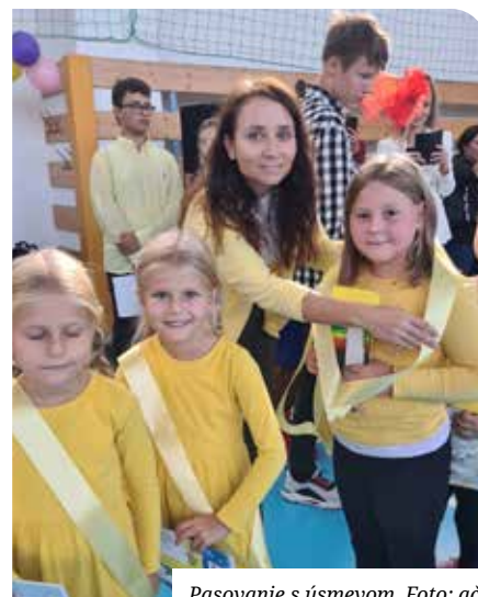
Pasovanie s úsmevom.