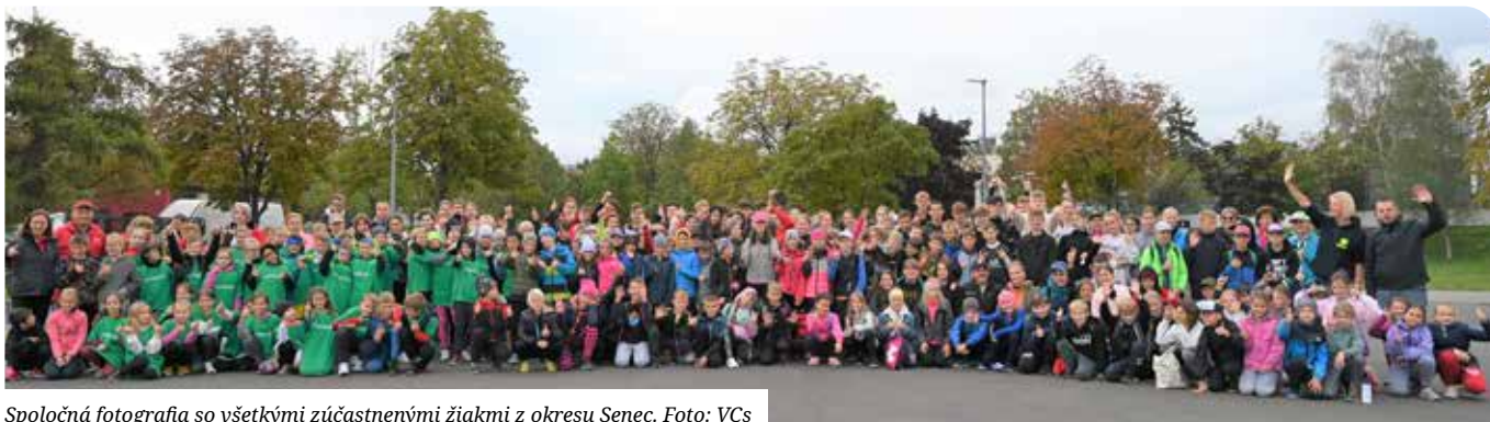
Spoločná fotografia so všetkými zúčastnenými žiakmi z okresu Senec.