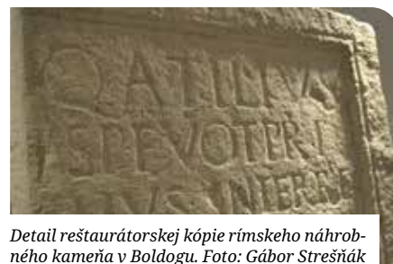
Detail reštaurátorskej kópie rímskeho náhrobného kameňa v Boldogu.

Vo vitrínach sú teda umiestnené exponáty a ideálne rekonštrukcie od mladšej doby kamennej po záver obdobia sťahovania národov. Niektorým obdobiam sa