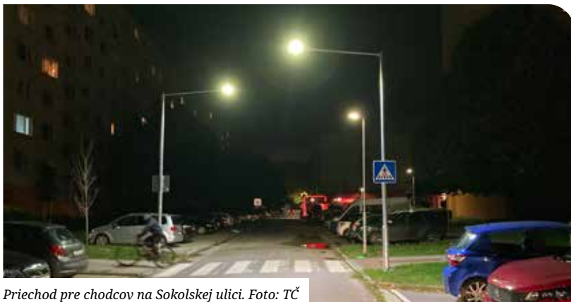
Priechod pre chodcov na Sokolskej ulici.