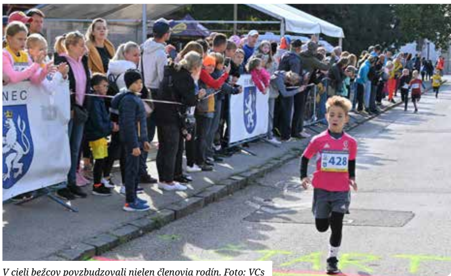
V cieľi bežcov povzbudzovali nielen členovia rodín.