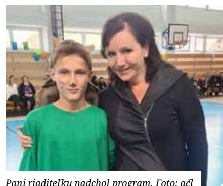
Pani riaditeľku nadchol program.