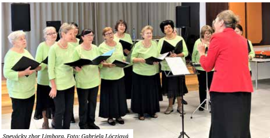
Spevácky zbor Limbora.