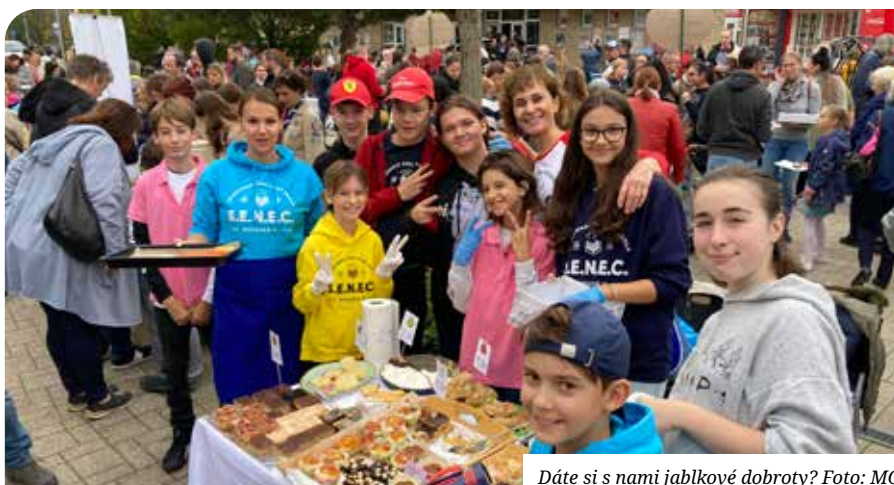
Dáte si s nami jablkové dobroty?