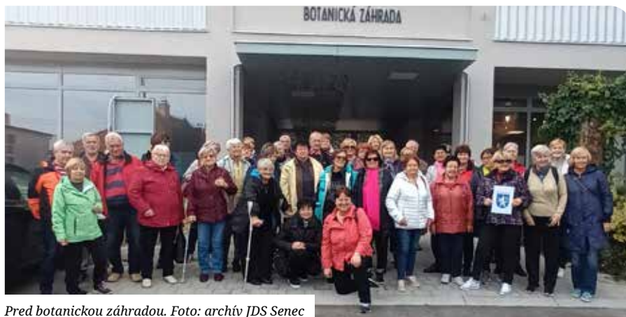
Pred botanicou záhradou.

Od leta každú stredu na Slávii pravidelne športujeme, po dobrej rozcvičke a strečingu, ktorý vedie Števo Mrva, hráme