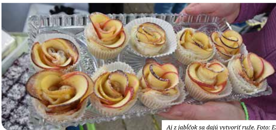
Aj z jabĺčok sa dajú vytvoriť ruže.