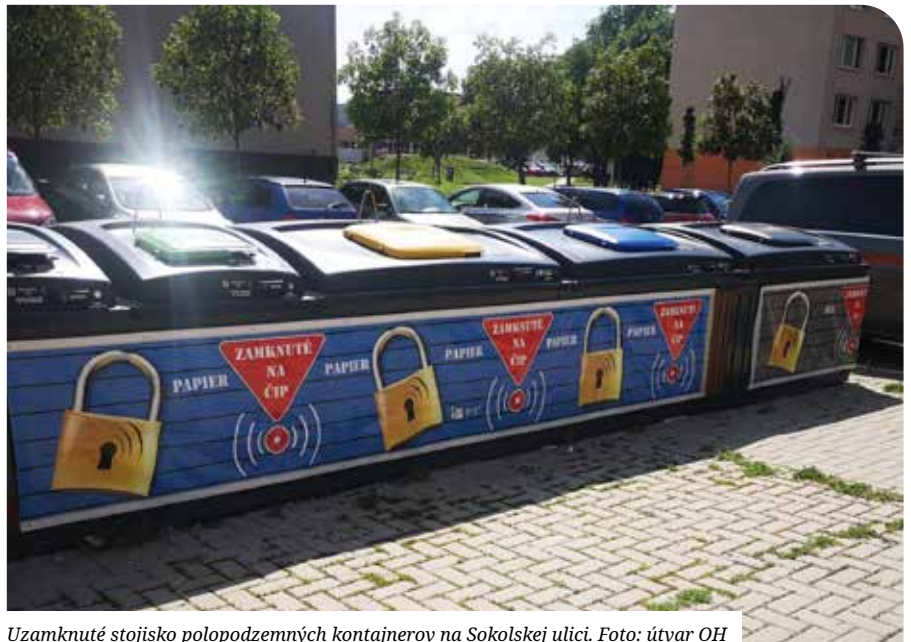
Uzamknuté stojisko polopodzemných kontajnerov na Sokolskej ulici.

Koncom augusta mesto nainštalovalo uzamykanie polopodzemných kontajnerov na Sokolskej ulici. Definitívne sa kontajner na tomto stojisku uzamkli začiatkom septembra. Majitelia bytov, ktoré patria k tomuto stojisku, si na referáte odpadového hospodárstva vyzdvihli čipy na otváranie kontajnerov.