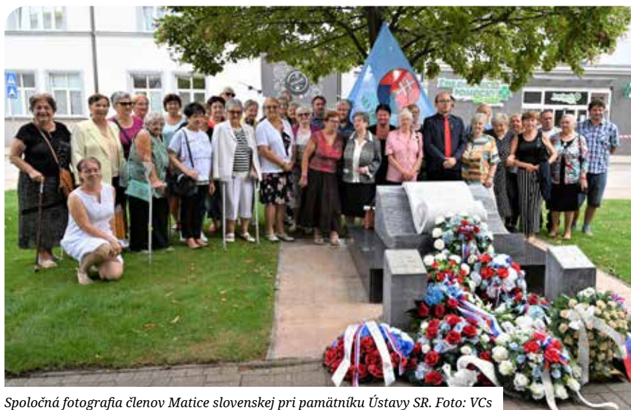
Spoločná fotografia členov Matice slovenskej pri pamätníku Ústavy SR.