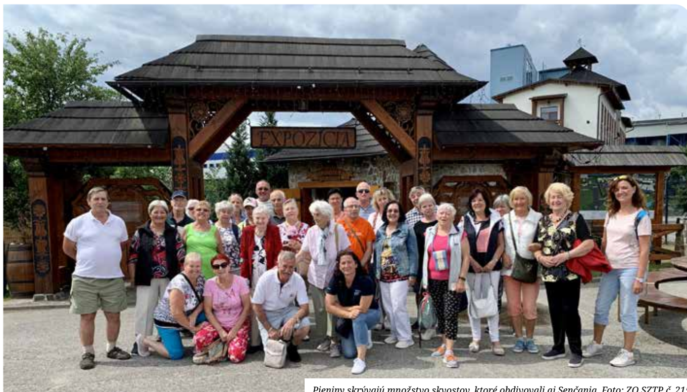
Pieniny skrývajú množstvo skvostov, ktoré obdivovali aj Senčania.