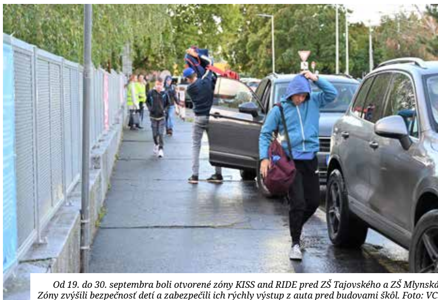
Od 19. do 30. septembra boli otvorené zóny KISS and RIDE pred ZŠ Tajovského a ZŠ Mlynská. Zóny zvýšili bezpečnosť detí a zabezpečili ich rýchly výstup z auta pred budovami škôl.