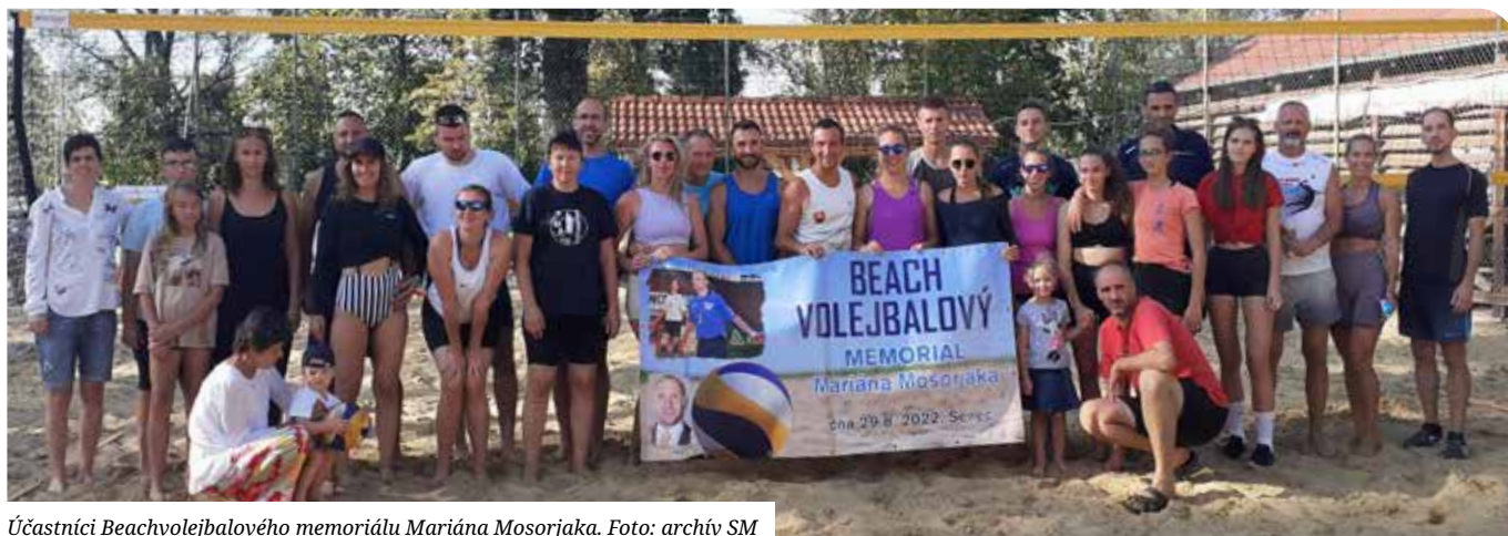
Účastníci Beachvolejbalového memoriálu Mariána Mosorjaka.