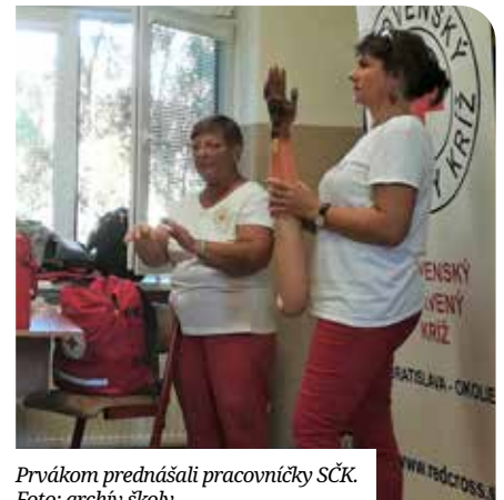
Prvákom prednášali pracovníčky SČK.

Elsőseink a Szeredi Holokausztmúzeumba látogattak. Részt vettek a holokauszt áldozatainak emléknapja alkalmából tartott ünnepségen. A második és harmadikos diákjaink az Élet- és egészségvédelem című tanfolyamon vettek részt, ahol a Szlovák Vöröskereszt munkatársai adtak elő. Friss tudásukat egy reszuscitációs gyakorlat bábun tesztelheték. Megnéztek egy természetvédelmi filmet is, majd kvízzel mértük fel, hogy mennyire figyeltek oda.