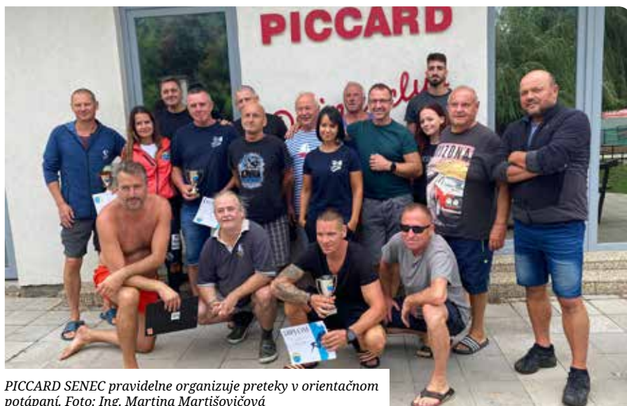
PICCARD SENEC pravidelne organizuje preteky v orientačnom potápaní.