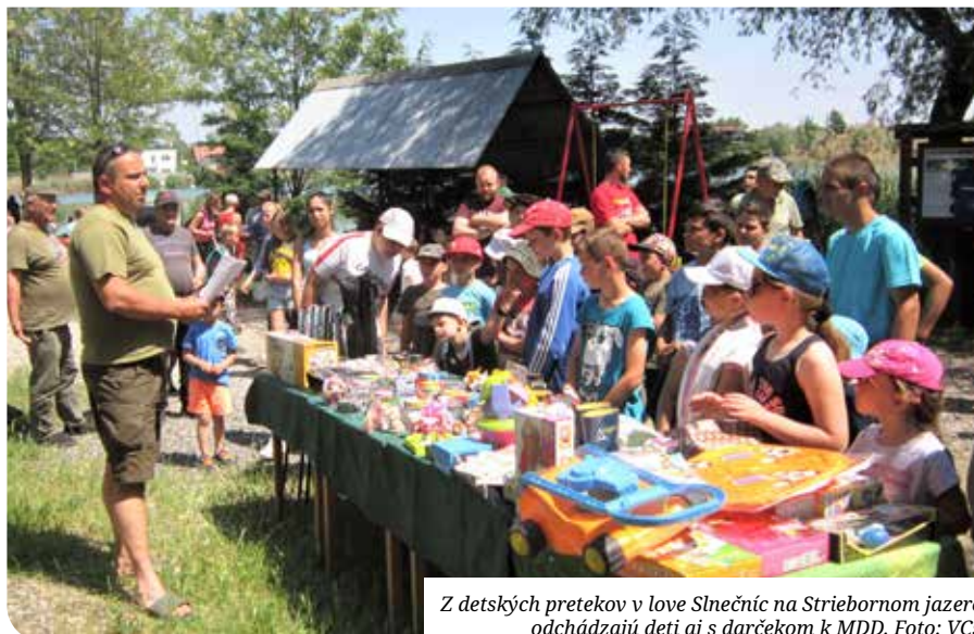
Z detských pretekov v love Slnecníc na Striebornom jazere odchádzajú deti aj s darčekom k MDD.

Tým, že počet obyvateľov Senca narastá, aj počet našich členov z roka na rok narastá. Hlásia sa k nám veľa ľudí aj kvôli tomu, že máme špeciálne zarybnené naše vody, možno jedny z najlepších na okolí. Najviac ľudí sa k nám hlási pred Vianocami a na začiatku sezóny, ale aj pandémia prispela k nárastu členskej základne, pretože rybárčenie bolo jedným z možných spôsobov dostať sa do prírody počas lockdownov.