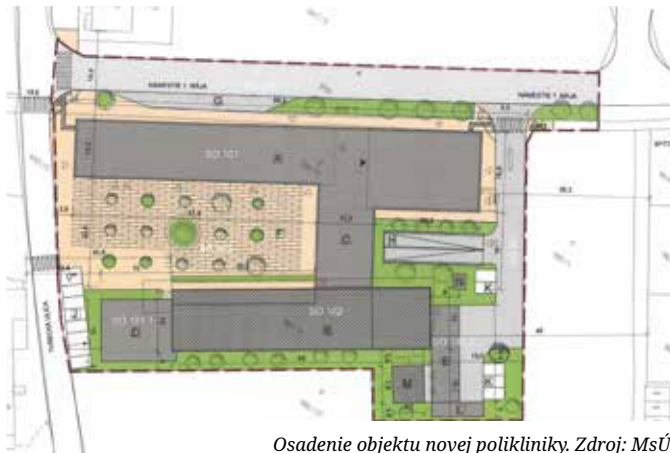
Osadenie objektu novej polikliniky.