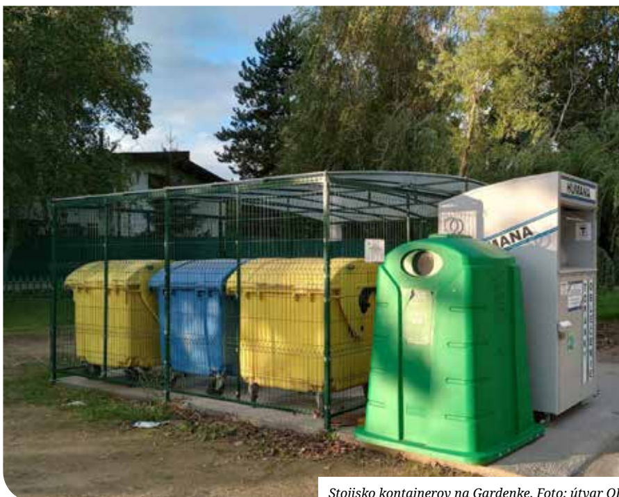
Stojisko kontajnerov na Gardenke.

Druhy preberaných odpadov: objemné odpady ako napr. sedačky roztriedené na drevo a potahy zvlášť, otičky narezané na cca 1,5m a zviazané, elektroodpady. Drobný stavebný odpad a pneumatiky sa v rámci