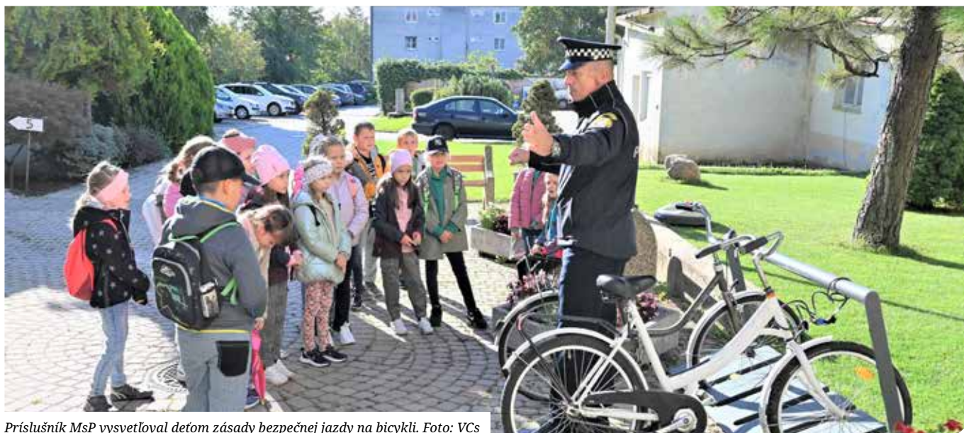
Príslušník MsP vysvetľoval deťom zásady bezpečnej jazdy na bicykli.