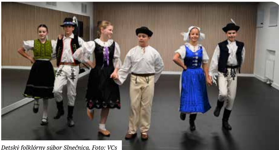
Detský folklórny súbor Slniečnica.