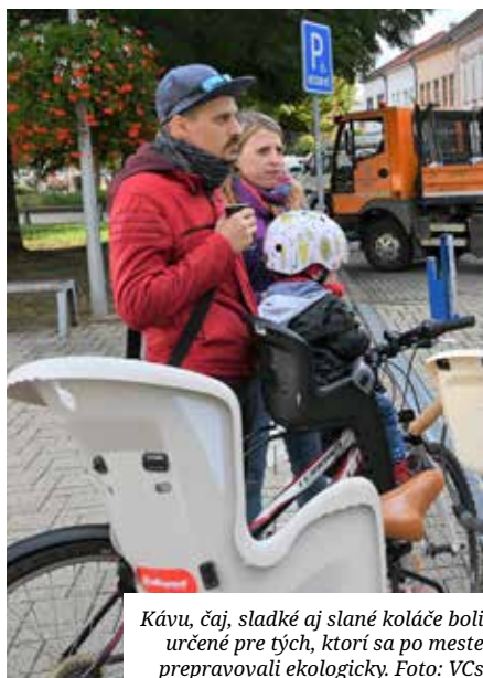
Kávu, čaj, sladké aj slané koláčce boli určené pre tých, ktorí sa po meste prepravovali ekologicky.