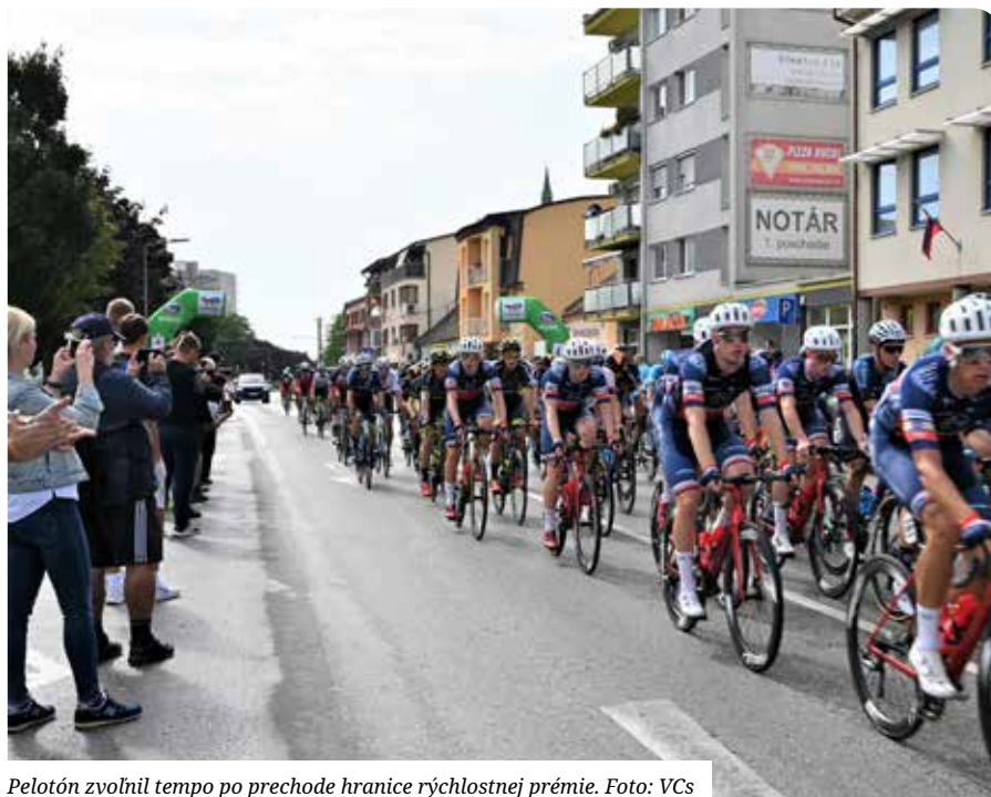
Pelotón zvolnil tempo po prechode hranice rýchlostnej premié.