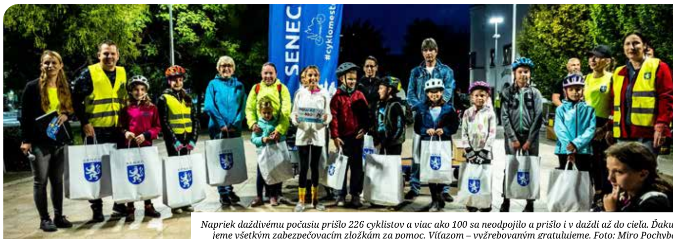
Napriek daždivému počasiu prišlo 226 cyklistov a viac ako 100 sa neodpojilo a prišlo i v daždi až do cieľa. Ďakujeme všetkým zabezpečovacím zložkám za pomoc. Víťazom – vyžrebovaným gratulujeme.