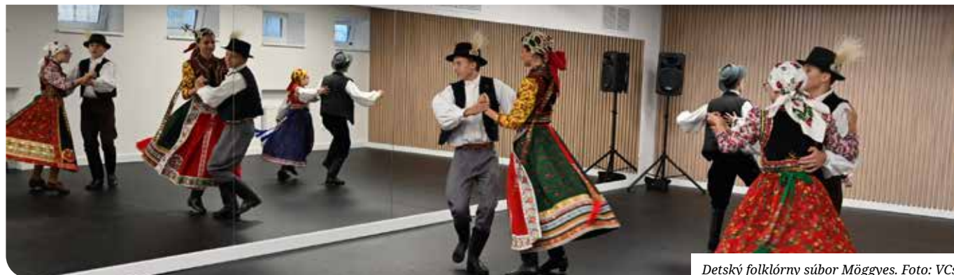
Detský folklórny súbor Mőggyes.