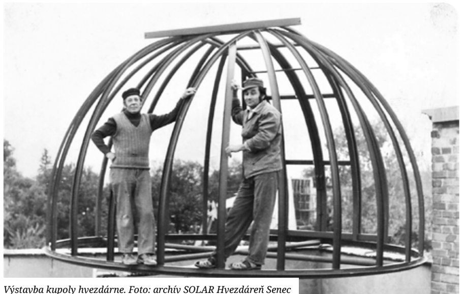
Výstavba kupoly hviezdárne.

Spočiatku boli na hviezdárni inštalované ďalekohľady patriace členom združenia, ale v roku 2009, ktorý sa niesol v znamení Medzinárodného roku astronómie, vyhlásila Agentúra na podporu výskumu a vývoja výzvu na predkladanie projektov LPP na podporu ľudského potenciálu v oblasti výskumu, vývoja a popularizácie vedy. Združenie v spolupráci s mestom Senec a Základnou školou s VJM A. M. Szencziho vypracovalo spoločný projekt „Hviezdáreň a planetárium Senec“ LPP-0302-09. A získalo prostriedky na rozvoj a znovuzrodenie hviezdárne.