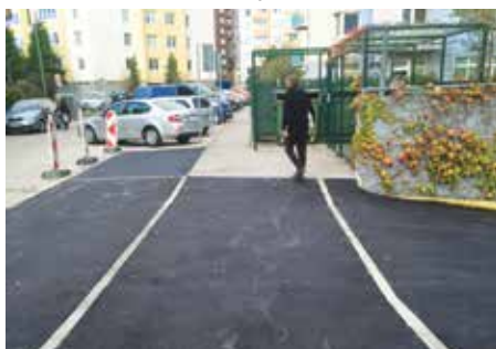
Turecká ulica - výšková úprava chodníka s parkoviskom