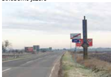
Posun názvu obce pre zníženie rýchlosti