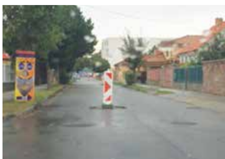
Výšková úprava pokloпов Fándlyho