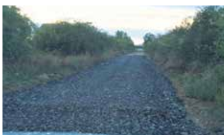
Úprava povrchu cesty v ovocnom sade