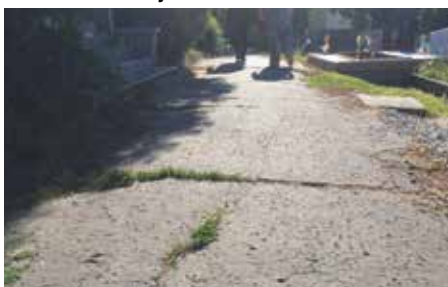
Pôvodný chodník na starom cintoríne