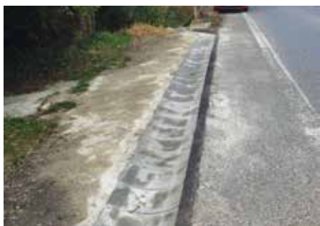
Odvodňovací rigol záhradkárská osada Strieborné jazero