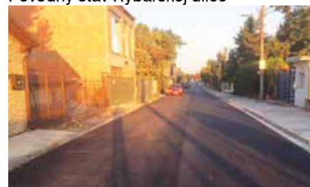
Rybárska ulica po asfaltovaní