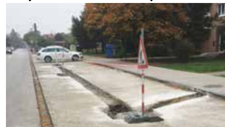
Odvodnenie parkoviska Jánošíkova