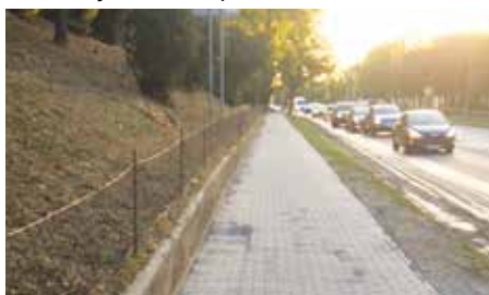
Nový chodník pod kostolom