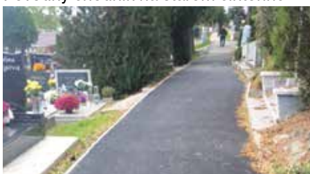
Nový chodník na starom cintoríne