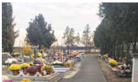
Nové chodníky na novom cintoríne