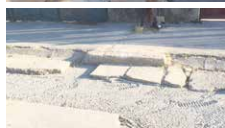
Pôvodný stav Rybárskej ulice