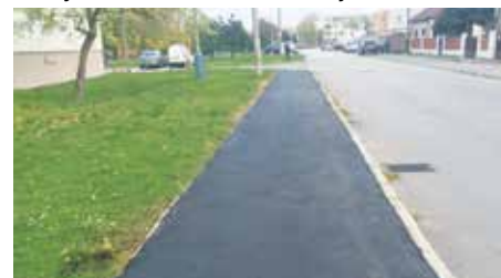
Nový chodník na Sokolskej ulici