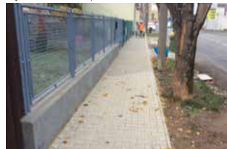
Nový chodník na Boldockej ulici