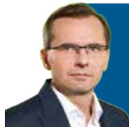
ĽUBOMÍR GALKO poslanec NR SR