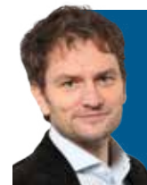
IGOR MATOVIČ predseda OLaNO

V prvom rade ho vnímam ako človeka s chrbtovou kosťou. Poznám ho ako veľmi schopného a dynamického manažéra. Som veľmi rada, že sme ho postavili práve do župných volieb v Bratislavskom kraji, pretože ten je moja srdcovka.