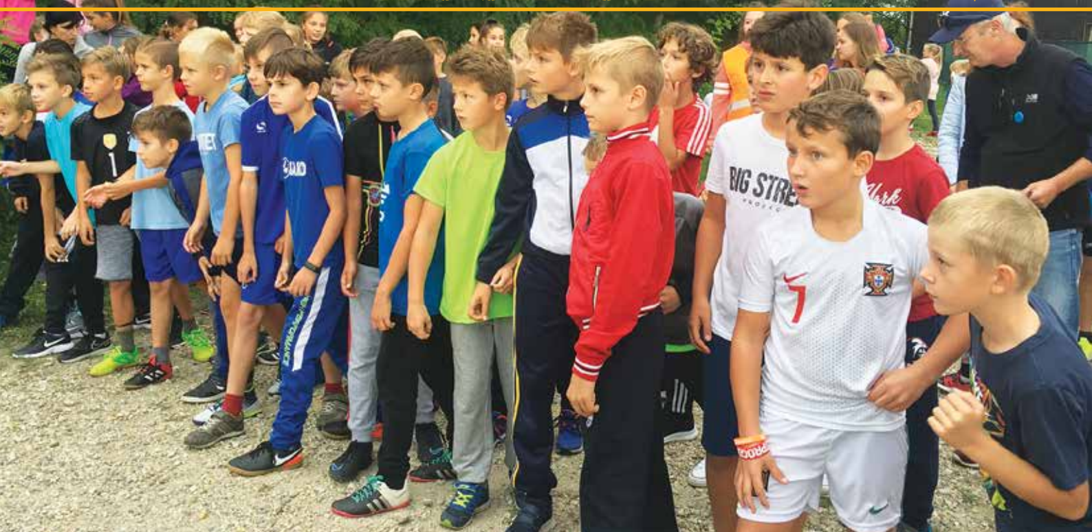
September patril športovo najmä bežcom. Beh zdravia sa uskutočnil už po 30. raz a Senecký beh okolo Slnečných jazier už deviaty raz.