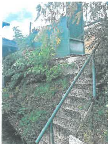
Svahovitá časť pozemku zo severnej strany