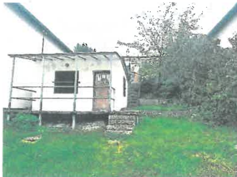
Južný pohľad od vodnej plochy

Pozemok parc. č. 2310/89, k.ú. Senec, Rybárska ulica 85, Senec