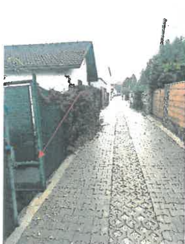
Hlavný vstup k pozemku z uličnej strany