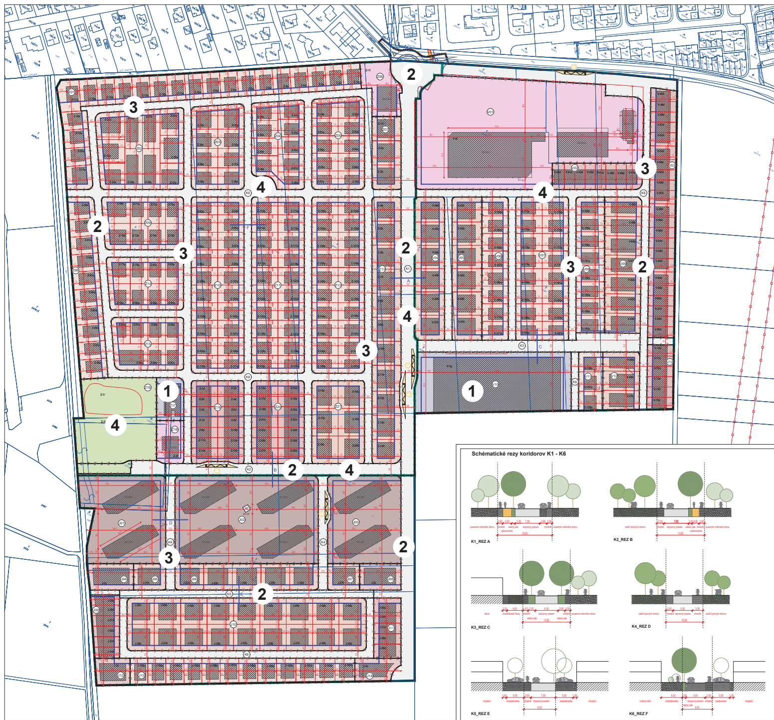
SCHÉMA ZÁVÄZNÝCH ČASTÍ A VEREJNOPROSPEŠNÝCH STAVIEB