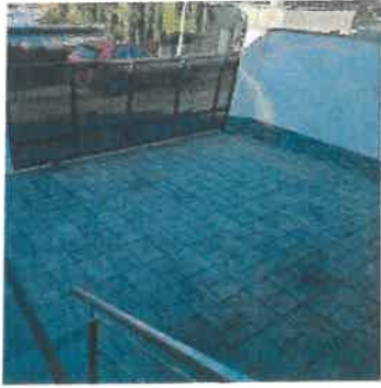
predná časť p.č.2386/8