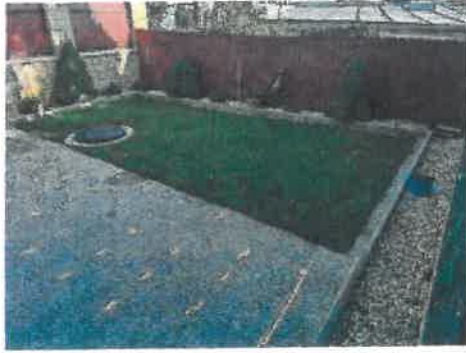
zadná časť p.č.2371/488